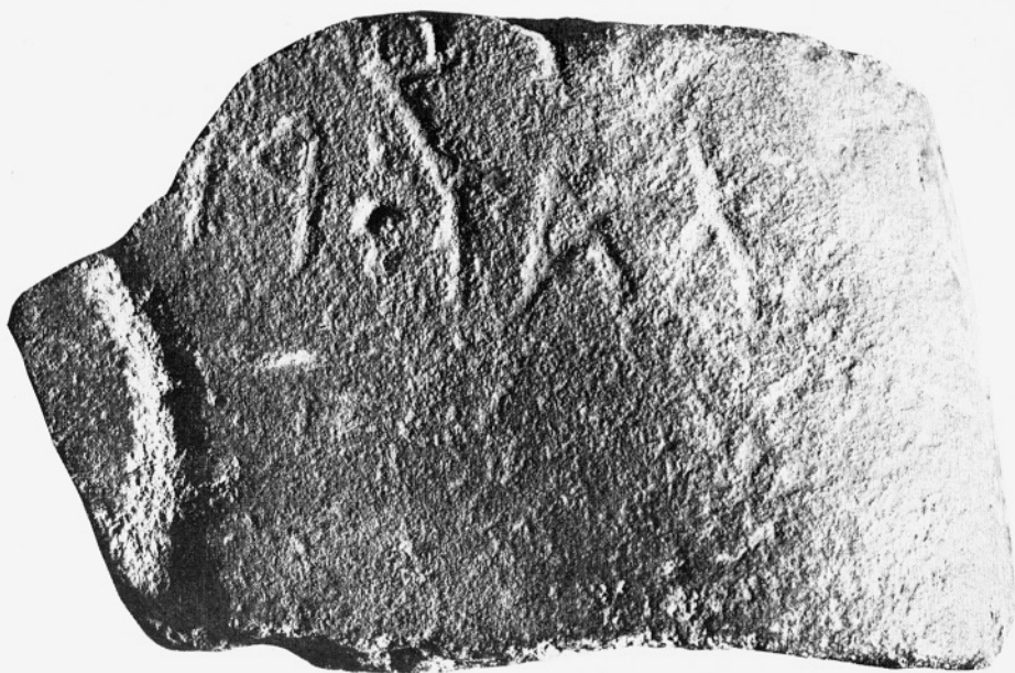
Kamen z napisom z Vintarjevca pri Litiji