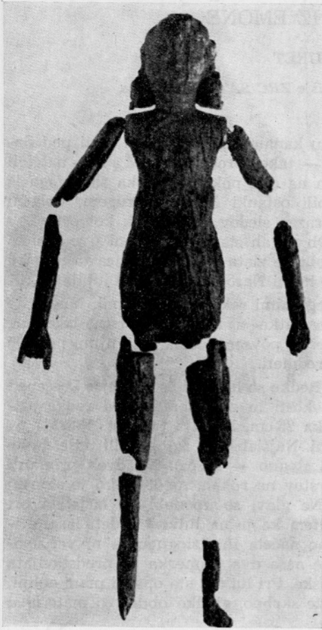
Sl. 1: Lutka 1. Slonova kost, višina 25 cm. — Narodni muzej v Ljubljani (inv. št. R 6930). — (Foto: Božo Štajer.)

Abb. 1: Puppe 1. Elfenbein, Höhe 25 cm. — Narodni muzej in Ljubljana (Inv. Nr. R 6930). — (Foto: Božo Štajer.)