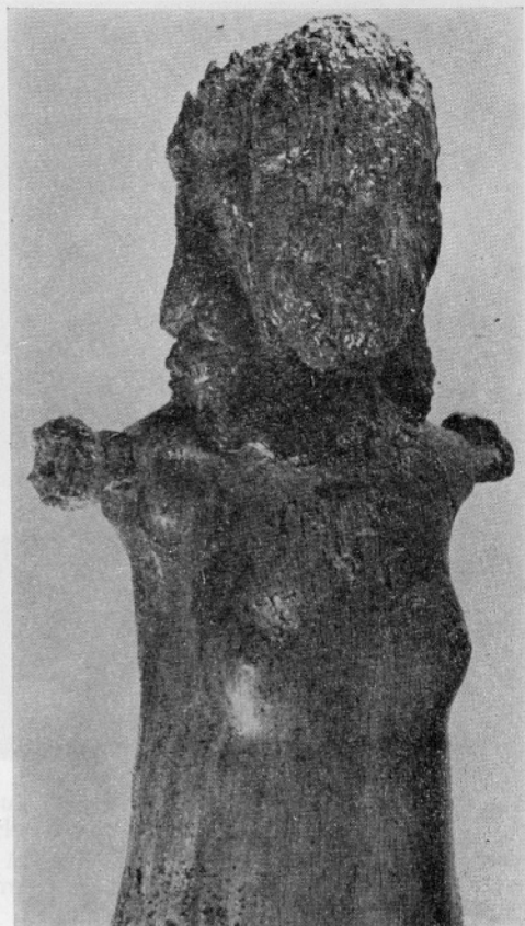
Sl. 3: Detajl trupa ljubljanske lutke 2.