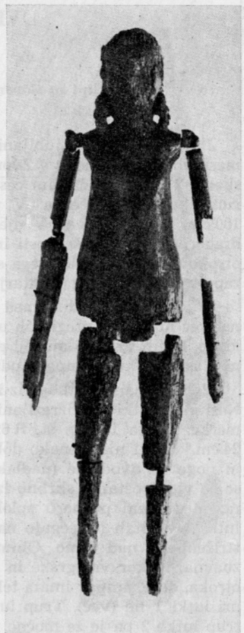
Sl. 2: Lutka 2. Slonova kost, višina 24 cm. — Narodni muzej v Ljubljani (inv. št. R 6931). — (Foto: Božo Štajer.)

Abb. 1: Puppe 1. Elfenbein, Höhe 25 cm. — Narodni muzej in Ljubljana (Inv. Nr. R 6930). — (Foto: Božo Štajer.)