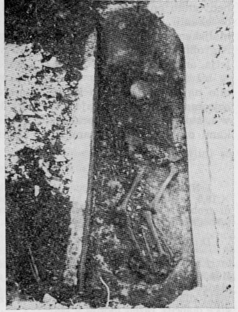
Sl. 1: Pogled na krovne plošče pozno antične grobnice v Loki pri Črnomlju.