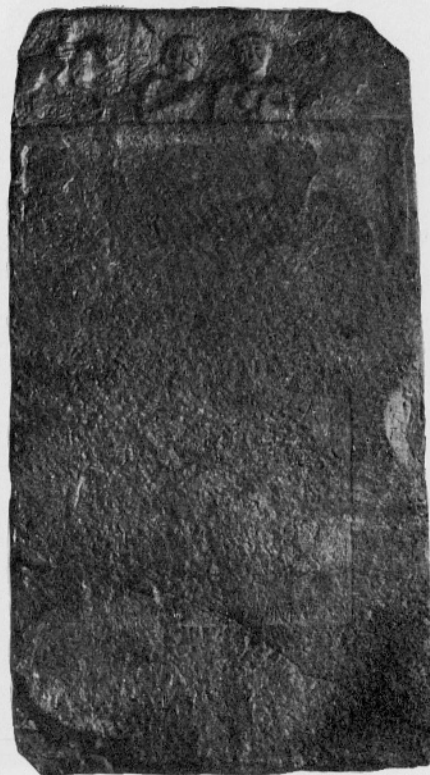
Sl. 7: Nagrobnik št. 4.

Fig. 6: Monument funéraire No 3.