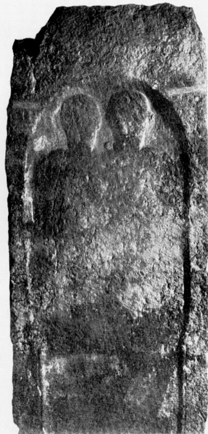
Sl. 9: Nagrobnik št. 6.