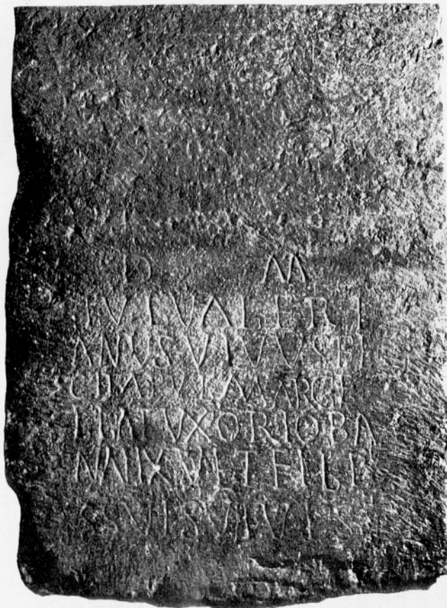
Sl. 8: Nagrobnik št. 5.