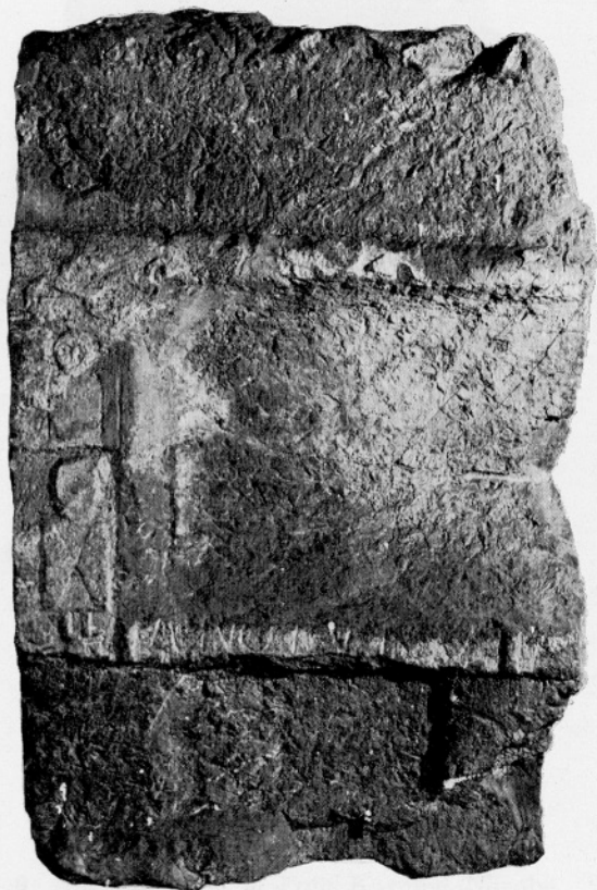
Sl. 5: Nagrobnik št. 2.

Fig. 4: Monument funéraire No 1.