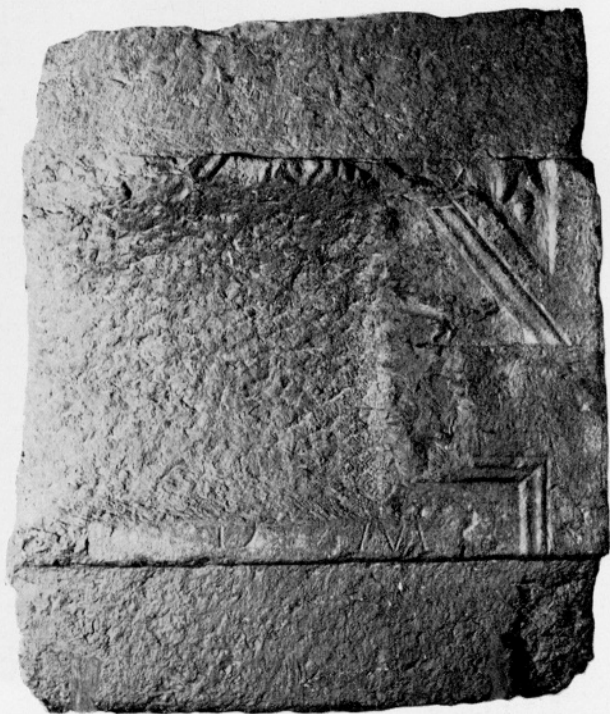
Sl. 4: Nagrobnik št. 1.

Fig. 4: Monument funéraire No 1.