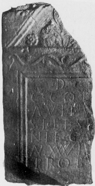
Sl. 6: Nagrobnik št. 3.

Fig. 6: Monument funéraire No 3.