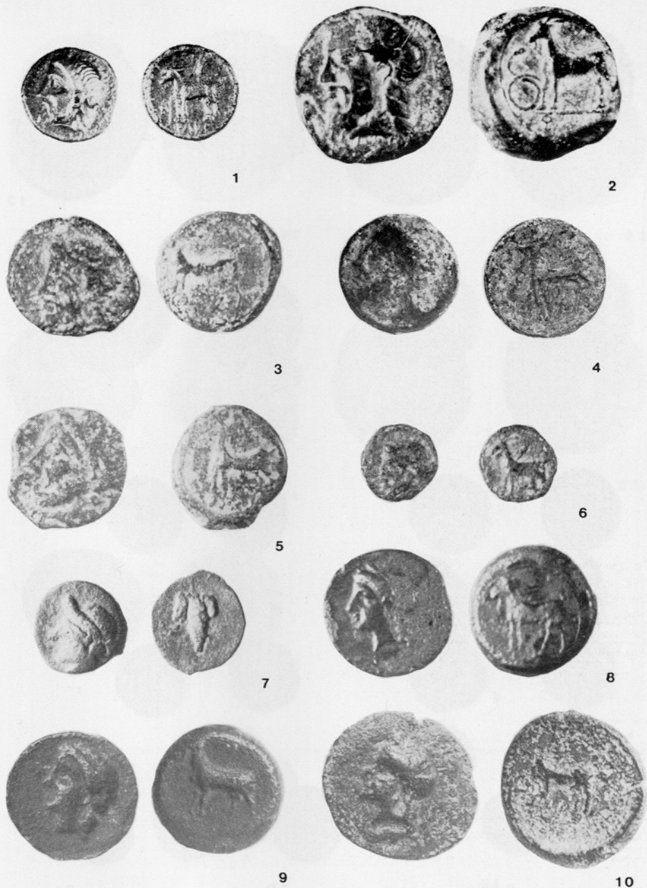
T. 1: Novac Farosa iz zbirke Machiedo, Split. 1 emisija u srebru (kat. 1); 2 emisija u bronci, tip Zeus/koza, velika nominala (kat. 2); 3—5 emisija u bronci, tip Zeus/koza, srednja nominala (kat. 7, 17, 23); 6 emisija u bronci, tip Zeus/koza, mala nominala (kat. 29); 7 emisija u bronci, tip Dioniz/grozd (kat. 31); 8—10 emisija u bronci, tip Perzefona/koza, veća nominala (kat. 33, 52, 54).