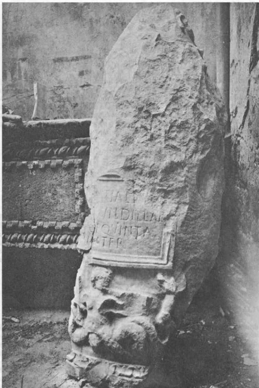
Sl. 2: Liburnski nadgrobní spomenik iz Asserije pohranjen u Arheološkom muzeju u Zadru (kat. br. 6).