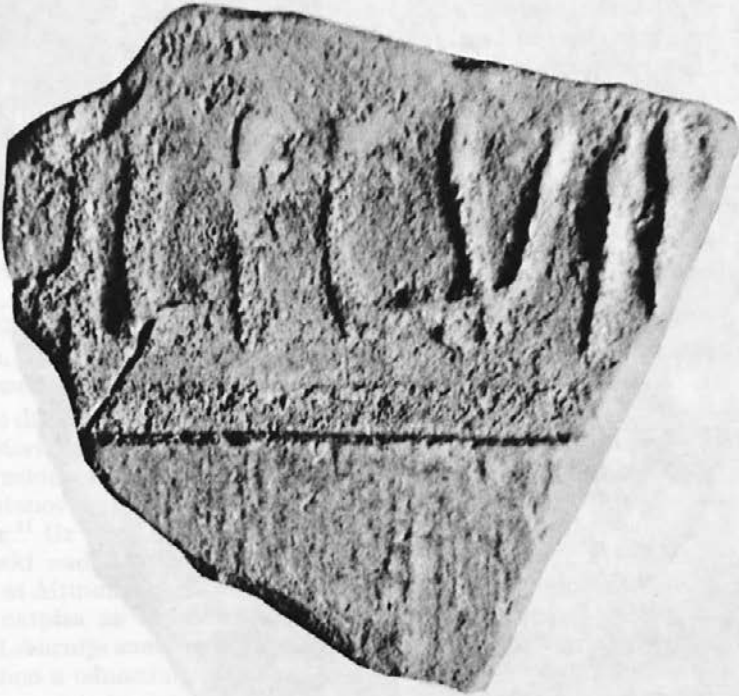
T. 1: Gračine na Humcu kod Ljubuškog, tegula sa pečatom LEG VII[I AVG], iskopana 1978. g.