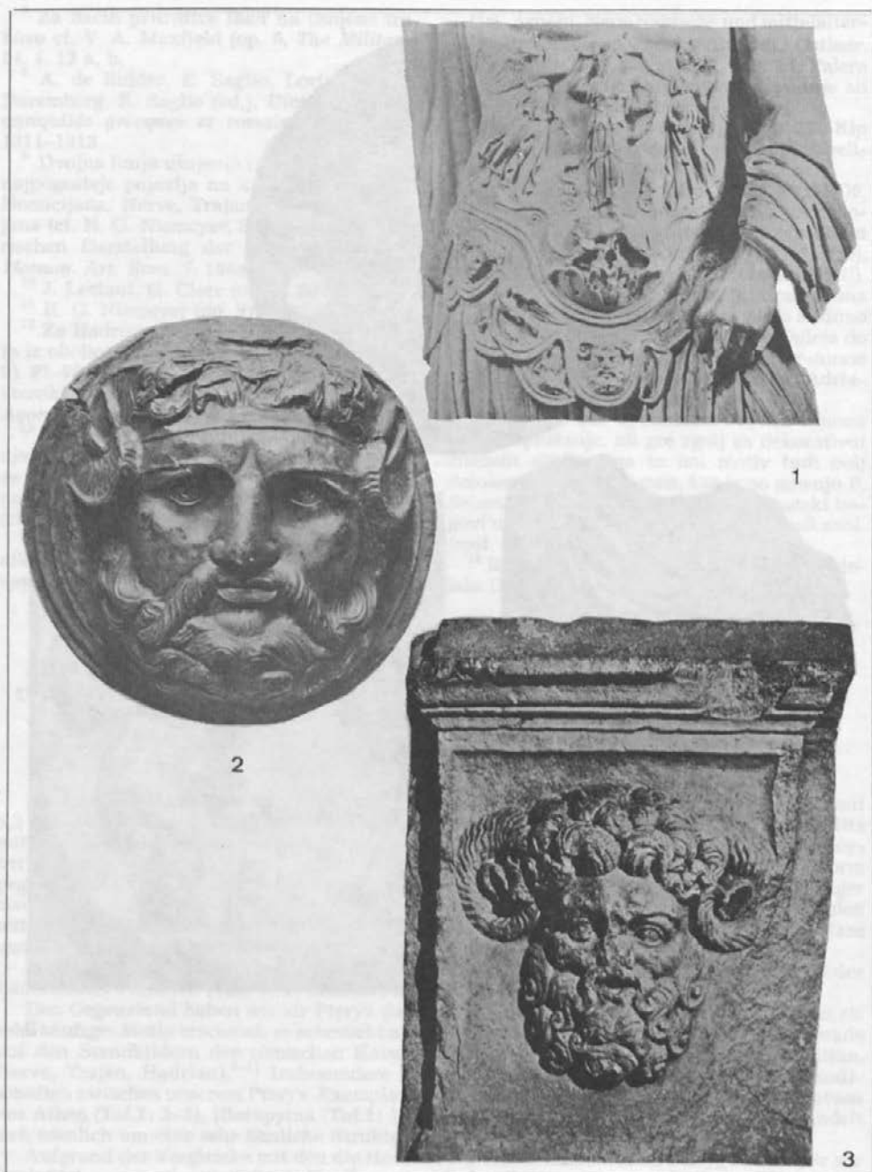
T. 2: 1 Hierapitna. Osrednji del oklepa na kipu cesarja Hadrijana. 2 Lauersfort. Bronasta falera z Jupitrom-Amonom. 3 Pula. Relief Jupitra-Amona na žrtveniku. Taf. 2: 1 Hierapytna. Mittelteil des Harnisches auf der Statue des Kaisers Hadrian. 2 Lauersfort. Bronzephalere mit Jupiter-Ammon. 3 Pula. Relief des Jupiter-Ammon auf dem Opferaltar.