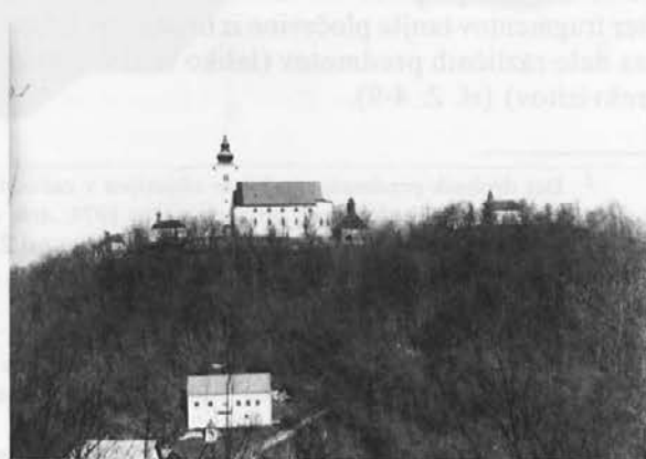
Sl. 1: Svete Gore. Pogled z vzhoda.

ni dejavniki in gradbena dela od rimskega časa dalje do zdaj nenehno preoblikovala in so se tako na njem zabrisale številne sledi življenja iz sta-