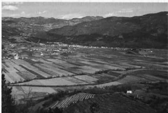
Sl. 5: Pogled na območje domnevnega prizorišča bitke z utrdbe Sv. Pavel nad Planino. Abb. 5: Blick von der befestigten Siedlung Sv. Pavel oberhalb von Planina auf den Bereich des mutmaßlichen Schlachtfeldes.