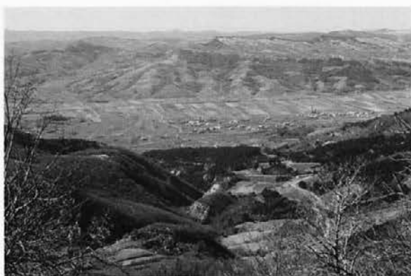
Sl. 6: Pogled na območje domnevnega prizorišča bitke z rimske ceste blizu Cola. Na nasprotni strani doline je v sredini vidna utrdba Sv. Pavel nad Planino.