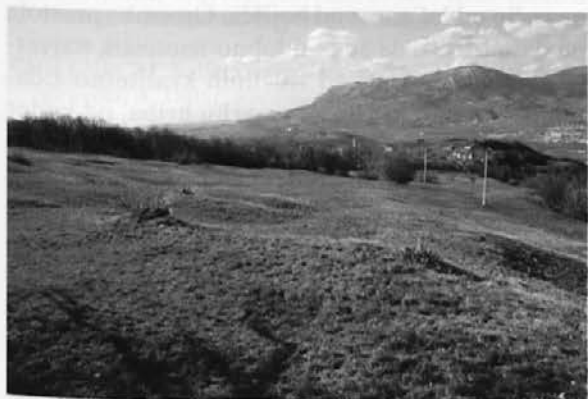
Sl. 4: Pogled od cerkve Sv. Pavla po razgibani površini dela notranjosti utrdbe. Desno v ozadju Ajdovščina. Abb. 4: Blick von der Kirche des hl. Paulus auf das wellige Relief in einem Teil des Innenbereiches der befestigten Siedlung. Rechts im Hintergrund Ajdovščina.

Ob topografskih obhodih Vipavske doline sem se večkrat pomudil pri utrdbi Sv. Pavel nad Planino, ki je najpomembnejša arheološka lokacija iz tega obdobja na širšem območju bojišča, saj je v ravni črti oddaljena od njegovega središča približno 3 km. Čeprav je arheološko z izjemo manjših zaščitnih del na vrhu komaj dotaknjena, s svojimi razsežnostmi in površinsko izoblikovanostjo vendarle daje precej informacij, ki nakazujejo njeno vlogo (Svoljšak 1966; Petru 1972, 359; ANSI 1975, 121 (z navedeno starejšo literaturo); Ciglencečki 1987, 81-82, Osmuk 1991, 212; gl. tudi primerjavo postojank sorodnega tipa v tem članku na str. 193s). Oglejmo si torej nekoliko podrobneje podobo najdišča, ki se z dosedanjimi arheološkimi najdbami umešča v čas bitke oziroma večji del poznorimskega obdobja.