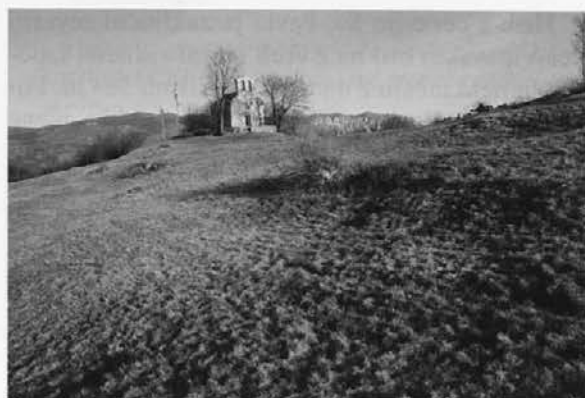
Sl.3: Zgornji del notranjosti utrdbe s cerkvijo sv. Pavla. Abb. 3: Oberer Teil des Innenbereiches der befestigten Siedlung mit der Kirche des hl. Paulus.

njala itinerarsko cesto, ki je s Cola vodila proti Ajdovščini, sta na njej - povsem logično - domnevala zaporo, ki naj bi jo na starem prazgodovinskem gradišču posebej vojaški oddelek 500 mož ( numerus ), kar bi po njenem mnenju zadoščevalo za preusmeritev Teodozijeve vojske proti Vipavi. Glede na njun tekst in priloženo karto jo je treba iskati nekako zahodno od območja, kjer se odcepi cesta za Vipavo. Omenjeno območje sem natančneje pregledal in ugotovil: edina izrazitejša vzpetina, ki leži v tem območju je manjši greben, ki pa je bil močno poškodovan ob razširitvi ceste proti Ajdovščini. Na ostanku vzpetine, posebno v profilu ob cesti, ni arheoloških sledov. Tudi izoblikovanost hriba in njegova lega na pobočju ne kažeta na prazgodovinsko gradišče. Vsekakor pa bi tu ali v neposredni bližini smeli pričakovati jarke ali morda palisade, saj je bila to edina možnost za preusmeritev Teodozijeve vojske. In prav to bi bila ena izmed prvih nalog, ki