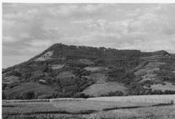
Sl. 2: Pogled na Sv. Pavel nad Planino iz Vipavske doline. Abb. 2: Blick auf Sv. Pavel oberhalb von Planina vom Tal Vipavska dolina.