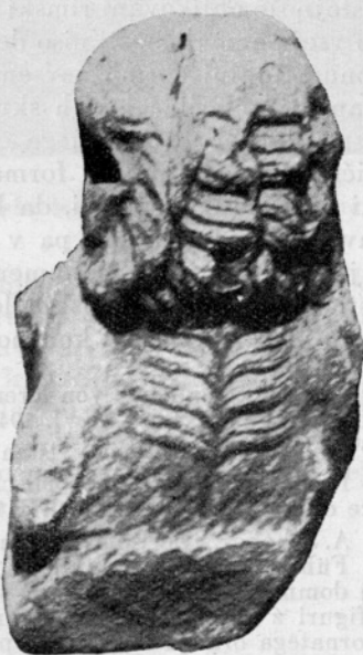
Sl. 12. Maribor, Pokrajinski muzej, Rimski lev iz Slovenskih Konjic