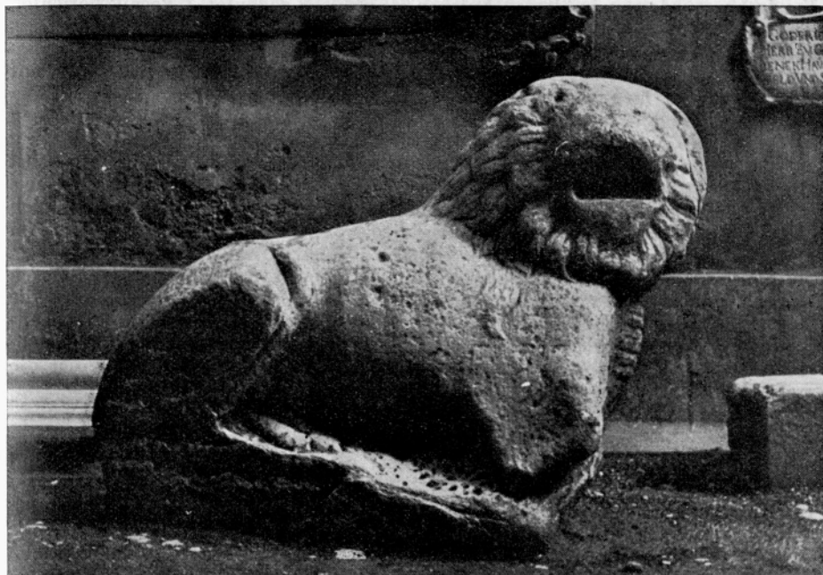
Sl. 13. Maribor, Pokrajinski muzej, Rimski lev iz Slovenskih Konjic

Pač pa loči kostanjeviškega leva od vseh drugih motiv konjske glave pod prednjo šapo. Najpogosteje nastopa na tem mestu pač ovnova glava,