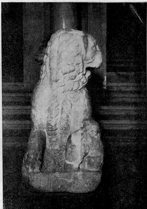
Sl. 2. Ljubljana, Narodni muzej, Rimski lev iz Kostanjevice

Rimski levji tip je grškemu nasproten. Živalsko telo želi podati čim bolj realno, naravi verno. V ta krog naj bi sodile vse rimske levje upodobitve na slovenskih tleh, med katerimi kaže n. pr. lev iz Laškega 6 kar baročno razgibano, toda še vedno močno realistično formo. Ob kostanjeviškem levu pa se sklicuje Ložar na Ferrija (o. c.), ki je zapisal, da