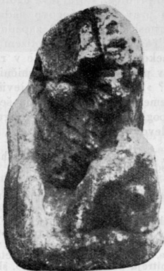
Sl. 11. Rimske toplice, Rimski lev na dvorišču zdravilišča