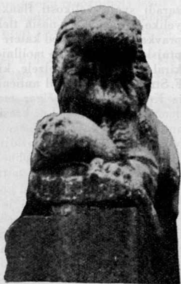
Sl. 8.—10. Polzela, Rimski lev na stopnicah Komende