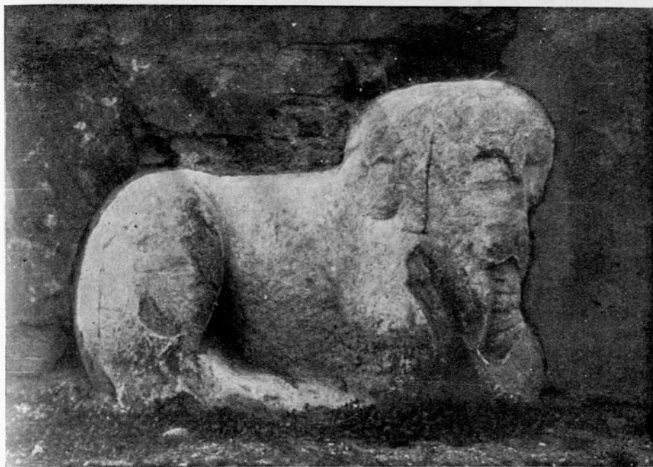
Sl. 5. Maribor, Rimski lev, vzdian v podnožje stolpa stolnice