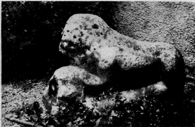
Sl. 7. Rimske toplice, Rimski lev na dvorišču zdravilišča

dvema navzven obrnjenima ležečima levoma z živalsko, navadno ovnovo glavo pod prednjo šapo ter s cisto ali z Amonovo glavo v sredi, kakršne poznamo skoraj z vseh naših rimskih najdišč, najlepše pa seveda iz Ptuja 26 in ki jih A. Schober, 27 razlaga s Kybelinim kultom, se nam je ohranilo tudi nekaj večjih in samostojnejših levjih plastik, ki nam osvetljujejo tudi problematiko kostanjeviškega leva. Nekatere je omenil že Ložar: leva iz Laškega, 28 ptujskega leva z vojakom v orientalnem oblačilu pod tacami 29 — ki bi bolj kot kostanjeviški zaslužil dvom v svoje antično poreklo — fragmentiranega leva, ki je vzdian na dvorišču nek-