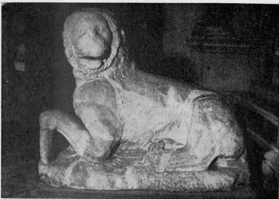
Sl. 1. Ljubljana, Narodni muzej, Rimski lev iz Kostanjevice