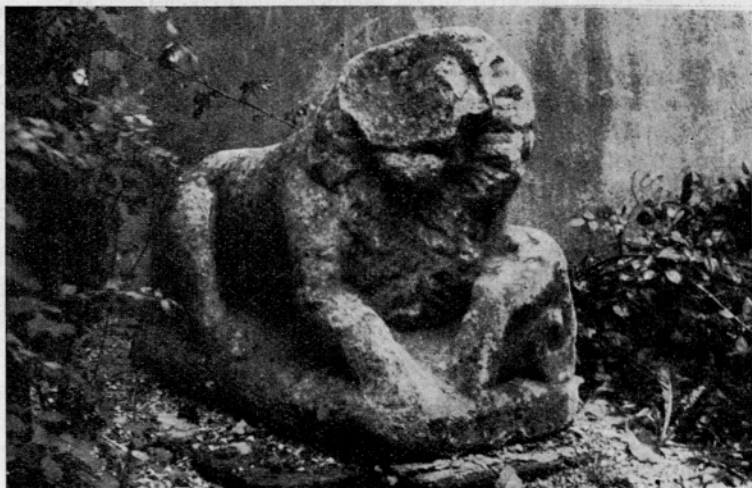
Sl. 6. Rimske toplice, Rimski lev na dvorišču zdravilišča