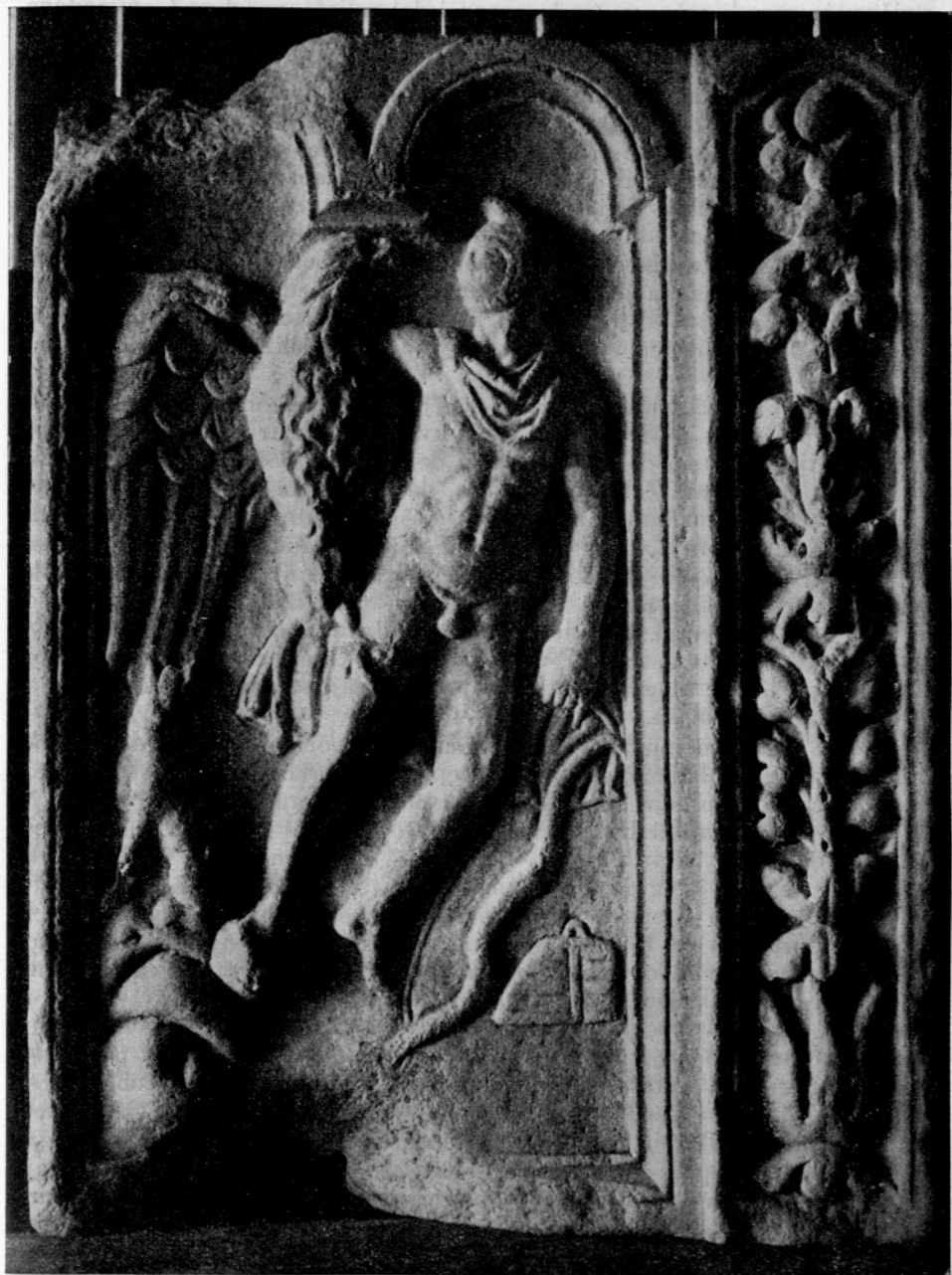
Sl. 1. Ganimed, Šempeter v Savinjski dolini. Pohorski marmor