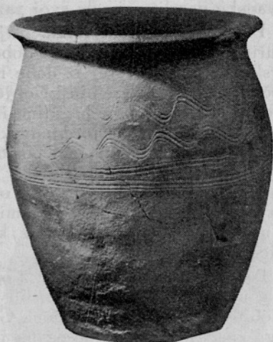
Sl. 2. Lonec starejše plasti

Po posameznih sondažnih delih prof. L. Piča je začel Arheološki zavod ČSAV leta 1948 sestavno raziskovanje, ki bo letos dokončano. 12, 13, 14 Celotno raziskovanje je torej zahtevalo že deset let delovnih sezon, često trajajočih do pol leta. 15