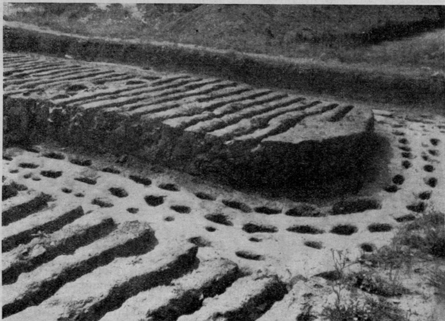
Sl. 7. Osnove stavbe prekrte z mlajšim srednjim obzidjem

obnove jarka in okopa, ni moč v obrambni ureditvi gledati začasne naprave, marveč stalno, trajajočo dejansko vso dobo razcveta Staré Kouřime. Ker vojaških vzrokov glede na smotrno postavitev okopa ni moč resno upoštevati moremo pomen jezera pripustiti le družbeno-kulturnim vzrokom, s katerimi gospodarski in vojaški pomen obstoja vode znotraj gradišča ni spodbit. Za to razlago priča seveda tudi sam prostor, izvzet iz obče uporabe, kot nekak posvečeni kraj, dostopen le svečeniku, dalje