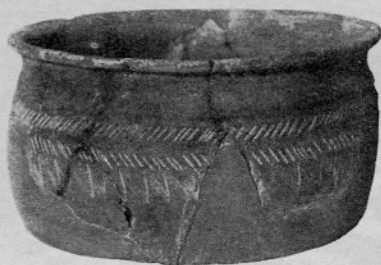
Sl. 6. Del lonca mlajše plasti

spodnjega vodnega izvira, izvirajočega v največji globini v srednjem gradiščnem arealu pod akropolo. Danes vidimo na tem mestu močvirno mlako s premerom 4 \times 8 metrov. Z raziskovanjem pa smo spoznali, da je v staroslovanski dobi tu bil obsežen vodni zbiralnik v velikosti 30 \times 70 metrov z umetno odsekanimi bregovi, ki so bili utrjeni s sestavo kolov. Ker je bil vodni izvir sredi gradišča za njegove prebivalce neprecenljiv činitelj tako z gospodarskega kot z vojaškega vidika, ni bilo čudno, da je ta vir njihovega življenja bil dostojno urejen. Soglasno s tem pa je prišlo do ureditve, ki zahteva pri interpretaciji globljega premisleka. Vodni zbiralnik je bil na strani s smerjo k akropoli, naravnemu središču vsega gradišča obdan z jarkom, v obsegu okoli 15 m, izdelanim preko srednjega gradiščnega ozemlja med notranjim in srednjim nasipom v mirnem loku. V smeri k akropoli je bil tedaj pristop mogoč le tik ob notranjem nasipu. Na notranji strani jarka je bila ugotovljena enostavna palisada. Prostor med vodnim zbiralnikom in jarkom z okopom je bil pristopen na obeh straneh z ozkimi vhodi ter zavarovan s prečnimi zaporami. Na zunanji strani, proti sovražniku, kjer bi bil obrambni vzrok za to pomembnejši, ni bila odkrita analogna situacija. Ker je v tretji slovanski gradbeni dobi na Kouřimi prišlo do