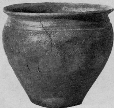
Sl. 5. Lonec mlajše plasti

Že v tej starejši stavbni dobi je prišlo do zanimive preureditve prostora ob jezercu, zvanem od davna Libušino. 23 Gre za izkoriščanje