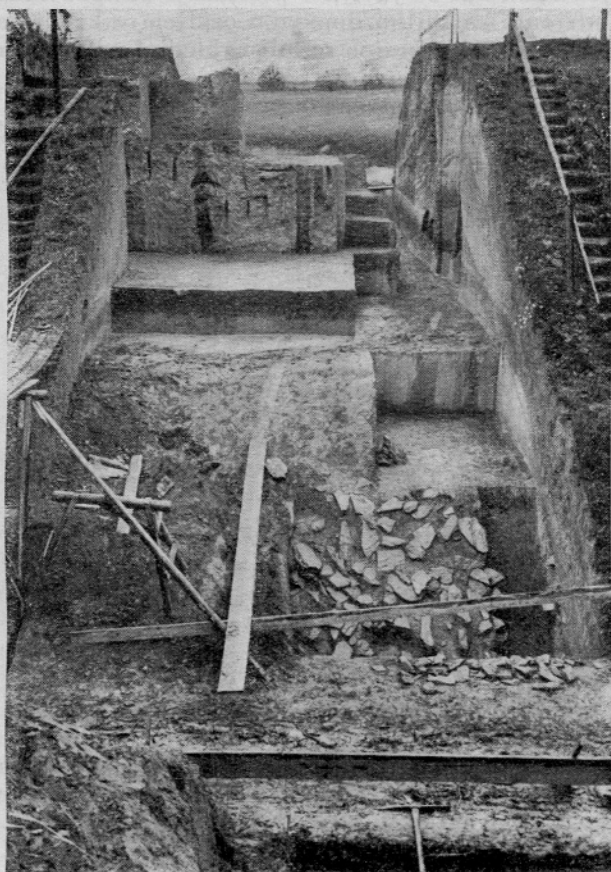
Sl. 9. Sonda v zunanjem obzidju. Spredaj jarek s porušnim kamenjem, zadaj zunanja stena obzidja in njegova konstrukcija

Tretja slovanska doba ima najnaprednejši značaj, čeprav v načelu razdelitev posameznih prostorov in torej tudi obseg gradišča ostane ne-