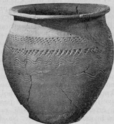
Sl. 4. Lonec mlajše plasti

kolov, postavljena navpik v smeri posameznih koč iz stebrov. Zunaj ograje iz kolov smo našli na severovzhodni strani vrsto bolj grobih jam z nepravilnim tlorisom in s členovitim dnom, gosto izpolnjene s sporadično vsebino vsevprek atipičnih črepinj, ki jih moremo prisoditi temu ljudstvu. Gre očitno za jame, izkopane pri pridobivanju gline za stavbe ali iz drugih gospodarskih vzrokov. Celotna meja lužiške naselbine pa ni mogla biti ugotovljena. Ograja iz kolov varuje naselje le z ene strani in ne obdaja vsega naselja.