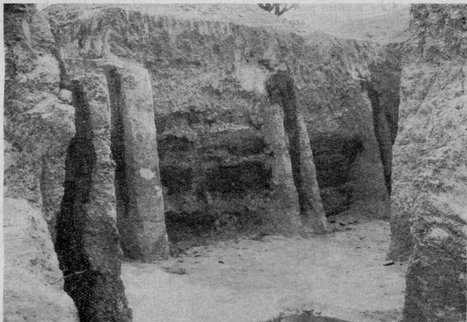
Sl. 10. Ohranjen del zunanjega obzidja. Hrastovi stebri in prečne grede

V vsakem primeru gre za izredno važen objekt, pri katerem ni moči izključiti niti povezavo s kulturnim območjem ob Libušinem jezercu. Priča