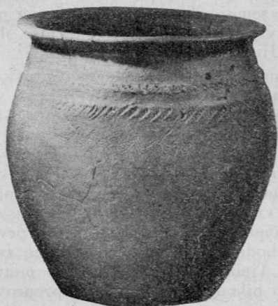
Sl. 3. Lonec mlajše plasti

Po tem razgibanem in bogatem obdobju prve kolonizacije Staré Kouřime je nastal mir za celo tisočletje. Šele v mlajši in pozni dobi broná v času med leti 1100—700 pr. Kr. je bila Stará Kouřim drugič naseljena. Gre zopet za srednji gradiščni prostor bliže naravnega vodnega izvira, imenovanega danes Libušino jezerce. Tega so si izbrali za središče novega naselja tako v prazgodovini kot v poznejši dobi. Na teh krajih so naleteli tako leta 1948 kot v letih 1954—1955 na vzporedne vrste kolov z orientacijo JV—SV, v katerih moremo upravičeno gledati sledove sten stebriščnih stavb, katerih datiranje postavlja obseg okroglih jamic v fazo lužiške kulture. Naselje, se zdi, omejuje proti severovzhodu ograja iz