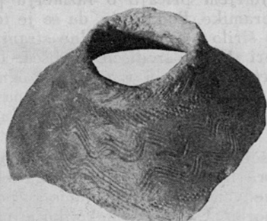
Sl. 1. Del ornamentirane steklenice

bil postavljen gradič z oblastjo okrožnega središča. V podgradju romanske Kouřimi je bilo v XIII. stol. ustanovljeno zgodovinsko mesto. Bilo je odslej okrožno središče in v cerkveni organizaciji središče arhidiakonata. 11