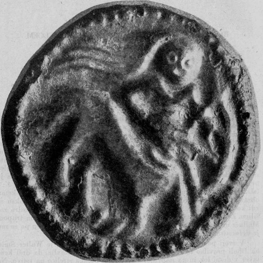
1. Fibula s kentavrom-lokostrelcem — Fibula con centauro-Sagittario; Bled-Zale; Narodni muzej Ljubljana, inv. S 590

čas. 3 Problem pa je bil tam komaj nakazan; fibula naj bi pripadala »karolinški državni umetnosti« (v smislu Steletove terminologije 4 ) in naj bi se oslanjala na iluminirane rokopise karolinške dobe. Fibula datira po avtorju iz 9. ali 10. stoletja, motiv pa se pojavlja tudi še v romaniki. Tam reproducirana fotografija prikazuje fibulo povečano, a ne izčrpa v zadostni