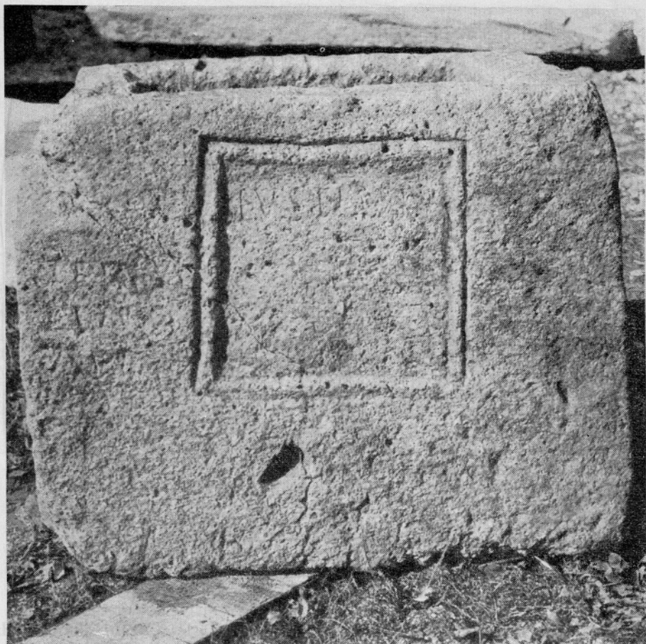
Sl. 2. Sprednja stran grobne skrinje za pepel iz peščenca z imeni pokojnikov EVSILLA in TERTVLIAN (inv. št. 422) Abb. 2. Die Vorderseite der Sandsteinaschenkiste (Inv. Nr. 422) mit den Eigennamen EVSILLA und TERTVLIAN

torej mnenje, da je ime v okviru JUSTA . 12 Vendar s to rešitvijo nismo bili zadovoljni. Tudi dotedanje fotografije nam niso ustrezale. Šele ko smo pri sončni svetlobi na prostem skrinjo obračali na vse strani, smo odkrili najprej ime EVSILLA . 13 Črke tega imena so različne velikosti in zelo tanko vrezane v hrapavo peščenčevo površino (sl. 1). V obrobljeni ploskvi s tem imenom je bil vklesan še napis v štirih vrstah. Od tega je ohranjenih le nekaj sledov zelo izlizanih in problematičnih črk v predzadnji in zadnji