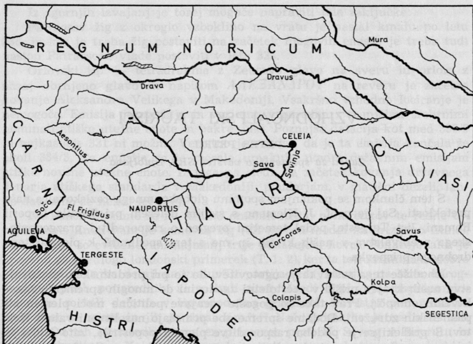
Karta 1. Razporeditev domorodnih plemen v začetku 1. stol. pred n. š.

Karte 1. Anordnung autochtoner Stämme am Anfang des ersten Jahrhunderts vor u. Z.