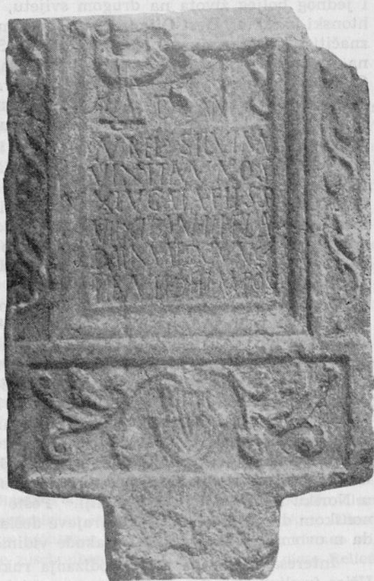
Sl. 4. Tubići. Pretstava daće sa oransom

trojstva prema tome odgovara sasvim keltskim pretstavama. Dijana sa istim atributima javlja se i na drugom reljefu, koji je radio isti majstor, uz Silvana koji je tu prikazan kao grčki Pan. Već ranije su opširno tretirani mnogostruki vidovi »interpretationis Romanae« Silvana, glavnog autohtonog božanstva Ilira. Međutim na ovim reljefima uz Dijanu u Opačićima izgleda da dolazi do izražaja jedna nova crta ovog autohtonog božanstva, i to sudeći po atributima Dijane, njegov htonski karakter.