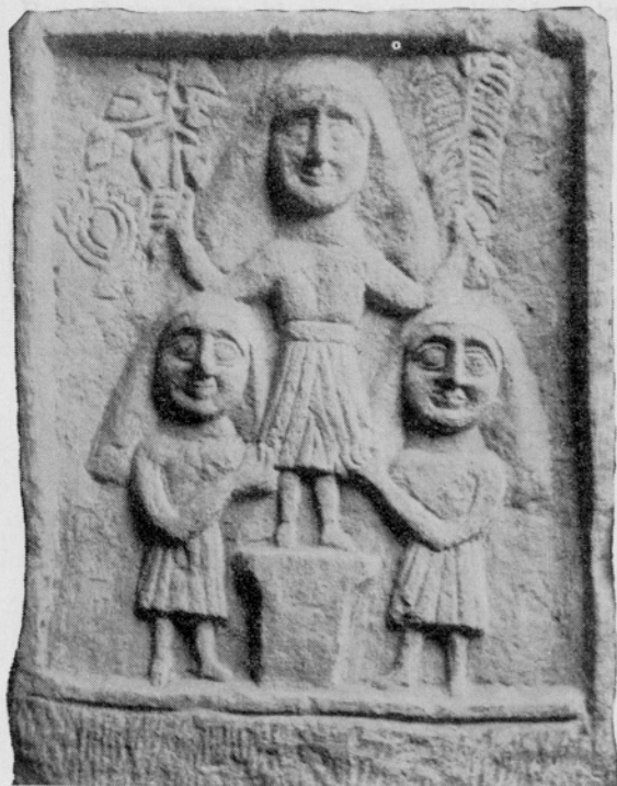
Sl. 3. Glamočko Polje. Ženska trojna božanstva Abb. 3. Glamočko Polje. Weibliche Trinitätsgottheit

laze tragovi elemenata keltskih kultova. I kod nas u Makedoniji nađen je reljef sa jednim takvim primitivnim božanstvom uzdignute desne ruke 17 u Leništu. Tumačenje ovog gesta u keltskom kultu nije dato, jer su keltska lokalna božanstva većinom nedovoljno definisana. Ali ovaj gest podizanja ruku svakako je igrao važnu ulogu u kultu Kelta što svjedoče i pretstave niza bogova na vazi iz Gundestrupa koji skoro svi imaju uzdignute ruke. 18