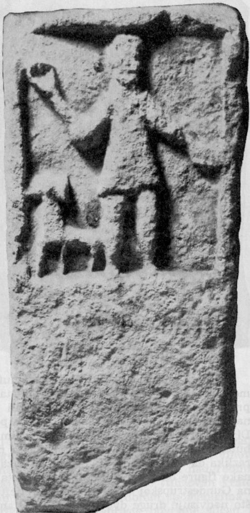
Sl. 2. Glamočko Polje. Pretstava oransa sa psom

mentarni. 13 (Sl. 1.) Figure su odjevene u kratku tuniku i u lijevoj ruci drže pateru. Samo na jednom reljefu je uz figuru i atribut — pas. 14 (Sl. 2.) Brojna pojava ovih reljefa i njihova primitivna obrada govori za to da su to pretstave nekog autohtonog božanstva, što su već i drugi utvrdili. 15 D. Sergejevski ih tumači božanstvima sličnim genijima, i precima zaštitnicima. Gest ovih primitivnih božanstva i najzad i atribut životinje uz njega više potsjeća na takve identične pretstave u Galiji na Iseri 16 drugdje gdje se na-