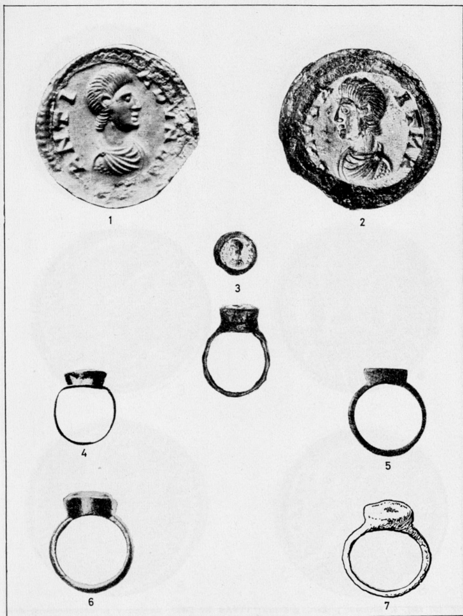
1. Odtis pečatnega prstana s portretom (Muzej Kamnik). Povečava 3,5 ×. — Abdruck des Siegelringes mit Porträt (Museum in Kamnik). Vergrößerung 3,5 ×. 2. Pečatni prstan s portretom (Muzej Kamnik). Povečava 3,5 ×. — Siegelring mit Porträt (Museum in Kamnik). Vergrößerung 3,5 ×. 3. Pečatni prstan s portretom (Muzej, Kamnik). Velikost 1/1 — Siegelring mit Porträt (Museum in Kamnik). Grösse 1/1. 4. Zlat prstan z ovalnim karneolom — sedeči Jupiter v levo, najdišče Mainz (po F. Henkel, Die römischen Fingerringe der Rheinlande, 38, T. 13: 236). — Goldener Fingerring mit ovalem Karneol — sitzender Juppiter, nach links gewendet, Fundort Mainz) nach F. Henkel, Die römischen Fingerringe der Rheinlande, 38,