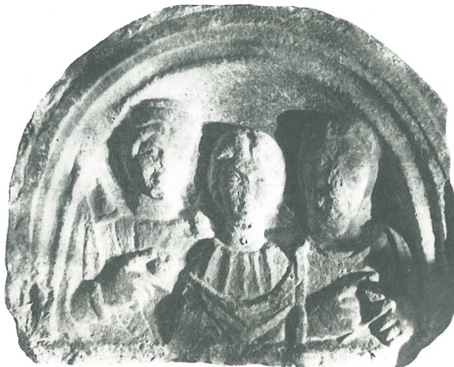
Sl. 1. Trebnje, zaključek rimskega nagrobnika, vzdian v farni cerkvi Abb. 1. Trebnje, der in die Mauer der Pfarrkirche eingebaute Abschlußteil eines römischen Grabsteines

lahko sestavljen zgolj iz vzporednih drobnih kanelur, ki uvito potekajo iz enega na drugi konec; pri tem posnema ta okras tordirano površino in ostaja poglaviten vzdolžni okras tudi pri drugih okovih. Drugi način ornamentiranja enodelnih oblik je, da so v sredini večkrat profilirani; pri tem zavzema osrednje mesto najbolj debelo rebro, navzven pa si sledijo vedno tanjše profilacije. Tudi pri dvodelnih oblikah je na pregibu ohranjena