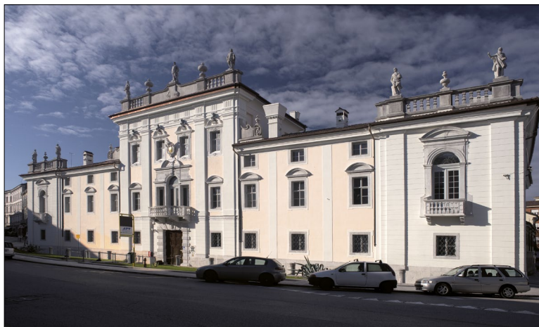
4. Palača Attems Petzenstein, Gorica