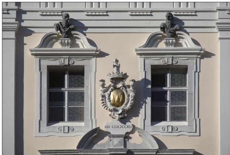
2. Grb na fasadi, 1745, palača Attems Petzenstein, Gorica