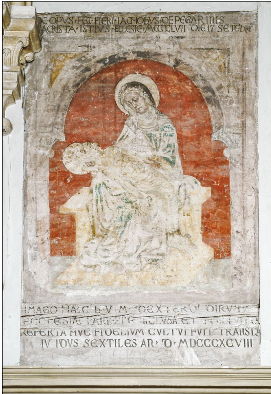
13. Pietà, 1457, San Martino, Piove di Sacco, freska nad vhodom v zakristiji

začetka. Serviti so se v Kopru naselili leta 1453, 31 zato je legitimno postaviti vprašanje, ali je kip morda prišel v Koper skupaj z njimi že ob ustanovitvi samostana. 32 Dokončnega odgovora na to nimamo, a ni nepomembno, da je bila prav Žalostna Mati Božja ( Vergine Addolorata ) pri servitih posebej čaščena vse od začetkov delovanja reda. 33 Če bi se domneva izkazala za pravilno, bi smeli sklepati, da je bil kip izdelan prav za potrebe novoustanovljenega samostana, kar bi potrdilo datacijo v zgodnja petdeseta leta 15. stoletja.