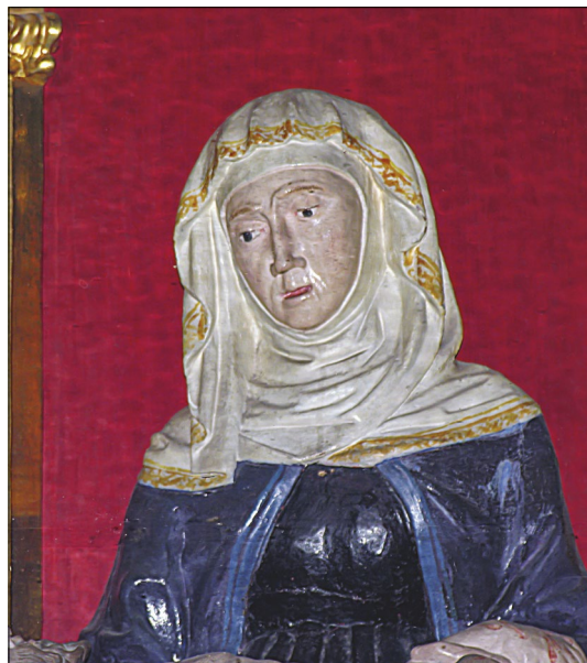
12. Pietà, stolna cerkev Marijinega vnebovzjetja, Koper, detajl