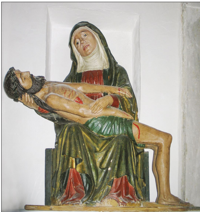
6. Pietà, stolna cerkev Marijinega vnebovzetja, Rab

ter gostujoči firenški kiparji, kot so Pietro di Niccolò Lamberti, Giovanni di Martino da Fiesole in Nanni di Bartolo, pozneje pa mojstri, zbrani okoli Pietra Lombarda in Antonia Rizza, ne prezrčali premočrtno tudi v leseno plastiko. Rezbarji v Benetkah sploh niso bili neposredno povezani s kiparji in kamnoseki, pripadali so cehu Arte de marangoni da case , 14 pogosto pa so sodelovali s slikarji. Med njihovimi najznačilnejšimi naročili so bili okvirji poliptihov (ter pozneje renesančnih oltarnih nastavkov) in prav poliptihi so pogosto vključevali tudi figuraliko, pa naj je šlo za osrednjo reliefno figuro, figuro v atiki, figure v stranskih poljih ali majhne kipce v nišah na samem okvirju ali v fialah, če ob tem ne omenjamo poliptihov, ki so po kompoziciji identični s slikanimi, a v celoti izvedeni v reliefu. V okoliščinah, ko se slikana in plastična podoba pojavljata druga ob drugi, pa seveda ni nenavadno, da se je lesena plastika tudi po slogovni plati približala slikarstvu, še posebej če upoštevamo, da je bila izdelava poliptiha ponavadi skupni projekt slikarja in rezbarja. Navsezadnje imamo tudi mojstre, kakršna sta bila npr. Andrea da Murano in Andrea Bellunello, ki so podpisovali tako slikarska kot rezbarska dela. 15