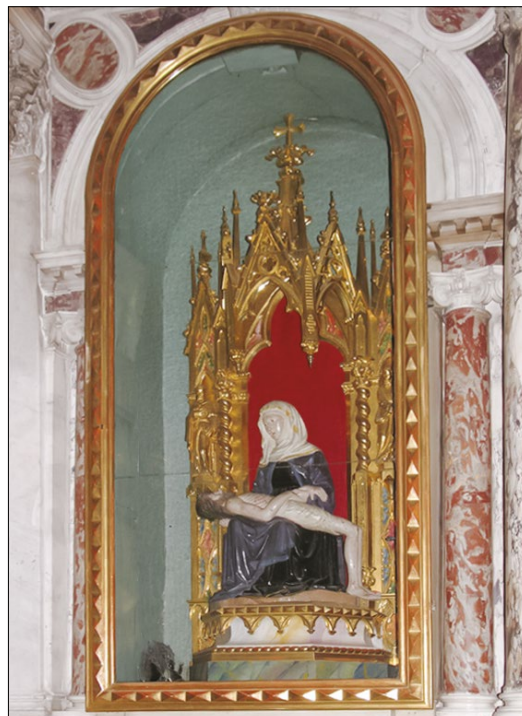
5. Pietà v edikuli mojstra Montinija, 1870–1871, stolna cerkev Marijinega vnebovzjetja, Koper

trono za Addolorato v gotskih oblikah in pripadajočo vitrino (sl. 5). 7 Takrat je torej oltar dobil današnjo podobo, a je podatek pomemben še zaradi nečesa drugega. Gre za enega zgodnejših dokumentiranih primerov naročila izdelka v neogotskem slogu v 19. stoletju na našem ozemlju, kjer so »gotške oblike« izrecno omenjene, hkrati pa se zdi celo ob takratnem splošnem navdušenju nad posnemanjem starih arhitekturnih slogov malo verjetno, da bi enega od baročnih oltarjev zavestno posodobili z neogotsko nišo, ki je tudi edini neogotski izdelek v koprski stolnici, saj cerkvena notranjščina v 19. stoletju sicer ni doživela gotizacije. Vzrok za to je nemara globlji in tiči v želji Koprčanov, da bi ohranili spomin na nekdanjo vlogo Marijine podobe v servitski cerkvi. Če ponovno pogledamo votivno risbo, opazimo, da je Pietà nameščena v arhitektonski okvir v slogu beneške pozne gotike ( gotico fiorito ), ki je bil nedvomno sočasen s kipom in ga lahko po zasnovi primerjamo z okvirji beneških poliptihov Antonia Vivarinija ter njegovih sodobnikov. Iz upodobitve lahko sklepamo, da je bil nad kipom baldahin, ki je trapezasto segal v prostor. Gre za arhitekturni motiv, ki ga največkrat srečamo pri večjih poliptihih, kjer je osrednje mesto namesto naslikane včasih