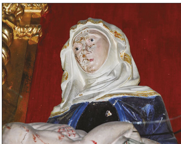
3. Pietà, stolna cerkev Marijinega vnebovzetja, Koper, detajl po iznakaženju leta 2016

njimi tudi čaščeno Pietà, prenesli v stolnico, 5 a to še ne pomeni njene dokončne postavitve, do katere je prišlo šele nekaj desetletij pozneje. Oltarni nastavek Alessandra Tremignona iz 1669–1670 je prišel na današnje mesto v stolnici v letih 1806–1807 in morda je bila že takrat vanj vstavljena Pietà, 6 danes pa je znan podatek, da so leta 1870 pri mojstru Montiniju iz Vidma (Udine) naročili