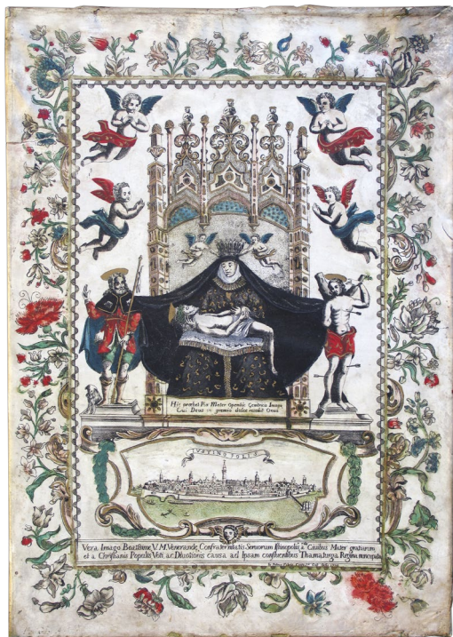
4. Votivna risba z upodobitvijo kipa Pietà v servitski cerkvi, 1738, Pokrajinski muzej, Koper