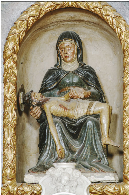
7. Pietà, stolna cerkev Marijinega vnebovzjetja, Montagnana