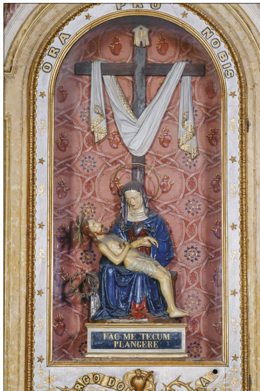
10. Pietà, San Martino, Piove di Sacco

Na to, da bi bil lahko prav kip mojstra Egidija vzor za ustvarjanje lokalnih delavnic, nam poleg že omenjene Pietà v Montagnani namiguje še nekaj kiparskih del na območju padovanske škofije. Najprej bi omenil Pietà v cerkvi San Clemente v samem mestnem jedru Padove (sl. 9). Gre za močno preslikan lesen kip, ki v strokovni literaturi doslej ni bil obravnavan, a je zabeležen v registru premične kulturne dediščine padovanske škofije in pogojno datiran v sredino 15. stoletja. 24 Marija ima glavo ovito v »nunsko« oglavnico, njena levica podpira Kristusovo levico, medtem ko njegova desnica počiva v naročju, skratka, prisotne so vse bistvene prvine kompozicije koprskega in rabskega kipa. Po drugi strani pa ne smemo spregledati tistega, kar povezuje padovanski kip z Egidijevo Pietà, in tu gre predvsem za draperijo. Čeprav ni več tipičnih motivov mehkega sloga (zaman bomo iskali skledaste gube med kolena in slapove gub ob straneh), je gubanje vendarle mehko in tekoče, detajl, ki bi bil lahko povzet neposredno po Egidijevem kipu, pa je del Kristusovega perizomnega ogrinjala, ki visi čez Marijino levo koleno: gre za motiv, ki je posebnost omenjenega kipa, saj ga na upodobitvah Pietà mednarodne gotike praviloma ne srečujemo.