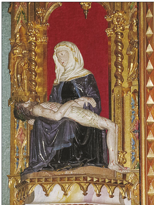
1. Pietà, stolna cerkev Marijinega vnebovzetja, Koper