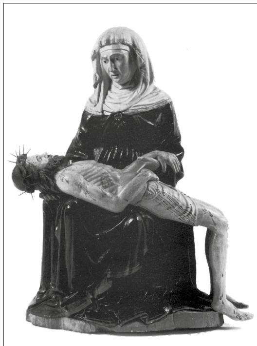
2. Pietà, stolna cerkev Marijinega vnebovzetja, Koper