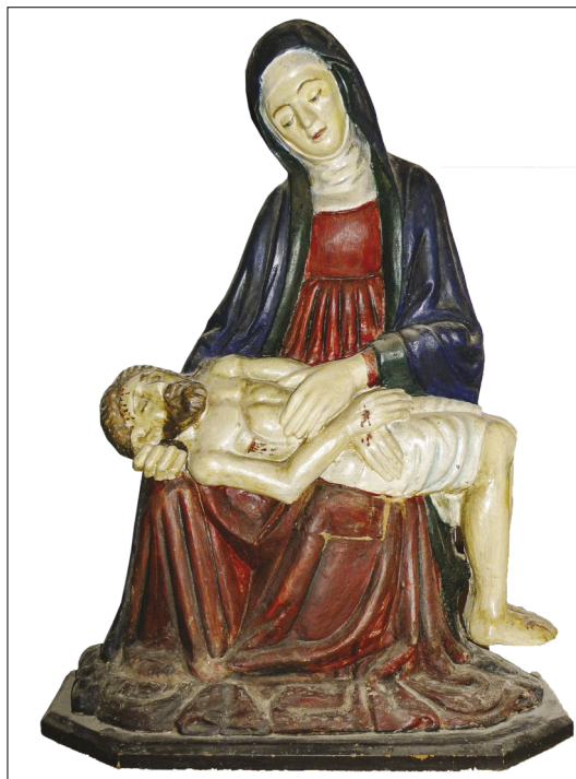
14. Pietà, ž. c. sv. Jurija, Piran

14), nekoč pa je pripadal poznogotskemu poliptihu, kakršnih se je v Istri nekaj ohranilo, bodisi v celoti bodisi fragmentarno. 38 Kot večina podobnih del je podoba precej na debelo premazana z domnevno več sloji barve, tako da prav natančna analiza detajlov ni mogoča, kljub temu pa ni dvoma, da gre za delo 15. stoletja. Kompozicijsko v celoti izhaja iz tipa »lepih Pietà« in ohranja »motiv treh rok«, hkrati pa nosi Marija italijansko nunsko oglavnico. Čeprav je glede na današnje stanje kvaliteto težko objektivno oceniti, se zdi relief precej bolj poljudno delo kot koprška Pietà, po drugi strani pa ni povsem izključeno, da bi bil dal njegovemu avtorju prav koprski kip določeno spodbudo. 39 Na to namiguje Marijin obraz, prav tako pa tudi oblikovanje draperije, še posebej močno zmečkane gube v spodnjem delu. Več kot domnevati, da gre za delo domačega, istrskega mojstra, za zdaj ne moremo, pa tudi datacijo lahko le okvirno postavimo v drugo polovico 15. stoletja, a če bi se izkazalo, da je bila vzor zanj prav koprška Pietà, bi bil to še en posreden dokaz o njeni prisotnosti v Istri neposredno po nastanku.