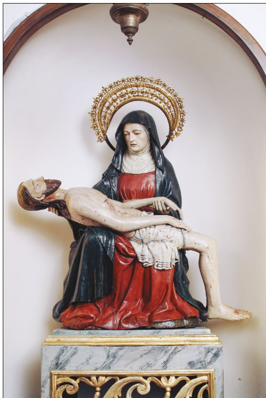
9. Pietà, San Clemente, Padova