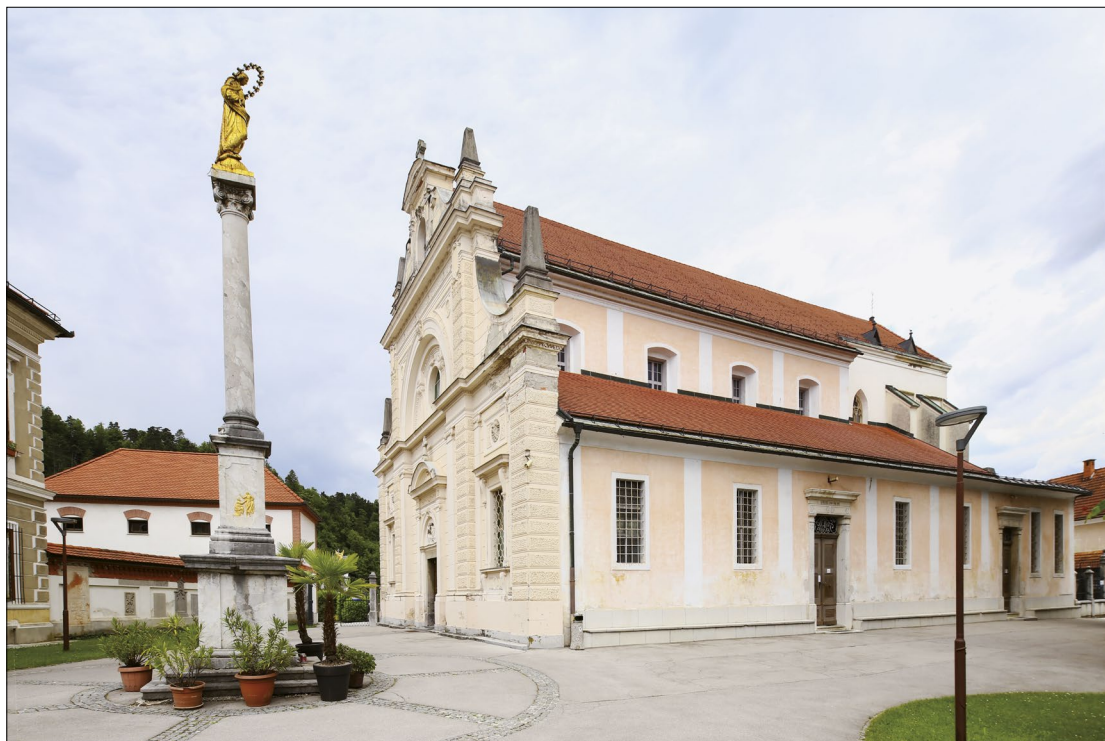
1. Župnijska cerkev sv. Mihaela v Mengšu, sedež duhovniške bratovščine sv. Mihaela

njegovi approbatio , 13. septembra 1668, sta opat in konvent župnijo Mengeš prodala cisterci v Stični. 7 Bratovščinsko vodstvo je zato za potrditev zaprosilo stiškega opata Maksimilijana Mottocha in ta je na veliko noč 1669 prošnji ugodil. 8 Bratovščina je želela biti predvsem branik duhovništva pred »hudičem« pa tudi pred »nehvaležnim svetom«, ki je na duhovnike vse prepogosto pozabljal, poleg tega naj bi si prizadevala za večjo karitativno gorečnost. 9 Vsak v bratovščino vključeni duhovnik naj bi po smrti sočlana v blagor njegove duše opravil tri maše, vseh pokojnih članov pa naj bi se spomnil tudi med svojim vsakodnevnim maševanjem. 10