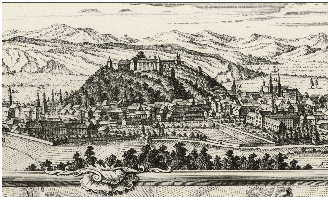
3. Abraham Kaltschmidt: veduta Ljubljane na zemljevidu Kranjske v: Ivan Dizma Florijančič de Grienfeld, Deželopisna karta vojvodine Kranjske, Ljubljana 1744 (faksimile), detajl