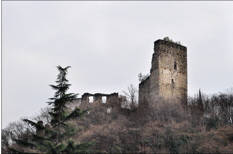
1. Grad Brandis, Lana, zunanjščina

duhovnikov in redovnic in na najrazličnejše načine, tudi finančno, podpirali delovanje Cerkve. 15 Nekateri predstavniki rodbine pa so imeli tudi omembe vredno vojaško kariero. 16