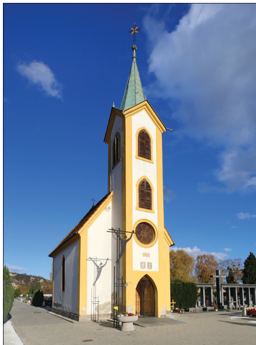
11. Grobna kapela Brandisov na pobreškem pokopališču, Maribor, 1891, zunanjščina