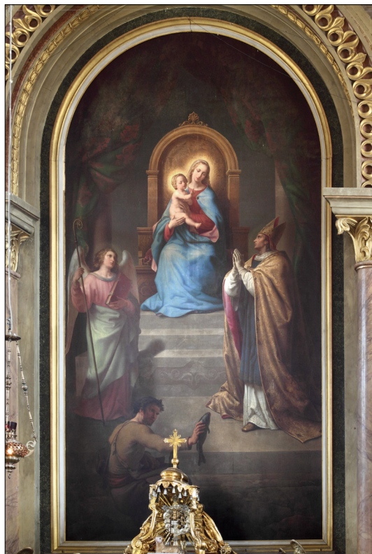
16. Leopold Kupelwieser: Čudež sv. Urha, ž. c. sv. Urha, Smlednik, 1847