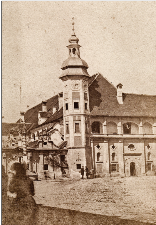
2. Ferdinand Rainer: Mestni grad Maribor, zunanjščina pred prezidavo 1871