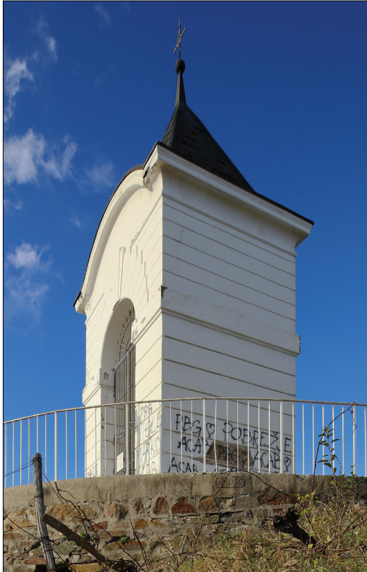
9. Kapela Brezmadežne na Piramidi, Maribor, 1821, predelana 1909, zunanjščina