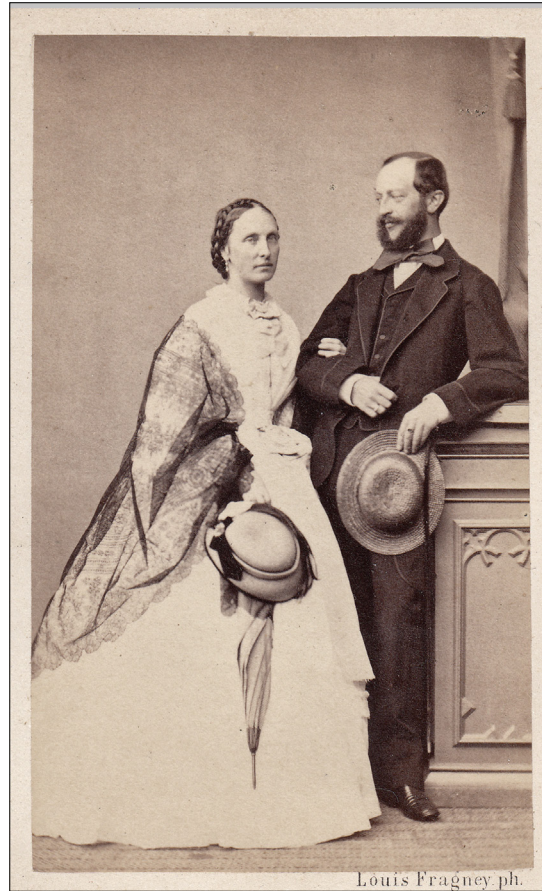
19. Anton Adrijan grof Brandis (1832–1907) s soprogo Terezijo Sofijo, baronico Gudenus

zaradi oddaljenosti ni bilo v interesu imeti posestev na Štajerskem, zato je leta 1880 prodal Slivnico in ostala štajerska posestva. 120 Ker s soprogo Terezijo Sofijo, roj. baronico Gudenus (1836–1919), nista imela otrok, je ta stranska veja Brandisov z njegovo smrtjo 14. maja 1907 izumrla. 121