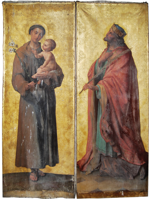
15. Leopold Kupelwieser: Sv. Anton Padovanski in sv. Erik, iz kapele dvorca Slivnica, 1862