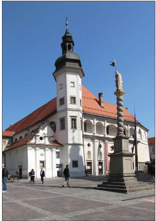
3. Mestni grad Maribor, zunanjščina leta 2017