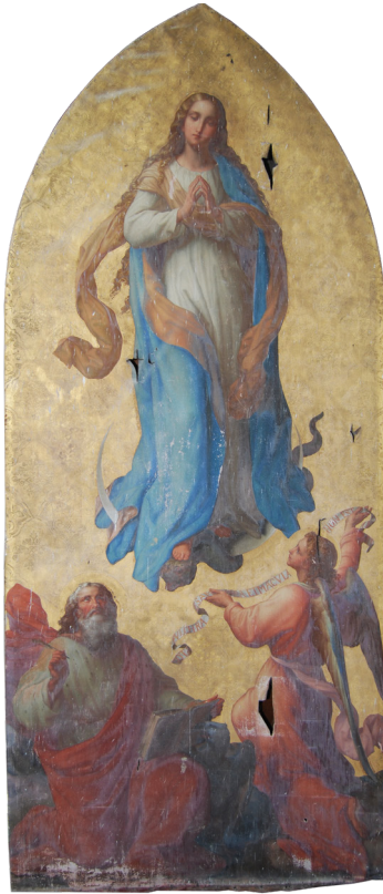
14. Leopold Kupelwieser: Brezmadežna, iz kapele dvorca Slivnica, 1862