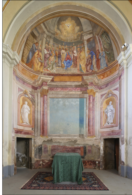
7. Dvorec Betnava, kapela sv. Križa, ok. 1772–1781, notranjščina