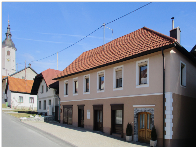
5. Lokacija Faenzi-Straspurgerjeve hiše v Višnji Gori