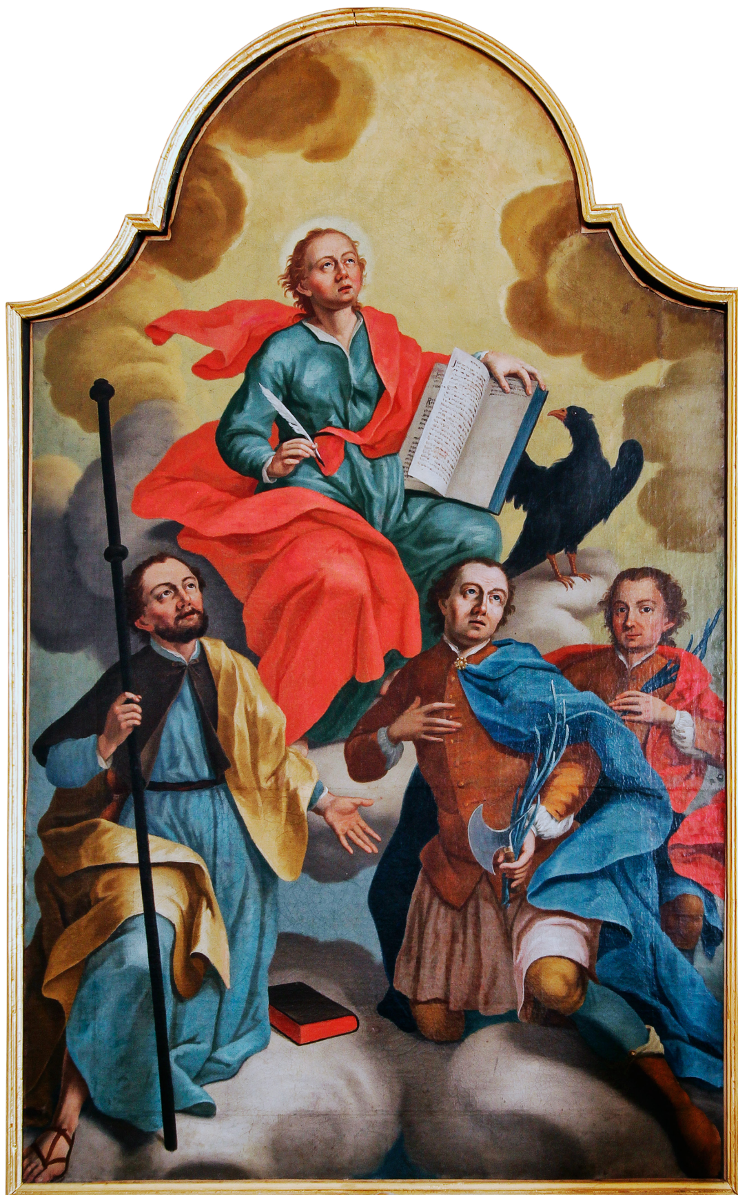
8. Franc Anton Nirenberger: Sv. Janez Evangelist s tremi svetniki, 1760–1770, p. c. sv. Ane, Višnja Gora