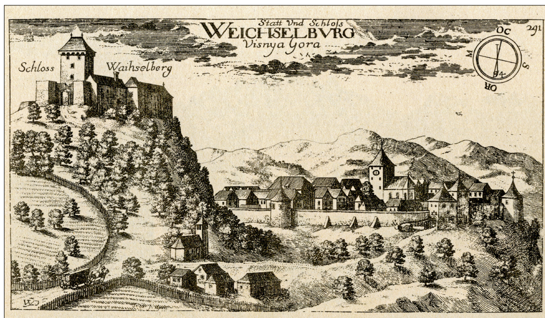
1. Višnja Gora v: Johann Weichart Valvasor, Topographia Ducatus Carnioliae Moderna , Wagensperg in Crain 1679

specializiranosti obrtnih strok se je Višnja Gora z 21 različnimi obrtmi znašla med sedmimi dolenjskimi mesti takoj za Novim mestom s 34 panogami, tretje je bilo Krško s 15 obrtmi, ostala štiri mesta pa so jih premogla znatno manj, med 7 in 10. Primerljivi podatki o obrtnem davku, ki jih najdemo v terezijanskem katastru, nedvoumno pričajo, da je bila Višnja Gora po poklicni strukturi prebivalstva daleč najbolj obrtniško mesto Dolenjske. Mestece z vsega 62 hišami je namreč premoglo 63 obrtnikov, torej celo nekaj več kot enega na hišo, medtem ko je že v Novem mestu prišel obrtnik komaj na poldrugo hišo. Manjšo težo so imeli višnjegorski poklicni trgovci, saj so po terezijanskem katastru zastopali trgovski stan le trije kramarji. Po drugi strani pa so bili Višnjani tudi močni agrarni gospodarji z veliko lastne obdelovalne zemlje in razvito živinorejo, zlasti konjerejo, namenjeno pretežno tranzitnim dejavnostim. Višnja Gora kot celota je med mesti spodnjega dela dežele zapovrh posejala največ žita na hišo. Na Slovenskem bi le težko našli mesto, kjer sta se agrarna in neagrarna komponenta tako dobro dopolnjevali.