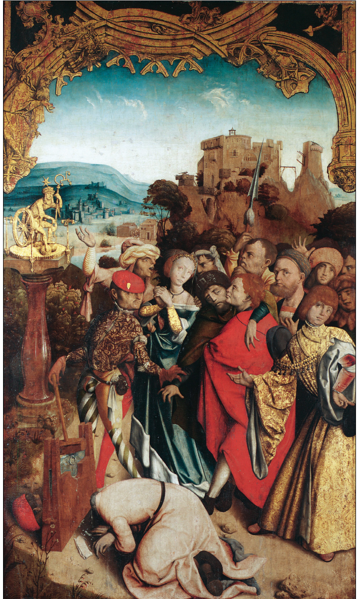
2. Mučeništvo sv. Kancija, Kancijana, Kancijanile in Prota, Kranjski oltar, ok. 1500, Österreichische Galerie Belvedere, Dunaj

razpravo o tablah Kranjskega oltarja; datiral jih je v drugo desetletje 16. stoletja in identificiral prizore na notranji strani oltarnih kril. 7 V odzivu na Steletov članek je Izidor Cankar oltar datiral v čas okoli leta 1500. Opozoril je na očitne nizozemske vplive (npr. krajina, obrazni tip Kristusa v prizoru Vstajenje) in njegov nastanek umestil v delavnico Michaela Wolgemuta v Nürnbergu. 8