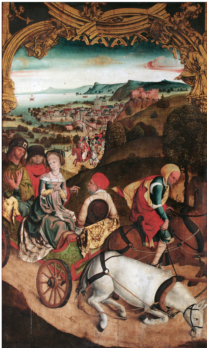
1. Beg sv. Kancija, Kancijana, Kancijanile in Prota, Kranjski oltar, ok. 1500, Österreichische Galerie Belvedere, Dunaj

Mojster Kranjskega oltarja. Če pristanemo na danes uveljavljene atribucije Tomislava Vignjevića, je omenjenemu mojstru mogoče pripisati triptih z Objokovanjem Kristusa – t. i. kölnski triptih (nahajališče neznano), freske v cerkvi sv. Primoža in Felicijana nad Kamnikom, freske v kapeli Malega gradu v Kamniku in freske na Rdečem znamenju pri Crngrobu. 5