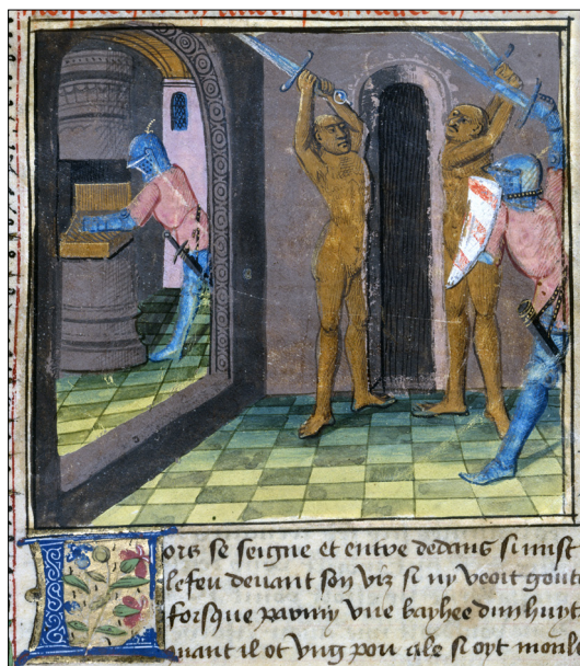
10. Lancelot v boju s kovinskima vitezoma v: Gautier Map, Lancelot du Lac , Bibliothèque Nationale, Pariz

je znana z imenom Valentine and Orson ) literarna junaka v graščini najdeta umetno bronasto glavo, ki jima razkrije, da sta brata. 40 Avtomati so postali pogost motiv srednjeveškega bajeslovja in jih v tem kontekstu navadno ni mogoče ločiti od prevladujočih magičnih predstav. Znamenite in splošno znane so bile na primer pripovedi o Salvatio Romae , gibljivih skulpturah, ki naj bi Rimljane opozarjale na nemire v daljnih provincah obsežnega cesarstva in katerih snovalec naj bi bil sam pesnik Vergil. Ta zgodba se je ohranila v več različicah, uporabili so jo tudi v vodnikih za romarje Mirabilia Urbis , ki so se prvič pojavili v 12. stoletju. 41 V delu De naturis rerum angleškega opata Aleksandra Neckama (ok. 1190) je ohranjen eden prvih zapisov te zgodbe, ki jo v Legendi Aurei omenja tudi Jacobus da Voragine. Sprva je bila legenda povezana s Kapitolom in se je verjetno posredno navezovala na zgodbo o kapitolskih goseh Jupitrovega templja, ki so Rimljane posvarile pred vdorom Galcev v mesto. 42 Neckam je opisal palačo, ki naj bi jo Vergil zgradil v Rimu in vanjo namestil kipe, ki so predstavljali province rimskega cesarstva z zvonci v rokah, s katerimi so pozvonili v primeru nemirov v neki regiji cesarstva. Istočasno je bronasti vitez na strehi palače naperil kopje v smeri uporne province.