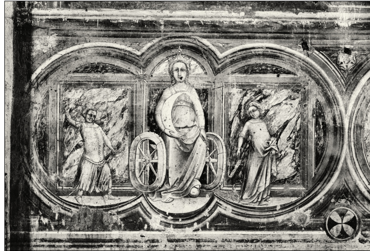
4. Guariento di Arpo: Luna, cerkev sv. Filipa in Jakoba, Padova, ok. 1360

usodo svetnikov, opisuje pa tudi dogodek, ko so svetniki zavrnilo ukaz, naj darujejo Jupitru, kar je privedlo do njihove usmrtnosti. 21