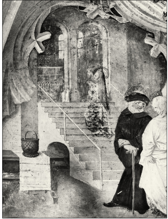
6. Marijina pot v tempelj, 1504, p. c. sv. Primoža in Felicijana nad Kamnikom