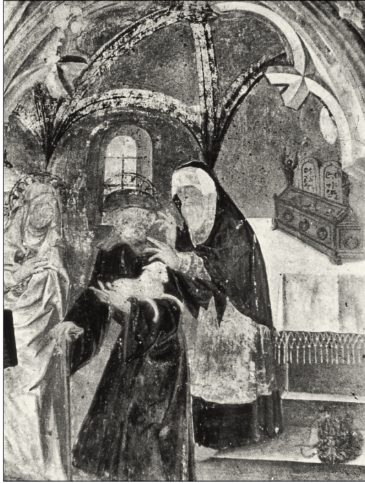
5. Zavrnitev Joahimove daritve, 1504, p. c. sv. Primoža in Felicijana nad Kamnikom