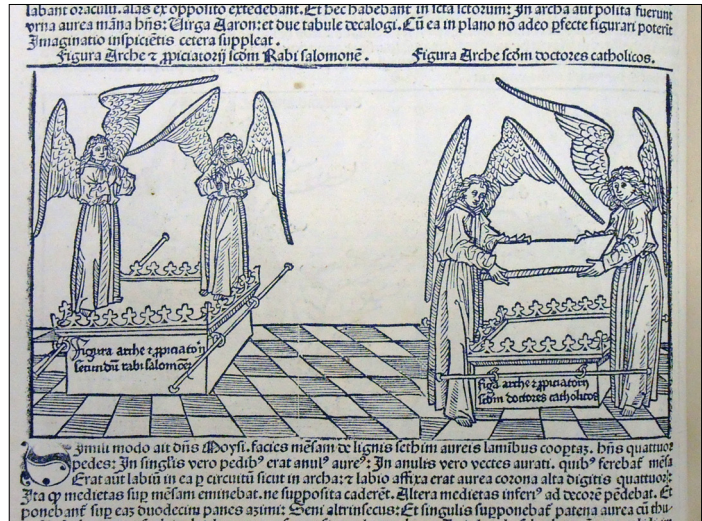
7.–8. Hartmann Schedl, Liber Chronicarum , Nürnberg 1493, Narodna in univerzitetna knjižnica, Ljubljana

Navdušenje Mojstra Kranjskega oltarja nad ritualnim, posvečenim in skrivnostnim se ne kaže le v nenavadni upodobitvi figure malika, marveč tudi v svetopisemskih prizorih pri Sv. Primožu, v katerih se pojavlja Salomonov tempelj, npr. Zavrnitev Joahimove daritve in Marijina pot v tempelj (sl. 5–6). Jeruzalemski hram je zaznamoval s podobo skrinje zaveze s serafinoma na pokrovu in polkrožno zaključenima tablama postave v prizoru Zavrnitev Joahimove daritve ter s podobo skrinje zaveze, katere zadnji del prepoznamo za vrati templja na vrhu stopnišča, po katerem se vzpenja Marija. Upodobitev skrinje zaveze, ki je v srednjeveškem in renesančnem slikarstvu razmeroma redka,