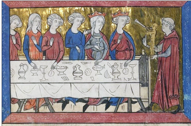
9. Idol zabava dvorjane v: Girard d'Amiens, Li Contes de Meliacin , Bibliothèque Nationale, Pariz

so bržkone spodbudile ilustracije poglavja Tercia etas mundi v Svetovni kroniki (sl. 7–8). 34 Da ta tudi na Kranjskem ni bila neznana, potrjujeta izvoda v Narodni in univerzitetni knjižnici v Ljubljani. 35