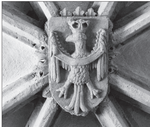
11. Schlussstein mit dem Landeswappen von Krain am Schiffsgewölbe, 1479, Filialkirche St. Primus und Felicianus oberhalb Kamnik