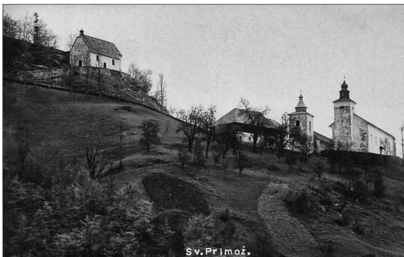
1. Filialkirche St. Primus und Felicianus oberhalb Kamnik, Ansichtskarte aus dem Jahre 1934