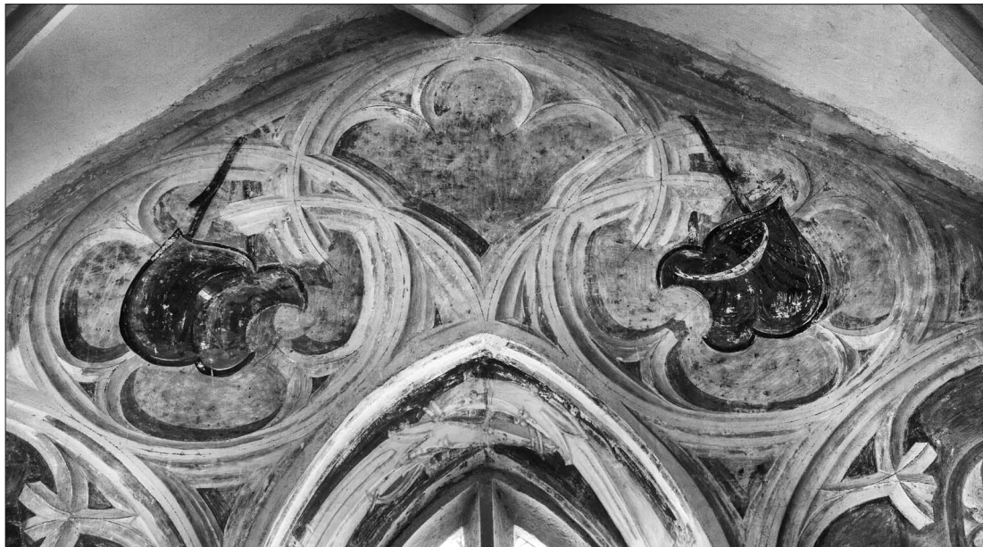
15. Kaiserliches Wappen und Landeswappen von Krain im Maßwerk, Südwand, um 1507, Filialkirche St. Primus und Felicianus oberhalb Kamnik