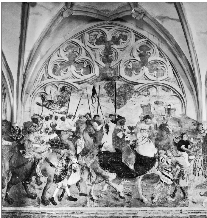
6. Zug der Heiligen Drei Könige, Nordwand, 1504, Filiationkirche St. Primus und Felicianus oberhalb Kamnik

vertraut war, ebenso mit der Malerei Wiens und Kölns. Immer wieder werden in der Literatur auch die Einflüsse des graphischen Werks Albrecht Dürers betont. 7 Dürers Anbetung der Heiligen Drei Könige , die 1511 im Zyklus Marienleben erschien, entstand um 1503. 8 Die Abhängigkeit davon ist in der Komposition und in den architektonischen Details der Anbetung tatsächlich bereits im Jahre 1504 deutlich zu erkennen, was auf jeden Fall bemerkenswert ist. Die Einflüsse von Dürers Graphiken sind im Bühnenhaften Schauplatz mit dem Turm, dem fast niedergerissenen Pfeiler und der zerstörten Wand, weiterhin in der Haltung des Kindes und der Maria, sowie in den gemalten Pferden zu beobachten, die sich durch die betonte Körperlichkeit und anatomische Präzision auszeichnen. Dürers Einfluss ist ebenfalls in der Darstellung des Raumes in der Verkündigungszene erkennbar, seinen ersten Graphiken aus dem Zyklus Marienleben ist allerdings auch die Architektur in der Szene Marias Tempelgang verwandt. Einige Verbindungen sind ersichtlich aus der Szene Verlobung Mariens . Dabei handelt es sich nicht um eine genaue Kopie der Graphiken von Dürer, sondern um frei übernommene Motive, die der Maler adaptierte. 9 In diesem Zusammenhang ragt eine weibliche