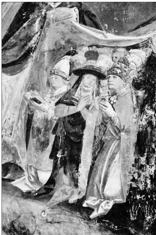
19. Gruppe mit einem Papst und einem Kardinal an der rechten Seite Mariens mit dem Schutzmantel, Nordwand, 1504, Ferialkirche St. Primus und Felicianus oberhalb Kamnik

anderen Seite neben Kaiser Friedrich III. und seinem Sohn Maximilian auch die acht Jahre zuvor verstorbene Frau Friedrichs, Eleonore von Portugal, abgebildet. 54 Etwas Ähnliches können wir für den erwähnten Altar aus der Gründungszeit der Kölner Rosenkranzbruderschaft feststellen, wo ebenfalls die bereits verstorbene Eleonore von Portugal zu sehen war. Und auch auf dem Altar aus der Zeit um 1500 sind neben dem gekrönten Maximilian der damals bereits verstorbene Friedrich III. und Papst Sixtus IV. abgebildet, die sich beide für die Blüte der Kölner Rosenkranzbruderschaft am verdientesten gemacht hatten. Auf dem Fresko in St. Primus tritt auf der linken Seite unter Marias Mantel nur noch eine Frau besonders hervor, dargestellt zwischen Maximilian und (vermutlich) Friedrich. Aufgrund des Vergleichs mit den angeführten Werken und vor allem mit dem Kölner Altar als dem Prototyp künstlerischer Werke, die von den Rosenkranzbruderschaften in Auftrag gegeben wurden, drängt sich natürlich der Gedanke auf, dass es sich um eine Darstellung Eleonores von Portugal handelt. Dieser These widerspricht einzig und allein ihre Kopfbedeckung, die jener Maximilians sehr ähnlich ist, was zu der Überlegung führt, dass die Dargestellte mögli-