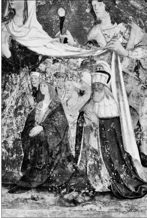
17. Gruppe mit Maximilian I. an der linken Seite Mariens, Nordwand, 1504, Filiationkirche St. Primus und Felicianus oberhalb Kamnik