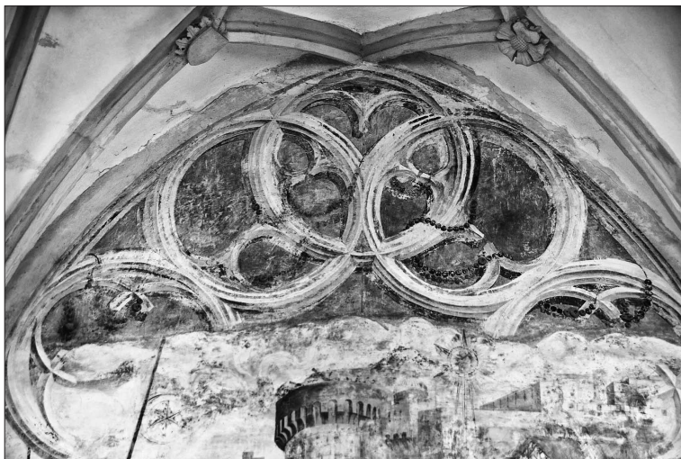
8. Rosenkranz im Maßwerk, Nordwand, 1504, Ferialkirche St. Primus und Felicianus oberhalb Kamnik