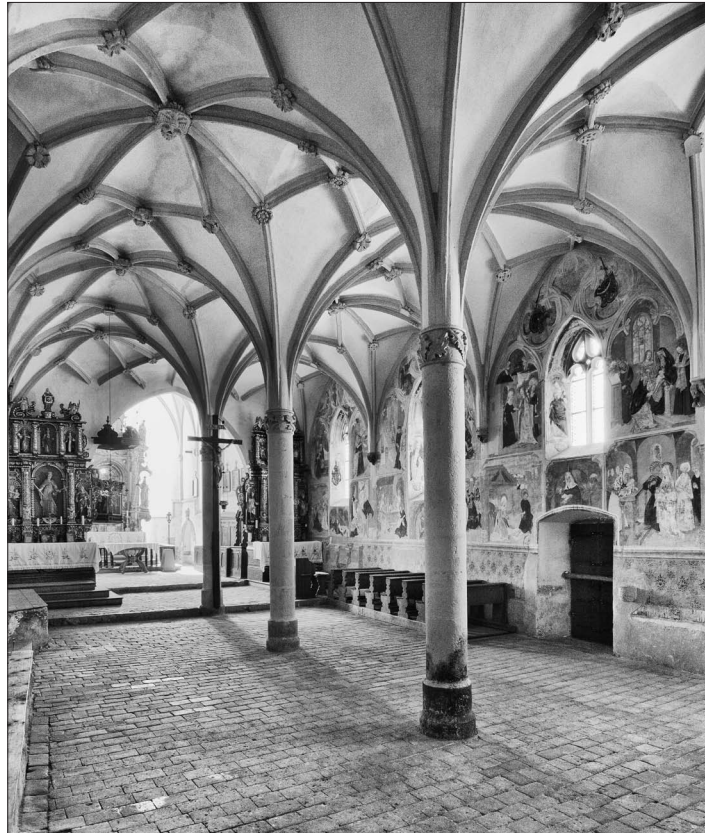
4. Malerei an der Südwand, um 1507, Filialkirche St. Primus und Felicianus oberhalb Kamnik

wird in das Jahr 1507 oder noch etwas später gelegt. 2 Im Jahr 1507 entstand das Presbyterium, was uns die Jahreszahl verrät, die auf dem Schriftband, welches ein auf einer der Konsolen stehender Engel hält, steht. 3