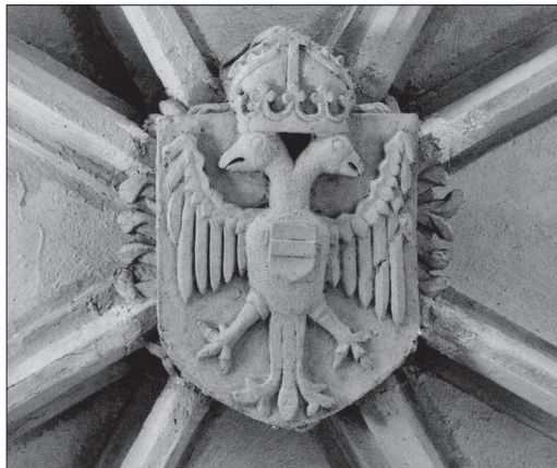
10. Schlussstein mit dem Kaiserwappen am Schiffsgewölbe, 1479, Filialkirche St. Primus und Felicianus oberhalb Kamnik