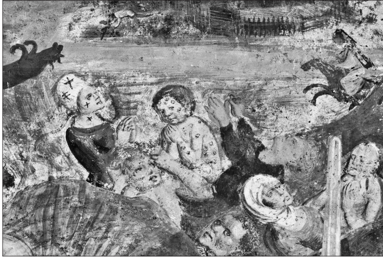
7. Kreuzregen, Nordwand, 1504, Filiakirche St. Primus und Felicianus oberhalb Kamnik

Person hinter Christus hervor, die auf dem Gesicht und der Kleidung winzige Kreuze hat (Abb. 7). Darin erkennen wir die Kenntnis des Geschehens wieder, das Albrecht Dürer 1503 oder 1504 als daz grost wunderwerck beschrieb und illustrierte. Aus seiner Notiz erfahren wir, dass im Jahre 1503, also ein Jahr vor der Fertigstellung der Fresken an der Nordwand der Kirche St. Primus und Felicianus, /.../ awff vil lewt krewcz gefallen sind, sunderlich mer awff dÿ kind den ander lewt. Vnder den allen hab jch eins gesehen /.../ vnd es was gefallen awffs Eÿrers magt, der jns Pirkamers hÿnderhaws sasz, jns hemt jnn leinnen duch /.../ 10 Vom Ereignis der Kreuzfälle in Nürnberg im Jahre 1503 berichtet ebenfalls Heinrich Deichsler (1430–1506/07) in seiner Chronik. 11 Auch beim Amtsantritt Maximilians I. im Jahre 1493 sollen am Himmel Kometen und andere Zeichen erschienen sein, in Augsburg sollen Steine in Form von Herzen vom Himmel gefallen sein, was wir im Werk Historia Friderici et Maximiliani von 1514–1516 lesen. 12 Die über den Sockel reichende Draperie der hl. Barbara an der südlichen Wand mit den Malereien aus dem Jahre 1507 oder etwas später, deutet mit ihren knotigen Falten ebenso auf die Kenntnis von Dürers Graphik. Die Gestaltung des Faltenwurfs auf diese Weise hatte sich unter dem Einfluss der graphischen Blätter des Meisters und seiner Schüler nach 1505/06 verbreitet. 13