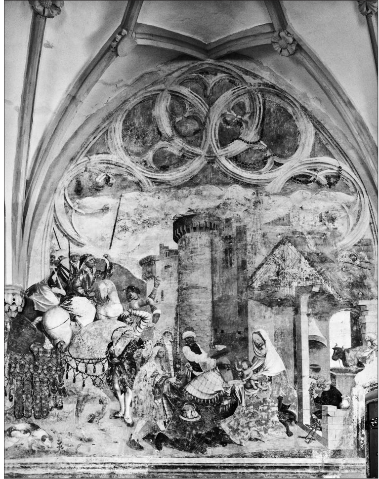
20. Rosenkranz über der Anbetung der Heiligen Drei Könige, Nordwand, 1504, Filialkirche St. Primus und Felicianus oberhalb Kamnik