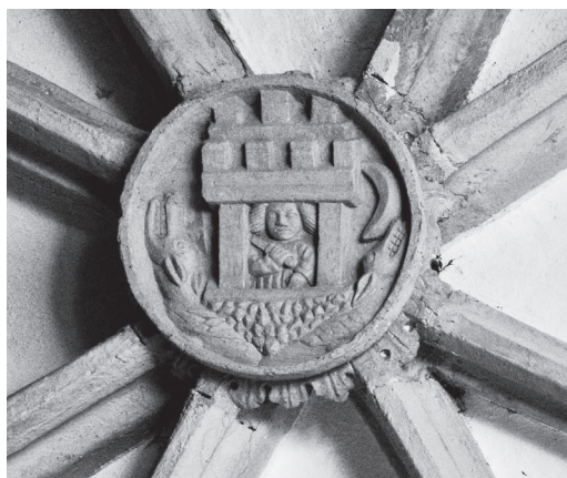
12. Schlussstein mit dem Stadtwappen von Kamnik am Schiffsgewölbe, 1479, Filialkirche St. Primus und Felicianus oberhalb Kamnik