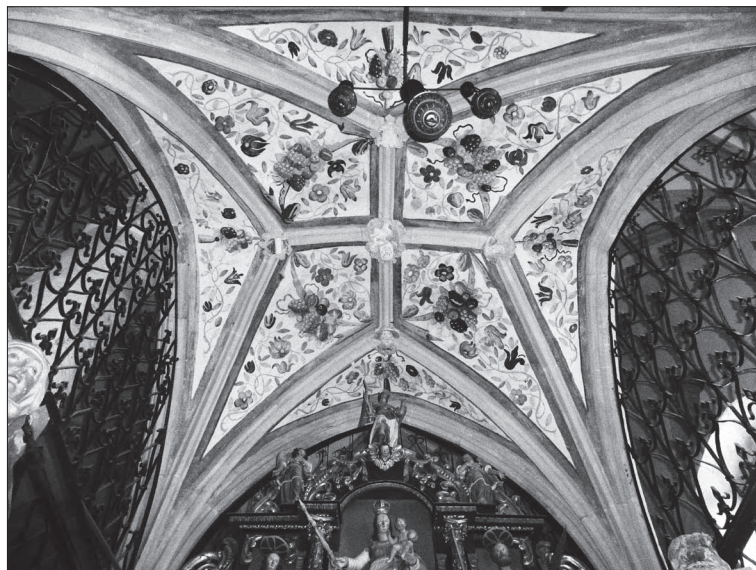
14. Gewölbe mit dem österreichischen Wappen am Baldachinaltar, Anfang des 16. Jahrhunderts, Fialkirche St. Primus und Felicianus oberhalb Kamnik