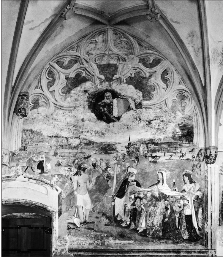
9. Pestbild mit der Schutzmantelmadonna, Nordwand, 1504, Filialkirche St. Primus und Felicianus oberhalb Kammik

muss, gewidmet hatte. Aus Quellen erfahren wir, dass die Bruderschaft, die zum ersten Mal im Jahre 1390 erwähnt ist, am 24. August 1475, das ist im selben Jahr, in dem die berühmte Kölner Bruderschaft gegründet wurde, schon als grossen bruderschaft vnser lieben frawn bezeichnet wird. 30 Ich bin der Meinung, dass gerade die Abbildung des Rosenkranzes ein Beweis dafür ist, dass sich die Bruderschaft am Ende des Jahrhunderts insbesondere der Rosenkranzfrömmigkeit widmete. Dafür würde auch die hervorgehobene Darstellung der Schutzmantelmadonna sprechen, denn gerade mit diesem ikonographischen Motiv wurden gegen Ende des 15. Jahrhunderts die Rosenkranzbruderschaften eng verbunden (Abb. 9). 31