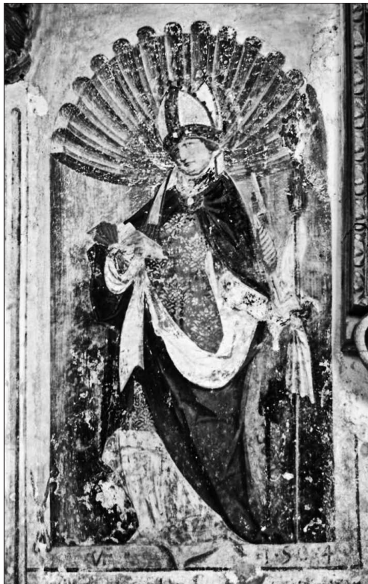
5. Hl. Erasmus in einer Renaissance-nische mit dem Monogram VF und mit der Jahreszahl 1504, Filiationkirche St. Primus und Felicianus oberhalb Kamnik

Kanzian in Kranj stammt und nach welchem der Meister den Notnamen bekam, befindet sich seit 1886 in Wien. Da in Quellen vom Anfang des 16. Jahrhunderts dreimal (1507, 1516, um 1517) ein Veit, Maler in Kamnik, erwähnt wird, 5 wurde infolgedessen die Vermutung aufgestellt, dass dieser Künstler mit dem Meister des Krainburger Altars identisch sei. Dem würde auch das Monogramm VF entsprechen (V für Veit und der Nachname beginnend mit F), 6 das wir neben der Jahreszahl 1504 auf dem Rahmen der Renaissance-nische mit dem hl. Erasmus finden (Abb. 5).