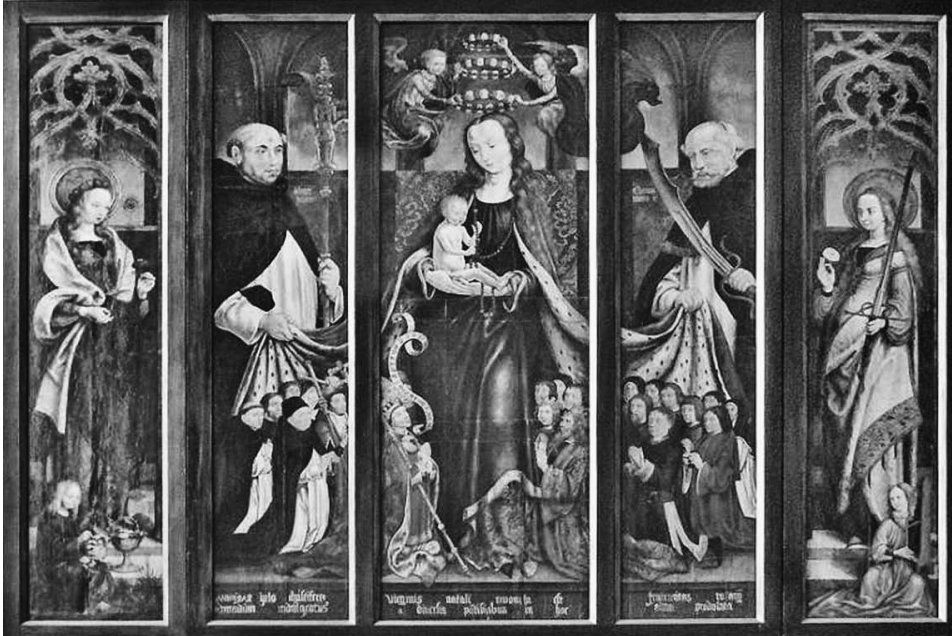
16. Meister von Sankt Severin: Schutzmantel-Triptychon über dem Altar der Rosenkranzbruderschaft, um 1500, Dominikanerkirche St. Andreas, Köln