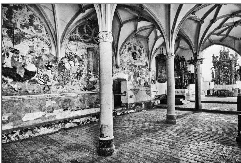
3. Malerei an der Nordwand, 1504, Filialkirche St. Primus und Felicianus oberhalb Kamnik