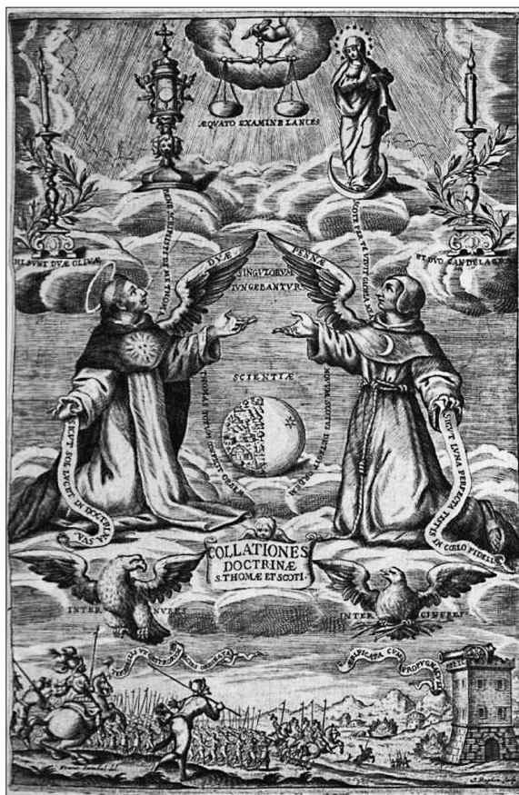
10. Jacopo Ruphon: Titelkupfer von Collationes doctrinae S. Thomae et Scoti cum differentiis inter utrumque , 1671, Bayerische Staatsbibliothek, München

Sowohl das Motiv der himmlischen Disputation als auch jenes des Triumphes von Kirche und Kaiser über die heidnischen Osmanen waren jedoch keine Erfindung von Onghers, sondern vermutlich von druckgraphischen Vorlagen inspiriert. Die fiktive Disputation der beiden mittelalterlichen