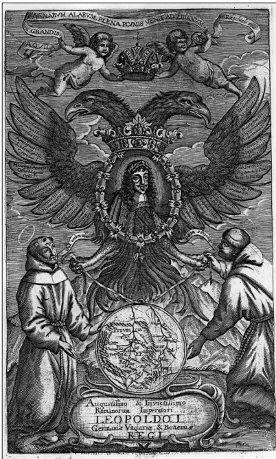
7. Die böhmische Provinz der Franziskaner unter dem Schutz des kaiserlichen Adlers und Leopolds I., Kupferstich, um 1670/80, Sammlung Polleroß, Wien

gegeben. 1684–1688, 1693–1696 und ab 1699 übte Lazari das Amt des Ordensoberen seiner Provinz aus. Dazu bekleidete er die Funktion eines Generaldefinitors in Rom (das dritthöchste Amt des Ordens) sowie eines Generalvisitators für Kroatien, Ungarn und Böhmen. Seine theologischen Interessen zeigen sich in den Publikationen einer Philosophia Scotistica sowie einer Vita des heiligen Antonius von Padua (seines Namenspatrons). 29 Seiner kirchenrechtlichen Stellung entsprechend haben sich im Laibacher Franziskanerkloster zwei Porträts des Provinzials erhalten (Abb. 6). 30 Lazaris Ernennung zum kaiserlichen Theologen und Geheimrat durch Leopold I. belegt hingegen die Hofnähe des Franziskaners ebenso wie dieses Thesenblatt im Rahmen einer sonst bei nichtadeligen Klerikern seltenen Disputatio sub auspiciis imperatoris .