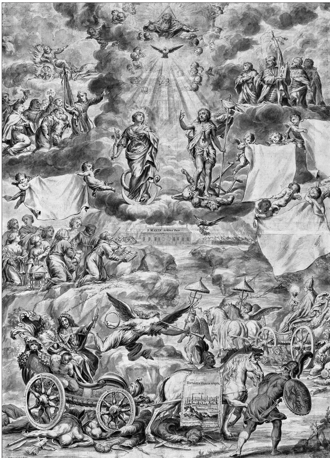
8. Jan Onghers: Vorzeichnung für das Thesenblatt, Federzeichnung, 1700, Magyar Nemzeti Múzeum, Budapest