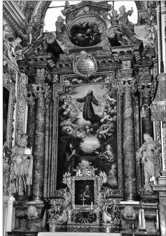
4. Altar für den Heiligen Petrus von Alcantara mit Porträts des Kaisers Leopold I. und der Infantin Margarita Theresa, 1671/72, Franziskanerkirche St. Hieronymus, Wien