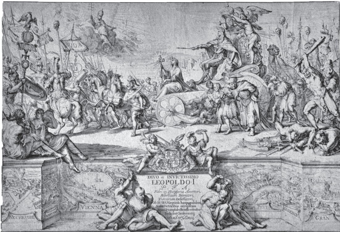
11. Romeyn de Hooghe: Allegorie auf den Triumph Leopolds I. über die Osmanen, Radierung, 1686, Sammlung Polleroß, Wien