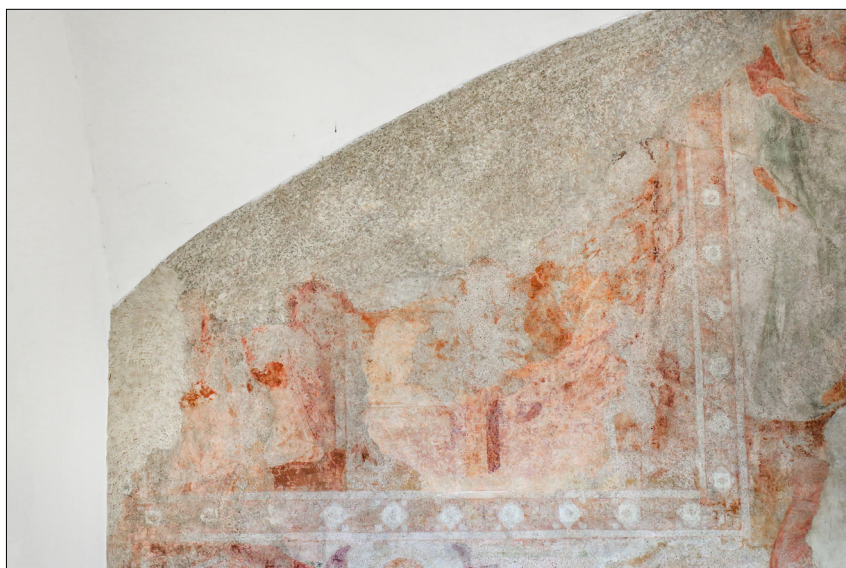
16. Furlanski slikar: Sv. Nikolaj obdaruje tri revne device (del pod obokom vhodne lope), konec 14. stoletja, cerkev sv. Miklavža, Godešič