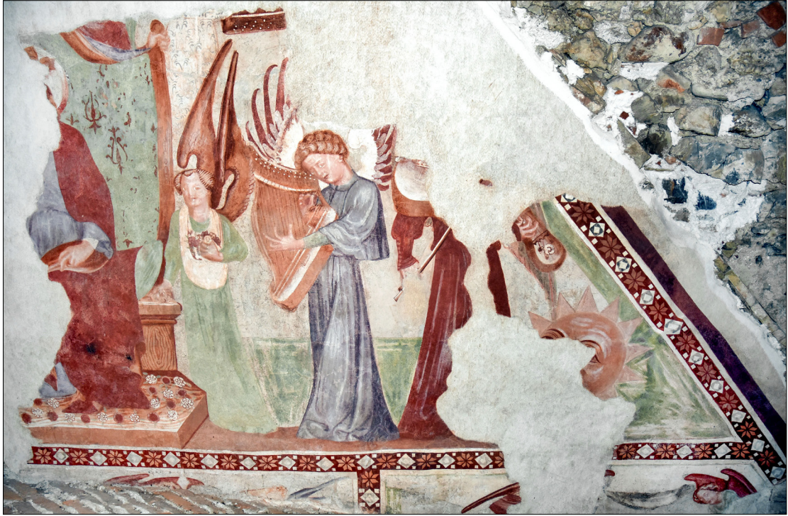
9. Furlanski slikar: Marijino kronanje (srednji in desni fragment), konec 14. stoletja, cerkev sv. Miklavža, Godešič

Ker je bila leva polovica (vključno s celotnim obrazom) osrednje figure, sedeče na prestolu, zaradi prebitja prehoda na podstrešje uničena, so raziskovalci to podobo razlagali zelo različno. Stele je njeno identiteto leta 1924 pustil odprto (»Sedeča figura, samo desna polovica ohranjena. Kaj je, se ne razbere.«), 115 leta 1935 pa označil za Boga (»Sedeč Bog«) ali Abrahama (»Abraham?«). 116 Pozneje je figuro imel za Sodnika, 117 pri čemer jo je najbrž zamenjal s Kristusom spodaj. Po Steletu je nekaj avtorjev figuro označilo za Boga Očeta, 118 Abrahama 119 ali Marijo, 120 še več avtorjev pa je ni omenilo ali identificiralo. 121 Desno od sedeče figure stoji manjši angel, ki iz svoje cule sipa cvetlice na podnožje prestola. Podoben angel je bil skoraj zanesljivo upodobljen tudi levo od prestola 122 (očitno mu je pripadal košček vijolične draperije), vendar ga je uničil prehod. Pri desnem angelu je prišlo v literaturi do dolgotrajne ikonografske pomote. Stele si je že leta 1924 zabeležil, da gre za angela