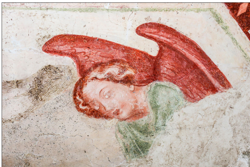
13. Furlanski slikar: Mučeništvo sv. Katarine Aleksandrijske (detajl angela nad obokom vhodne lope), konec 14. stoletja, cerkev sv. Miklavža, Godešič

prav tako ne drži. Kot v francoskem rokopisu iz 13. stoletja, ki ga navaja avtorica, 150 bi moral v središču enojnega (ne dvojnega) kolesa, ki ga obračajo manjši hudiči, biti večji hudič, na obodu pa naj bi bile mučene duše. Čeprav je kolo na Godešiču še razmeroma dobro vidno, na njem ni videti nobene od omenjenih figur. Avtorica sicer v kontekstu Poslednjih sodb (ki niso vezane na Pavlovo vizijo) opozarja tudi na rešitve z dvojnimi mučilnimi kolesom (»dvokolnica«), ki naj bi bilo pri nas nekdaj naslikano na Poslednji sodbi delavnice Janeza Ljubljanskega v ž. c. sv. Mihaela v Mengšu, 151 vendar v nobenem od takšnih primerov kolo ni zlomljeno, kakor je na Godešiču. Alenka Vodnik celo sama nekako opazi, da upodobitev na Godešiču odstopa od njene interpretacije, saj opozori, da je ime-