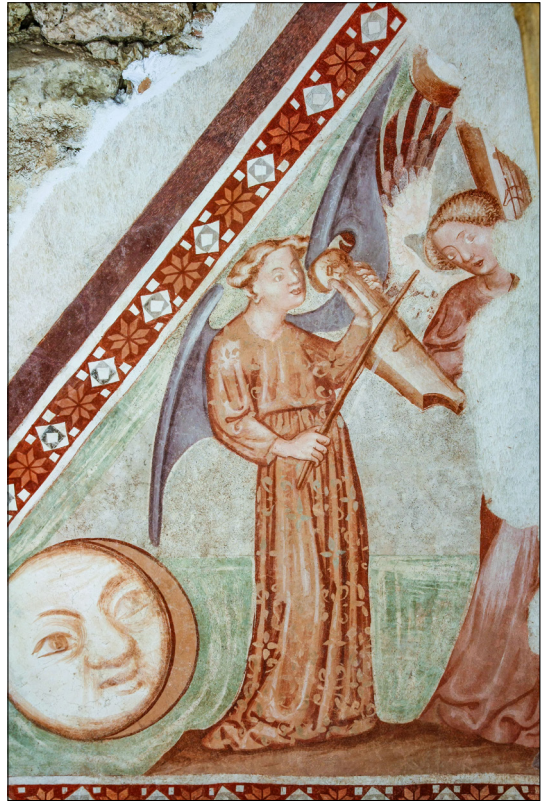
8. Furlanski slikar: Marijino kronanje (levi fragment) , konec 14. stoletja, cerkev sv. Miklavža, Godešič