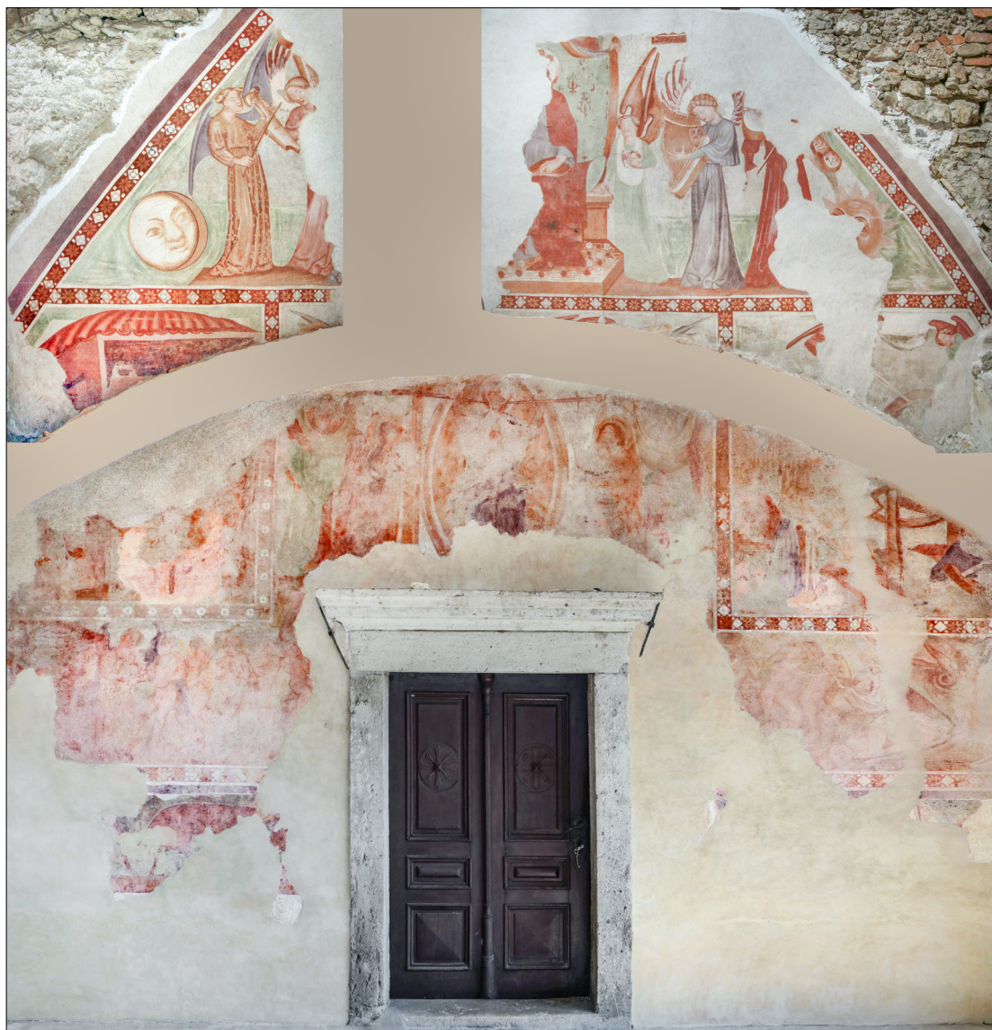
3. Fotomontaža poslikave nekdanje zahodne fasade, cerkev sv. Miklavža, Godešič

Že Vilma Praprotnik je leta 1973 opozorila, da so v stenskem slikarstvu pod italijanskim vplivom iz druge polovice 14. stoletja bordure (praviloma kosmatske) postale v večji meri kot prej poudarjene meje med posameznimi prizori, ki so med seboj jasno ločeni. 80 To nakazuje, da vsebinsko niso nujno povezani. Potek bordur na Godešiču, ki jih lahko kljub poškodbam zanesljivo rekonstruiramo, kaže na razdelitev v pet polj oziroma prizorov. Eno polje je zasedalo skoraj celotni zgornji (trikotni oz. trapezoidni) del fasade. Pod njim sta ob straneh dve skoraj kvadratni polji (zaradi naklona strehe imata nekoliko porezan zunanji zgornji vogal). Na sredini, nad današnjim portalom in ob njem, je večje polje v obliki zelo razpotegnjene narobe obrnjene črke T ali Y. Pod tem poljem, levo in desno od portala, je ohranjena poznejša, verjetno še srednjeveška poslikava