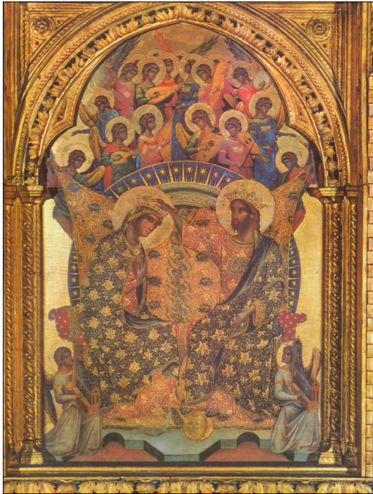
10. Paolo Veneziano: Marijino kronanje, okoli 1350, Benetke, Gallerie dell'Accademia