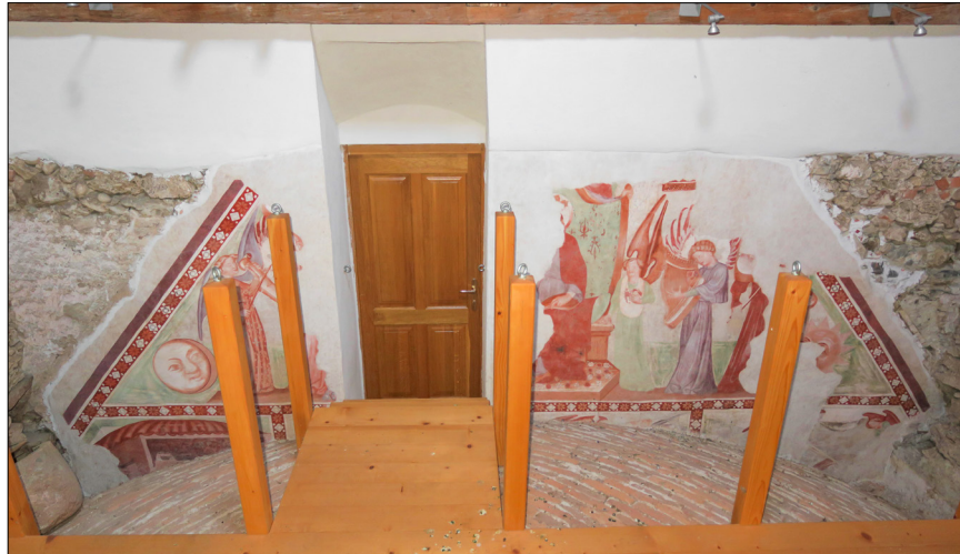
7. Pogled na zgornji del poslikave nekdanje zahodne fasade, cerkev sv. Miklavža, Godešič

začasno bivališče (prijetnejše od vic) duš v čakanju na poslednjo sodbo. 102 Ali se je Poslednja sodba s svetima osebama na Godešiču nagibala k tej interpretaciji, ostaja do odkritja podobnega primera, podprtega z ustreznimi pisnimi viri, odprto vprašanje.