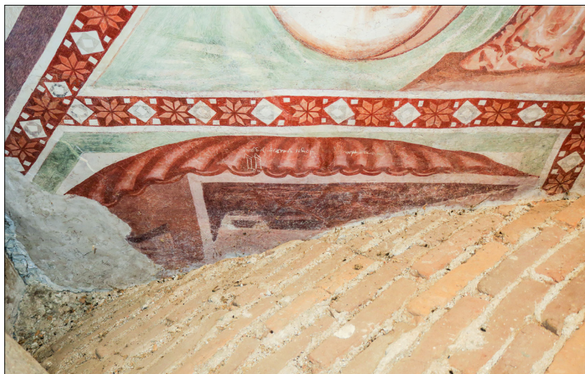
15. Furlanski slikar: Sv. Nikolaj obdaruje tri revne device (del nad obokom vhodne lope), konec 14. stoletja, cerkev sv. Miklavža, Godešič