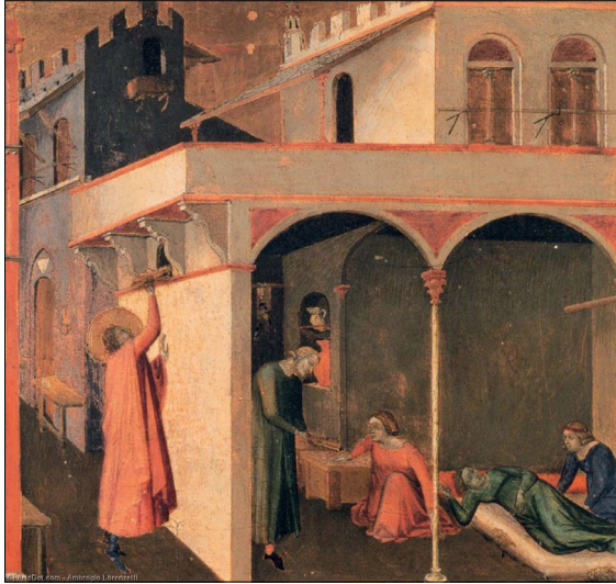
17. Ambrogio Lorenzetti: Sv. Nikolaj obdaruje tri revne device, okoli 1332, Firenze, Galleria degli Uffizi