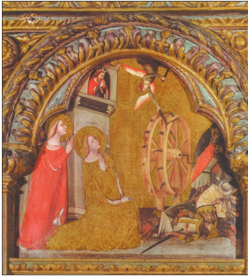
14. Vitale da Bologna: Mučeništvo sv. Katarine Aleksandrijske, sredina 14. stoletja, Bologna, S. Salvatore (Gnudi, Vitale da Bologna)

lo kolo kovinske zobe, da je bilo podobno »tako imenovanemu Katarininemu kolesu« in da gre za »nekoliko izpopolnjeno inačico mučilnega kolesa«. 152