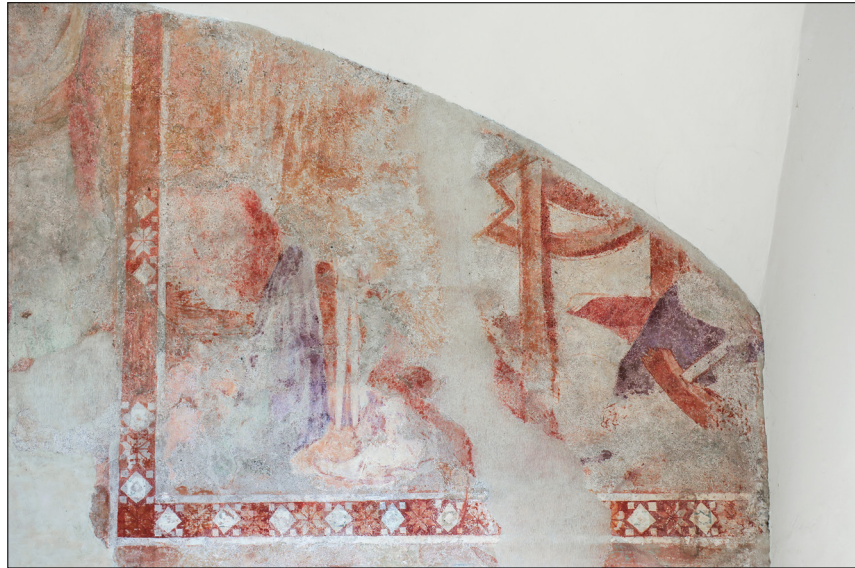
11. Furlanski slikar: Mučeništvo sv. Katarine Aleksandrijske (del pod obokom vhodne lope), konec 14. stoletja, cerkev sv. Miklavža, Godešič