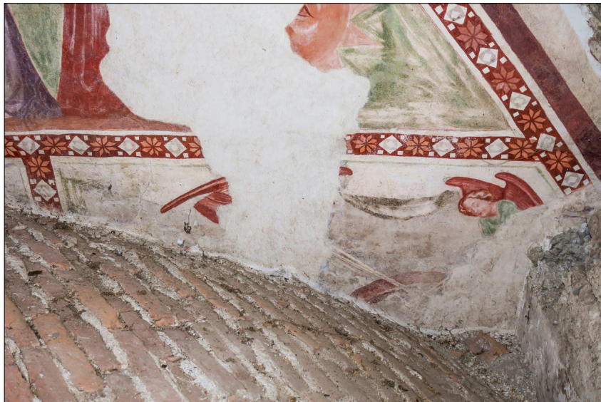
12. Furlanski slikar: Mučeništvo sv. Katarine Aleksandrijske (del nad obokom vhodne lope), konec 14. stoletja, cerkev sv. Miklavža, Godešič