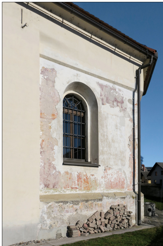
2. Pogled na južno steno prezbiterja z ostanki Poslednje sodbe Jerneja iz Loke, cerkev sv. Miklavža, Godešič

Monumentalna Poslednja sodba Jerneja iz Loke je danes močno poškodovana zaradi okna, ki so ga prebili okoli leta 1700 ter povečali in preoblikovali leta 1852 (sl. 2). 39 Verjetno je bila zasnovana podobno kot Poslednja sodba v p. c. sv. Lenarta na Krtini pri Dobu, ki je delo Mojstra Leonarda s konca 15. stoletja. 40 Na Godešiču v zgornjem delu desno še lahko razberemo desni del Kristusove mandorle in glave sedečih apostolov, pod današnjim oknom pa je nekoliko bolje viden odhod pogubljenih v peklenko žrelo. Posebnost godeškega prezbiterja je, da na južni steni – kar dokazujejo Jernejeve notranje in predvsem zunanje poslikave – prvotno ni imel okna. To nakazuje, da je naročnik že ob gradnji predvidel poseben ikonografski program poslikav notranje in zunanje strani stene. Izbiro tega dela stavbe za poslikavo bi lahko dodatno razložili s položajem cerkve, saj je bila ravno ta stena z nekdanje glavne ceste skozi vas najopaznejša. V pasu pod furlansko fresko Poslednje sodbe na zahodni fasadi cerkve sta ohranjena še dva fragmenta poslikave, ki je prvotno morda prekrivala starejše freske in bi jo prav tako lahko pripisali Jerneju iz Loke. Če to drži, bi terminus post quem za poslikave Jerneja iz Loke predstavljala letnica 1516 na grafitu starejše freskantske plasti na zahodni fasadi. 41