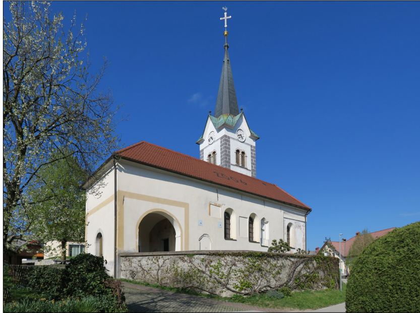
1. Pogled z jugozahodne strani, cerkev sv. Miklavža, Godešič

Cerkev sv. Miklavža se prvič omenja v popisu proščenj, ki je bil v urbar loškega gospostva iz leta 1501 vpisan približno v dvajsetih letih 16. stoletja. 4 Stavba je bila sicer postavljena precej prej, kar dokazuje njeno romansko jedro. Mojca Bertoncel in Štefan Pavli jo umeščata med 11. in 13. stoletje, 5 toda najverjetneje ni bila zgrajena pred 12. stoletjem, saj se je češčenje sv. Nikolaja (Miklavža) v srednjeevropskih deželah razširilo predvsem po prenosu njegovih relikvij iz Mire v Bari leta 1087, svetnikov patrocinij pa se je na Slovenskem uveljavil v drugi polovici 12. stoletja in v 13. stoletju. 6 Tudi razmeroma dolga romanska ladja na Godešiču ne kaže, da bi bila sezidana pred 12. stoletjem. 7 Bližnja cerkev sv. Miklavža v Spodnjih Bitnjah, na primer, je bila – slogovno že na prehodu iz romanike v gotiko – sezidana okoli leta 1300. 8 Cerkev na Godešiču je bila torej najverjetneje postavljena v 12. ali 13. stoletju, v času intenzivne kolonizacije in vzpostavljanja cerkvene organizacije v loškem gospostvu. 9 Podobne cerkve so bile v istem obdobju zgrajene na severnem obrobju gospostva, na primer na Jami in Okroglem. 10