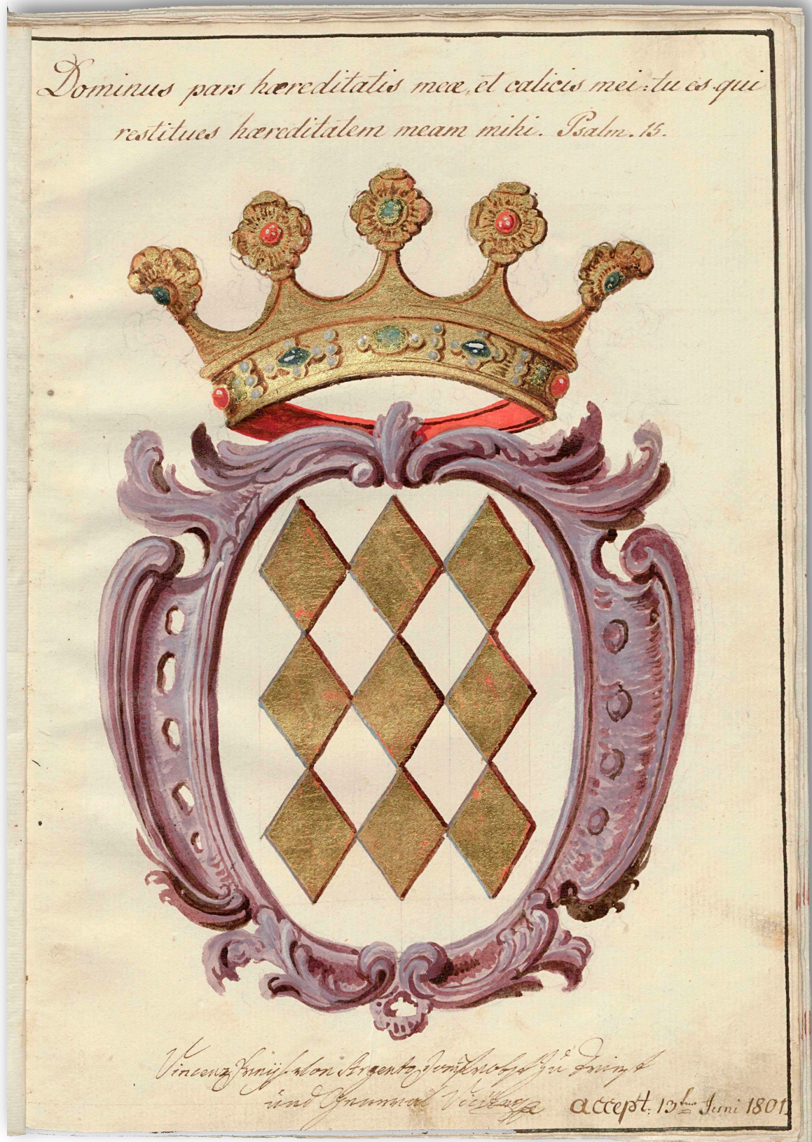
5. Vpisni list Vincenca barona Argenta, Spominska knjiga bratovščine sv. Dizme, Arhiv Republike Slovenije