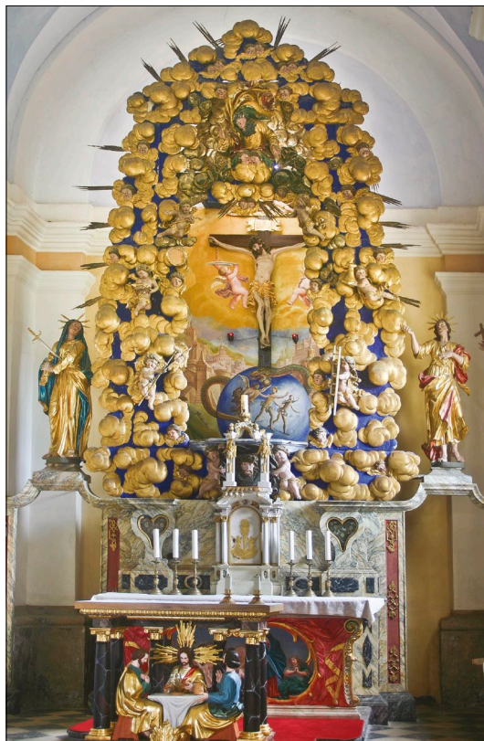
2. Frančiškanska rezbarska delavnica: veliki oltar, okoli 1718, Puštal pri Škofji Loki, podružnična cerkev sv. Križa na Hribcu