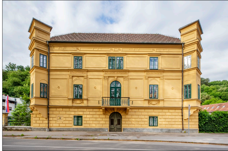
11. Galetov grad, Ljubljana Šiška