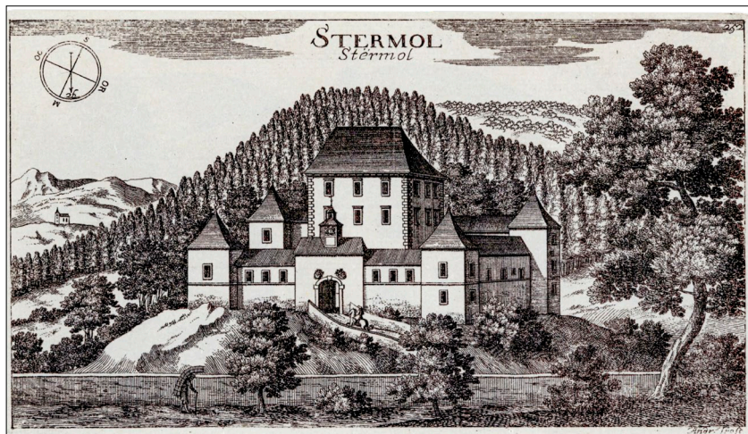
3. Grad Strmol, veduta v Valvasorjevi Topografiji Kranjske