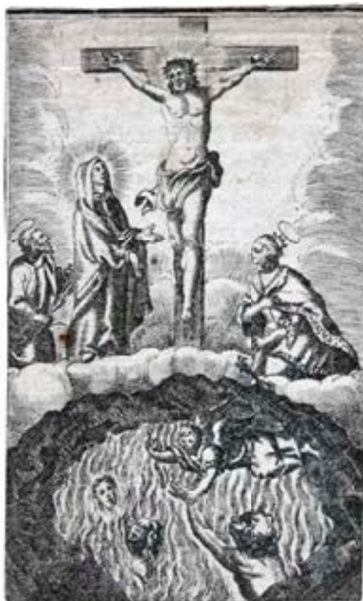
45. Sv. Uršula kot priprošnjica duš v vicah, podobica bratovščine sv. Uršule, Semeniška knjižnica, Ljubljana

Žena leži na postelji z visokim zglavjem in školjkasto okrašeno končnico in drži gorečo svečo, medtem ko ji duhovnik s križem v roki ob asistenci pomočnika podeljuje poslednji zakrament. Zraven postelje stoji mizica z odloženimi rekviziti oziroma zdravili, ob znožju je zbrana manjša skupina ljudi, in sicer mati z otrokom, moški s krčevito v molitev sklenjenimi rokami in ženska z usmiljenim prosečim pogledom, najbrž člani družine, morda pa kdo izmed njih zastopa tudi bratovščino. 179