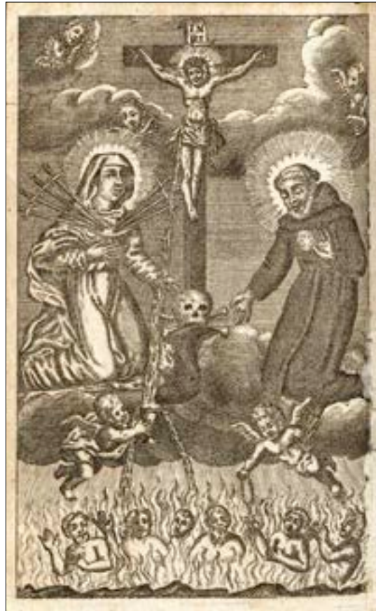
13. Žalostna Mati Božja in sv. Nikolaj Tolentinski kot priprošnjika duš v vicah, naslovni list knjige Marka Pohlina Sveta, inu nuzna je misl sa te mertve moliti , 1769

Nad Križanim sta se tokrat pojavila Bog Oče in sveti Duh, številčno se je okrepila skupina angelov, ki opirajo križ (eden je prikazan s hrbtni strani), manjši putto se je preselil k napisu, ki v grščini, hebrejščini in latinščini naznanja, da je Jezus Nazarečan judovski kralj, z angelci pa se je zapolnil tudi levi zgornji del platna, kjer se z njihovo pomočjo dviga v nebesa duša v podobi majhne s tančico le rahlo zakrite ženske. Pomembno spremembo je opaziti pri Mariji, ki ne predstavlja več tipa Žalostne Matere Božje. Ob znani predlogi pa problem kališke slike ostaja njena datacija, saj se zaradi tankega barvnega sloja brez spodnjih nanosov zdi kot novejša kopija, ki izstopa tudi s poudarjenimi