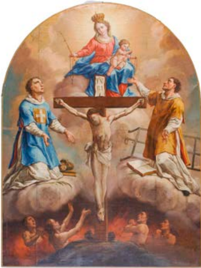
46. Leopold Layer: Rožnovenska Mati Božja, sv. Štefan in sv. Lovrenc kot priprošnjiki duš v vicah, pred 1783, Gorenjski muzej, Kranj

s puščicama) prevzela njeno prvotno klečečo pozo, kot pendant pa je pokleknil tudi Jožef. Na njihovo priprošnjo se je v brezno vic spustil angel, ki izhodu najbližjo dušo že vleče iz plamenov in s prstom kaže na Odrešenika. Grafiko so, poleg »primarne« s svetnico v zavetniškem plašču, med drugim verjetno širile ljubljanske uršulinke, pri katerih je bila leta 1723 uradno potrjena in leta 1726 vpeljana bratovščina sv. Uršule. 181