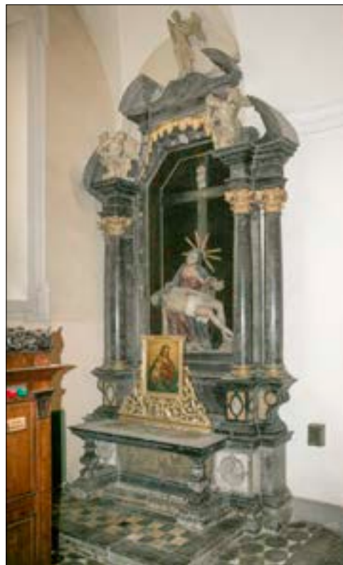
24. Oltar Žalostne Matere Božje, 1680/81, ž. c. sv. Jakoba, Ljubljana