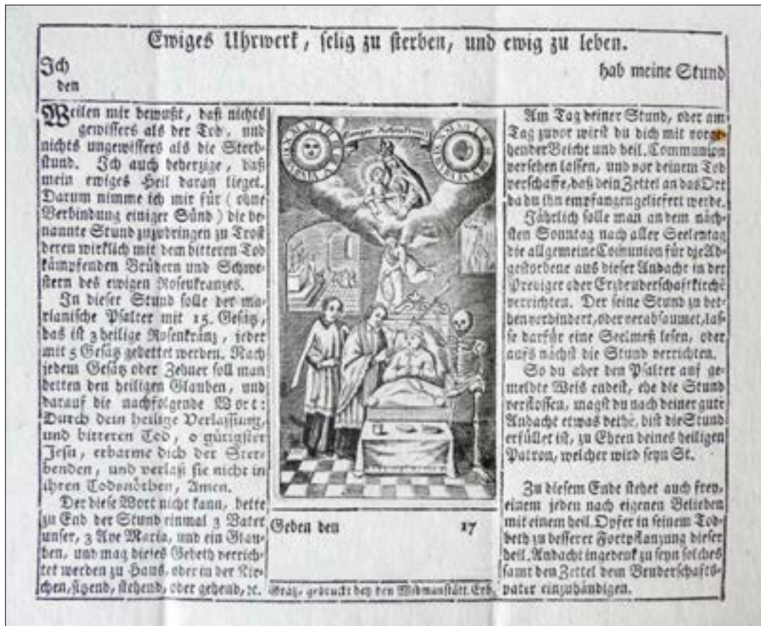
6. Rožni venec pomaga umirajočemu, pristopnica bratovščine vednega rožnega venca v Selnici, natisnili Widmanstätterjevi dediči, ok. 1782, Nadškofijski arhiv Maribor