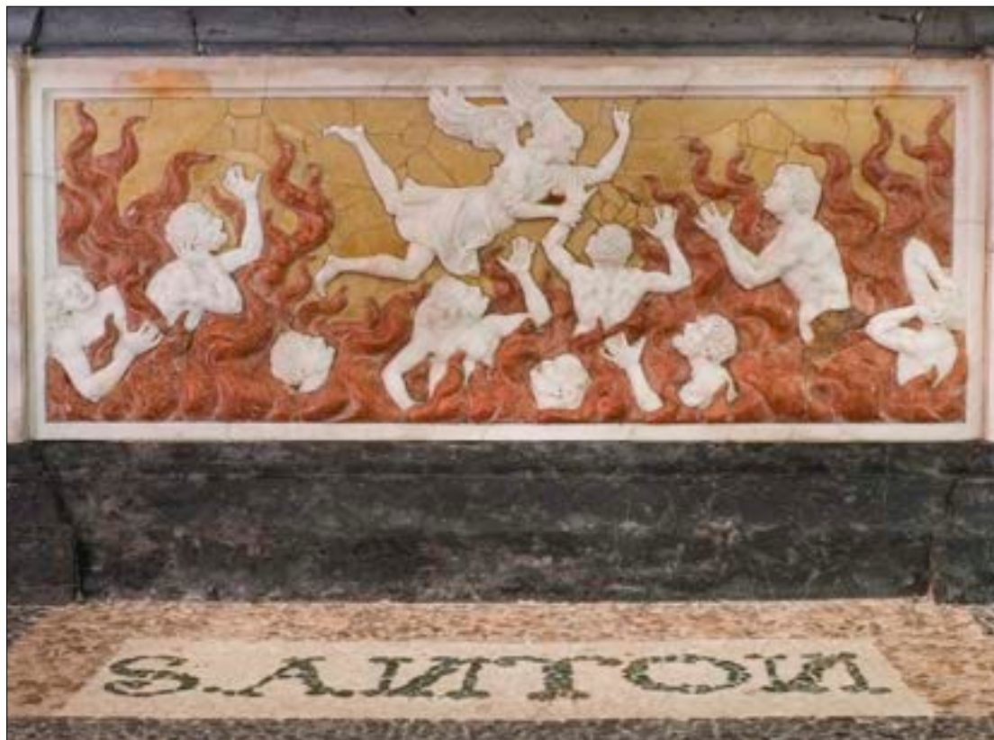
47. Francesco Robba: Duše v vicah , ok. 1721, oltar sv. Antona Padovanskega, ž. c. nadangela Mihaela, Vrnsko