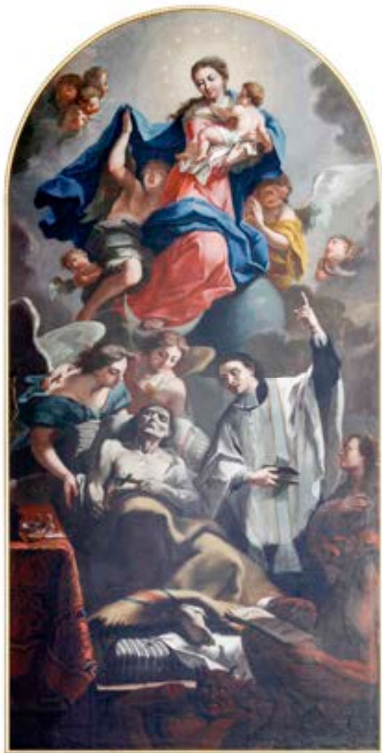
7. Valentin Metzinger: Marija Pomočnica umirajočih , 1734, ž. c. sv. Petra, Ljubljana

nos Virgo gloriosa; Libera nos Virgo benedicta ), moledujoče ozirajo na Marijo (sl. 8). 46 Naj ob tem zgolj opozorimo še na sezname umrlih članov kongregacije, ki izstopajo s simboličnimi podobami smrti in človeške minljivosti pa tudi z dekorativno oblikovanim besedilom o dolžnosti živih članov do umrlih, tj. o obveznih molitvah in svetih mašah. 47