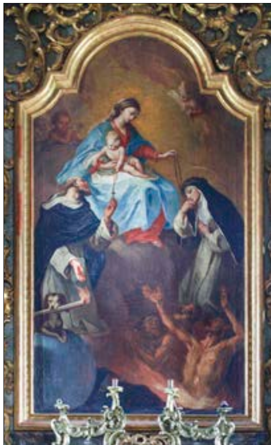
3. Rožnovenska Mati Božja s sv. Dominikom in sv. Katarino Siensko ter dušami v vicah, šestdeseta leta 18. stoletja, ž. c. sv. Jerneja, Slovenska Bistrica

vratu ovešen škapulir, in prizor umiranja, ko angel v moči škapulirja, ki ga nosi članica na smrtni postelji, odganja od nje hudobne duhove. Motiv nadaljuje srednjeveško tradicijo Ars moriendi in jo prilagaja potridentskim razmeram. 35