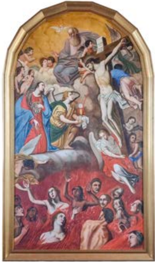
14. Marija kot priprošnjica duš v vicah, p. c. sv. Križa, Kališe

konturami. 69 Ko jo je leta 1910 na svojem terenskem ogledu popisal France Stele, si je zabeležil: Slika »duše v vicah« poleg oltarja, po starem dragocenem originalu. 70 Najverjetneje je pri tem imel v mislih nekdanjo, staro kališko sliko (da bi se skliceval na kako drugo predlogo, 71 se zdi manj verjetno), ki naj bi nastala za tamkajšnjo bratovščino Kristusovega trpljenja. Čas njene ustanovitve ni natančneje znan. Njena matrikula je sicer ohranjena, toda nepopolna, tako da uvodnemu prepisu odpustkov, s katerimi je bratovščino obogatil Klemen XII. in so jih člani lahko prejeli pod običajnimi pogoji, manjka zadnja stran. 72 Na srečo se je ohranila vsaj listina, s katero je isti papež 23. septembra 1732 podelil popolni odpustek pokojnim članom, za katere so se ob določenih dneh darovale maše pri bratovščinskem oltarju. 73 Kljub pomanjkljivostim pa matrikula predstavlja zanimivost, ker vključuje tematiko sedmerih del usmiljenja, pomembno za krščansko življenje, kar je treba izpostaviti še zlasti zato, ker med zapuščino bratovščin na Slovenskem ne najdemo tovrstnega likovnega gradiva, kakršnega sicer srečujemo na tujem. 74 V matrikuli je namreč kot temeljno vodilo kališke bratovščine v slovenščini zapisan