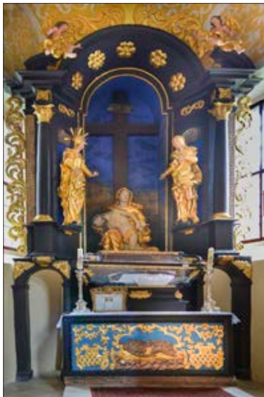
28. Oltar Žalostne Matere Božje, 1680, ž. c. sv. Marije, Ruše