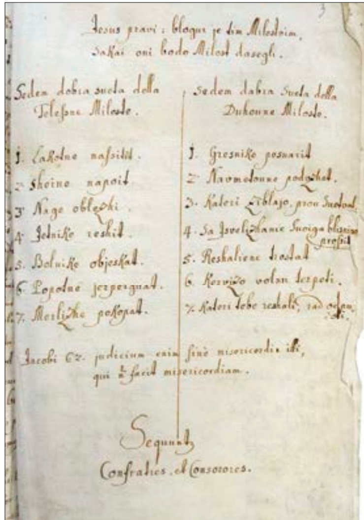
15. Telesna in duhovna dela usmiljenja, zapisana v slovenskem jeziku v matrikuli bratovščine Kristusovega trpljenja v Kališah, Nadškofjski arhiv Ljubljana

seznam telesnih in duhovnih del usmiljenja, ki naj bi jih člani opravljali, da bi dosegli srečno smrt in se izognili ostri sodbi (sl. 15). Seznam uvajajo besede iz Jezusovih blagrov (Mt 5,7): Jesus pravi: blagur je tim Milostvim, sakaj oni bodo Milost dosegli . V levi koloni so nanizana telesna dela: Sedem dobra sueta della Telesne Miloste . 1. Lakotne nafsitit . 2. Sheine napoit . 3. Nage oblezhi . 4. Jetnike reshit . 5. Bolnike objeskat . 6. Popotne jerperguat . 7. Merlizhe pokopat ; v desni pa duhovna opravila: Sedem dobra sueta della Duhoune Miloste . 1. Gresnike posuarit . 2. Navmetoune podvzhet . 3. Kateri zibljajo, prou suetvat . 4. Sa Isvelizhanie suoiga blisniga profsit . 5. Reshaliene trostat . 6. Kervizo volnu terpeti . 7. Kateri tebe reshali, rad odpusti . Zaključna misel iz Jakobovega pisma je navedena v latinščini: Jacobi C2. judicium enim sine misericordia illi, qui non facit misericordiam . 75 Likovno vrzel v upodabljanju del usmiljenja na Slovenskem je očitno, tudi kar zadeva bratovščine, zapolnil Kanizijev katekizem s podobami, ki je bil v slovenskem prevodu Janeza Čandka natisnjen v Augsburgu leta 1615. 76