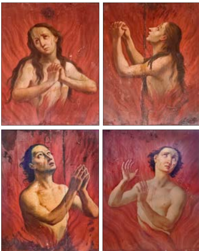
41. Leopold Layer: Duše v vicah, slike iz ž. c. sv. Petra, župnijski urad Radovljica