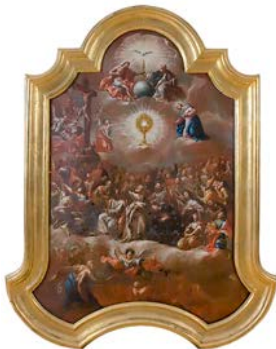
19. Poveličanje presvetega Zakramenta, tretja četrtina 18. stoletja, ž. c. Marijinega vnebovzvetja, Grad na Goričkem

Monštranco s sveto hostijo srečamo tudi v motivu umiranja, kot kaže na primer podobica bratovščine vednega češčenja sv. Rešnjega telesa iz Laškega, ki jo je okoli leta 1773 v Gradcu vrezal Johann Veit Kauperz (sl. 20). 92 Prizor poudarja zvezo med adoracijo presvetega Zakramenta in srečno smrtjo. Nanjo opozarja duhovnik, ki stoji ob postelji umirajoče članice bratovščine: medtem ko z levico kaže na sv. Rešnje telo, ki ga v monštranci spoštljivo drži angela,