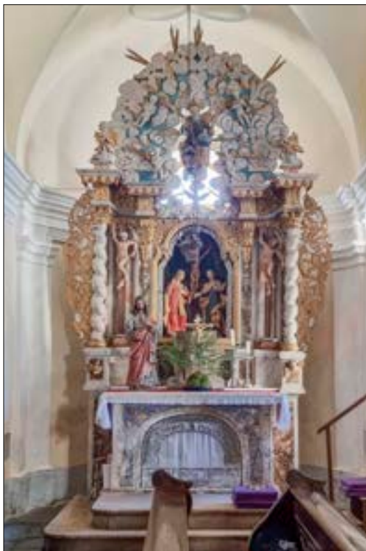
31. Oltar Kristusovega smrtnega boja, ž. c. sv. Erazma, Soteska