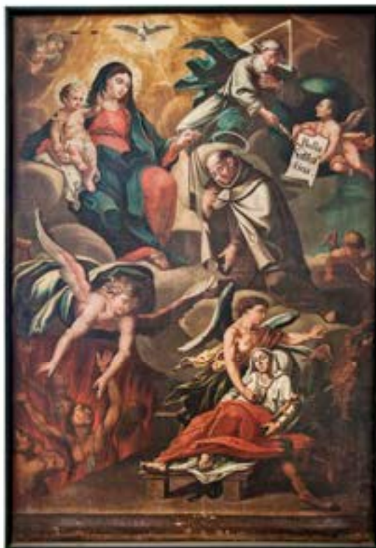
1. Škapulirska Mati Božja s sv. Simonom Stockom, sabatinsko bulo, dušami v vicah in umirajočo članico bratovščine, slika iz frančiškanske c. v Brežicah, 1763, frančiškanski samostan, Ljubljana

Glede na obravnavano temo ima med vsemi navedenimi prednost karmelska bratovščina, katere člani so nosili rjav škapulir, ki jim je po Marijini obljubi zagotavljal, da bodo (pod izpolnjenimi pogoji) rešeni večnega pogubljenja, sabatinska bula papeža Janeza XXII. pa dodatno še, da bodo osvobojeni iz vic prvo soboto po smrti. 34 Škapulir je tako postal simbol katoliškega nauka o vicah, ki ga je potridentska Cerkev nasproti protestantom močno poudarjala, zato je razumljivo, da ga na podobah spremljajo verne duše, včasih tudi prizor umiranja. Oboje nazorno združuje slika iz nekdanje frančiškanske cerkve v Brežicah, zdaj hranjena pri frančiškanih v Ljubljani, nastala za tamkajšnjo škapulirsko bratovščino leta 1763 pod čopičem anonimnega mojstra po predlogi Franca Jelovška (sl. 1). V kompozicijo vključuje izročanje škapulirja sv. Simonu Stocku, sabatinsko bulo, na katero z žezlom kaže Bog Oče, prizor, v katerem angel rešuje iz vic duše, ki jih varuje okrog