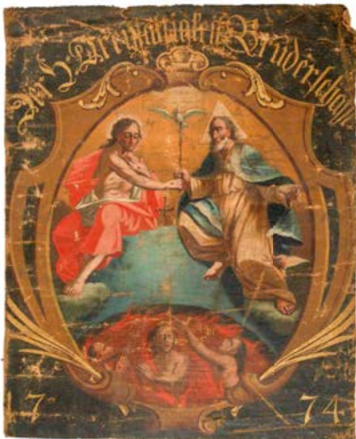
36. Sv. Trojica z dušami v vicah, bandero bratovščine sv. Trojice v ljubljanski stolni c. sv. Miklavža, 1774, Narodni muzej Slovenije, Ljubljana

na Antona Cebeja. Označujeta jo napis Der H: Dreyfaltigkeit Bruderschaftt in letnica 1774. V ovalnem ornamentalnem okvirju sedita na zemeljski obli (z majhnim križem na vrhu aludira na vladarsko jabolko) Bog Oče in Bog Sin, sredi med njima, tik nad Očetovim žezlom, pa lebdi Bog sveti Duh. V spodnjem delu zemlje se odpira brezno z ognjenimi plameni in tremi dušami, ki se proseče ozirajo navzgor. Upodobitev vic izraža skrb bratovščine za njene rajne člane. Svetotrojiška skupina je blizu kipu, ki se nahaja v ljubljanskem semenišču in je bil s precejšnjo verjetnostjo prepoznan za procesijski znak stolnične bratovščine. 153