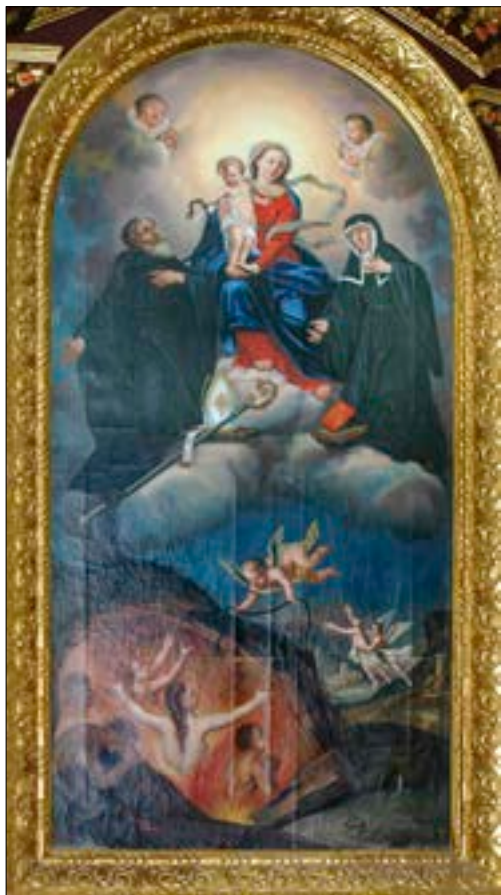
2. Marija Tolažnica s sv. Avguštinom in sv. Moniko ter dušami v vicah, tretja četrtina 18. stoletja, božjepotna c. Marijinega vnebovzeta, Nova Štifta