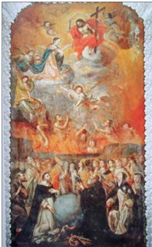
10. Marija kot priprošnjica duš v vicah, pozno 17. stoletje, ž. c. sv. Marije, Puščava