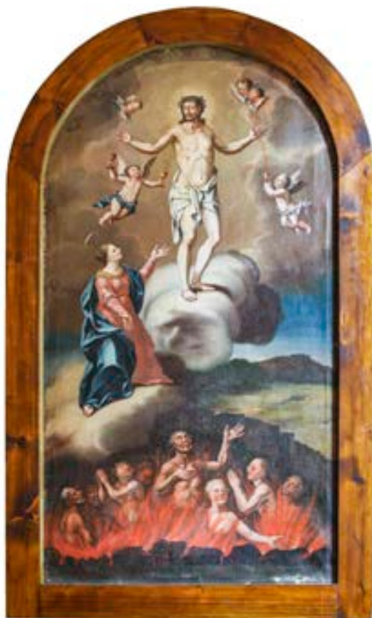
18. Marija kot priprošnjica duš v vicah, p. c. Povišanja sv. Križa, Vrhpolje

Poznobaročna slika iz druge polovice 18. stoletja v podružnični cerkvi Povišanja sv. Križa v Vrhpolju 87 se od zgoraj opisanih razlikuje predvsem v tem, da gledalcu namesto svete Trojice predstavlja zgolj Kristusa, in sicer kot tip Trpina (sl. 18). Ta s trnjevo krono na glavi stoji na oblaku, medtem ko v zraku lebdeča putta v kelih prestrezata kri iz njegovih ran. Pred njim kleči Marija brez posebnih atributov in s kretnjo desnice opozarja na duše v očiščevališču. Nebesa so se spustila tako nizko, da se je v spodnjem delu kompozicije odprl pogled v krajino z gorami in ravnico z jezerom, s čimer so tudi vice, pogreznjene v jamo v ospredju, dobile konkretnjšo lokacijo. V ognjenih