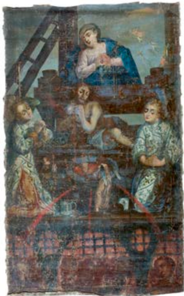
22. Kristus v stiskalnici, pozno 17. ali zgodnje 18. stoletje, Narodni muzej Slovenije, Ljubljana

telo (hrano), Rešnjo kri (pijačo) in Božjo besedo (knjiga). Ob vodnjaku kleči oseba s sklenjenimi rokami, rožnim vencem in svečo, ki najbrž predstavlja vodjo telovske bratovščine, medtem ko moleki, obešeni čez rob vodnjaka, gotovo namigujejo na soudeležbo rožnovenske bratovščine. Ob Kristusu v stiskalnici in drugih evharističnih simbolih spoštljivo klečita angela adoranta, ki se slogovno še vezeta na 17. stoletje, sicer pa bi slika utegnila biti nekoliko mlajša.