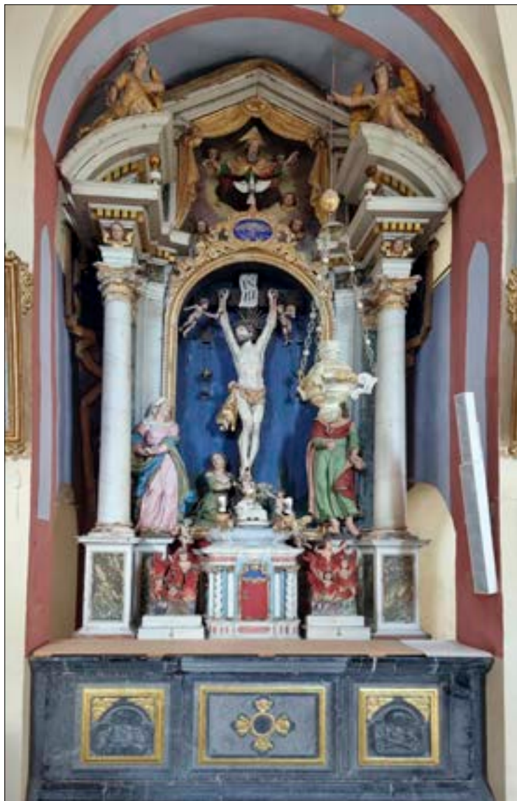
30. Oltar sv. Križa, p. c. sv. Andreja, Planina nad Horjulom

Z zanimivo zgodovino in umetnostno dediščino izstopa bratovščina Kristusovega smrtnega boja, ki je delovala v župnijski cerkvi sv. Erazma v Soteski. Po podatkih v popisu bratovščin iz leta 1773 je bila ustanovljena leta 1736, 126 ko ji je papež Klemen XII. podelil odpustke pod običajnimi pogoji, 127 njen namen pa je bil pripomoči ljudem k pobožnosti in posvečevanju. Ustanovo rednih maš, ki so se morale ob petkih brati za njene pokojne člane, je leta 1759 napravil novomeški