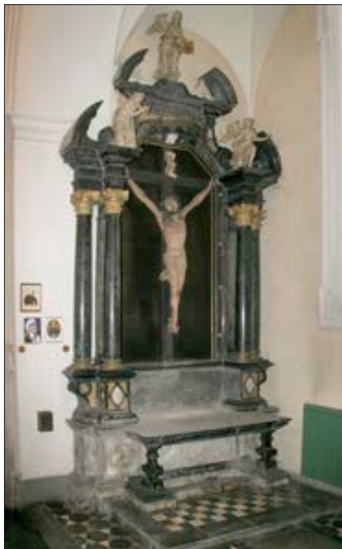
23. Oltar sv. Križa, 1678, ž. c. sv. Jakoba, Ljubljana