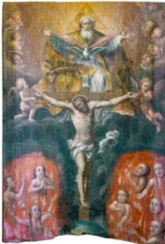
35. Sv. Trojica z dušami v vicah, p. c. sv. Fabijana in Boštjana, Predgrad

Drugačno, običajno svetotrojiško skupino pa najdemo na banderski sliki, ki je bila, kot se zdi zelo verjetno, last bratovščine svete Trojice v ljubljanski stolnici, 151 zdaj pa jo hrani Narodni muzej Slovenije (sl. 36). 152 Po obraznem tipu figur in nekaterih detajlih (npr. poudarjeni ključnici) spominja