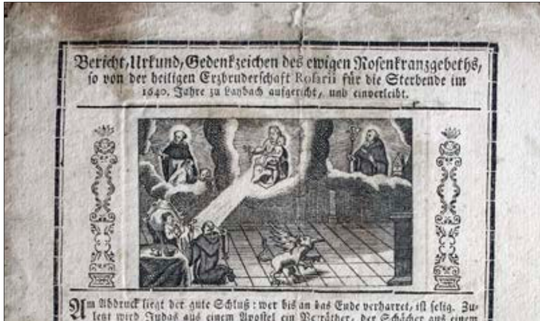
5. Rožni venec pomaga umirajočemu, pristopnica bratovščine vednega rožnega venca pri ljubljanskih avguštincih, natisnili Widmanstätterjevi dediči, detajl, ZRC SAZU, Umetnostnozgodovinski inštitut Franceta Steleta, Ljubljana