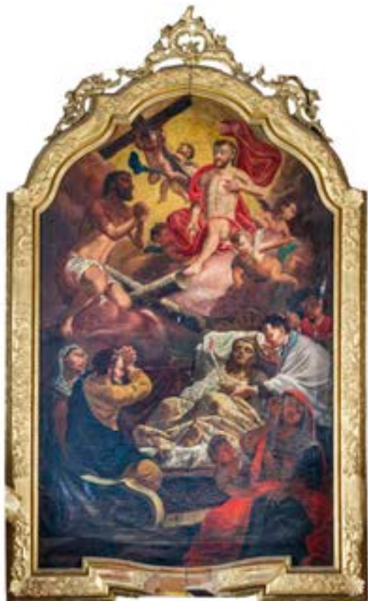
44. Franz Ignaz Flurer: Sv. Dizma kot priprošnjik umirajočih, ok. 1721, proštjska c. sv. Jurija, Ptuj