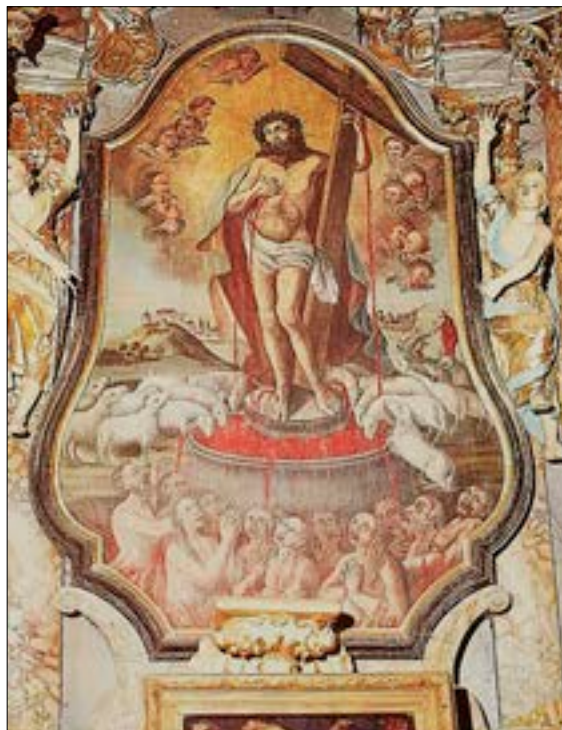
21. Vodnjak življenja/usmiljenja, oltar Kristusove krvi, ok. 1760, ž. c. sv. Marjete, Kotlje

desnico usmerja k moškemu in ženski na klečalniku, ki sta zatopljena v češčenje. Prizor je osredotočen na tolažbo odhajajoče duše (na previdenje opozarjajo rekviziti na mizici), odpadle pa so skušnjave, s kakršnimi se je umirajoči spopadal na starejših upodobitvah.