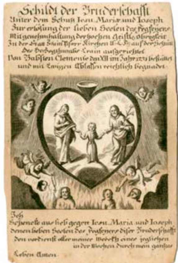
37. Sv. Družina z dušami v vicah, pristopnica bratovščine Jezusa, Marije in Jožefa v ž. c. Marijinega brezmadežnega spočetja v Kamniku, Narodna in univerzitetna knjižnica, Ljubljana

Kamniška bratovščina Jezusa, Marije in Jožefa oziroma sv. Družine je še posebej interesantna zaradi izjemne simbolike srca: ob njenih praznikih so namreč v skladu s praznično vsebino na oltar izpostavljali bodisi »veselo srce« ( cor gaudiosum ) bodisi »žalostno srce« ( cor dolorosum ) in ob tem molili litanije v čast sv. Jožefu ali pa litanije sedmerih Marijinih žalosti oziroma za verne rajne. 156 Ponazoritev čustev s srcem lahko z veliko verjetnostjo povežemo z vplivom klariške bratovščine Srca Marijinega v bližnjih Mekinjah. Ko je ta leta 1719 začela delovati v tamkajšnji redovni cerkvi kot prva na Kranjskem (domnevno celo kot prva na Slovenskem), je postala žarišče češčenja Marijinega srca, ki je bilo na mekinjskih podobah tudi fizično predstavljeno. 157 Kako sta izgledali omenjeni srca kamniške bratovščine, ne vemo, likovno pa nam ju približa bratovščinska pristopnica, katere izvod hrani Narodna in univerzitetna knjižnica v Ljubljani (sl. 37). Na njej je upodobljeno srce kot organ, v katerem stoji na oblakih svetlobo izžarevajoča sv. Družina. Srce obdajajo trije angelski krilatci, dva pa se spuščata k dušam v vicah – eden jim prihaja na pomoč z rožnim vencem – ki so prikazane v spodnjem delu grafike. Napis nad srcem sporoča, da je bratovščino pod varstvom Jezusa, Marije in Jožefa za rešitev duš iz vic v župnijski cerkvi na Šutni v Kamniku potrdil in bogato obdaril z odpustki papež Klemen XII. leta 1731. 158 Na spodnjem robu podobice pa je zapisana zaobljuba