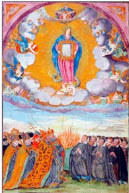
8. Brezmadežna s člani kongregacije Brezmadežnega spočetja, frontispic matrikule istoimenske bratovščine pri ljubljanskih jezuitih, Arhiv Republike Slovenije, Ljubljana