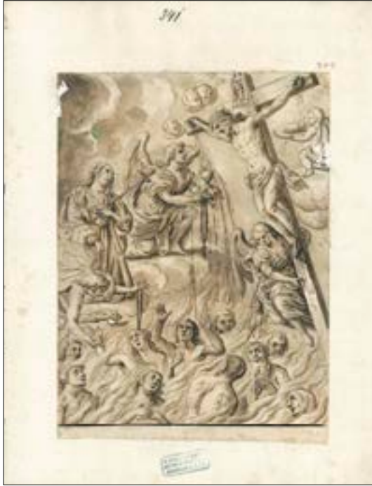
11. Žalostna Mati Božja kot priprošnjica duš v vicah, lavirana perorisba, Valvasorjeva zbirka, Metropolitanska knjižnica, Zagreb