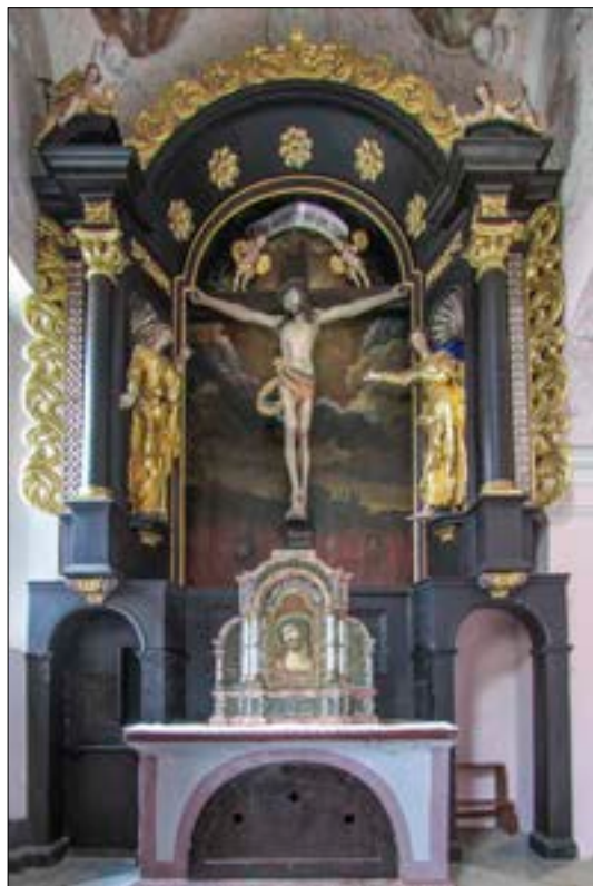
27. Oltar sv. Križa, 1676, ž. c. sv. Marije, Ruše