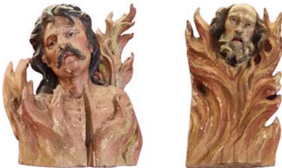
39.–40. Duši v vicah, Sokličeva zbirka, Koroški pokrajinski muzej, Slovenj Gradec