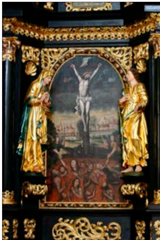
29. Oltar sv. Križa, konec 17. stoletja, ž. c. Marijinega vnebovzvetja, Olimje

mogoče ugotoviti, povezuje pa se s pavlinsko duhovnostjo. Sergej Vrišer ga je pogojno pripisal pavlinski rezbarski delavnici. 111