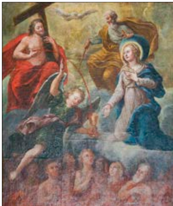
17. Marija kot priprošnjica duš v vicah, kapucinska c. sv. Ane, Škofja Loka