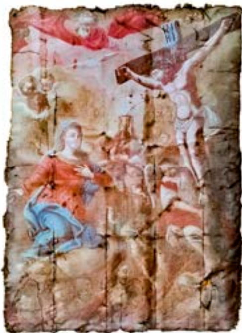
16. Marija kot priprošnjica duš v vicah, slika iz p. c. sv. Ane na Grabnu v Novem mestu, frančiškanski samostan Novo mesto