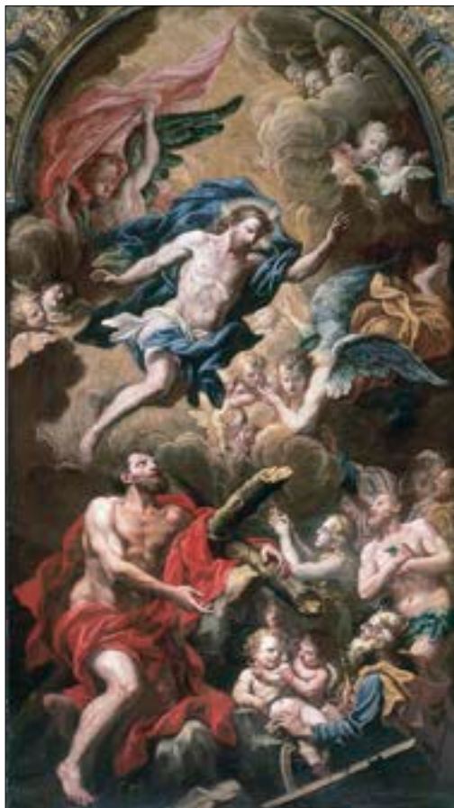
42. Giulio Quaglio: Kristus s sv. Dizmom v predpeklju, 1704, stolna c. sv. Miklavža, Ljubljana