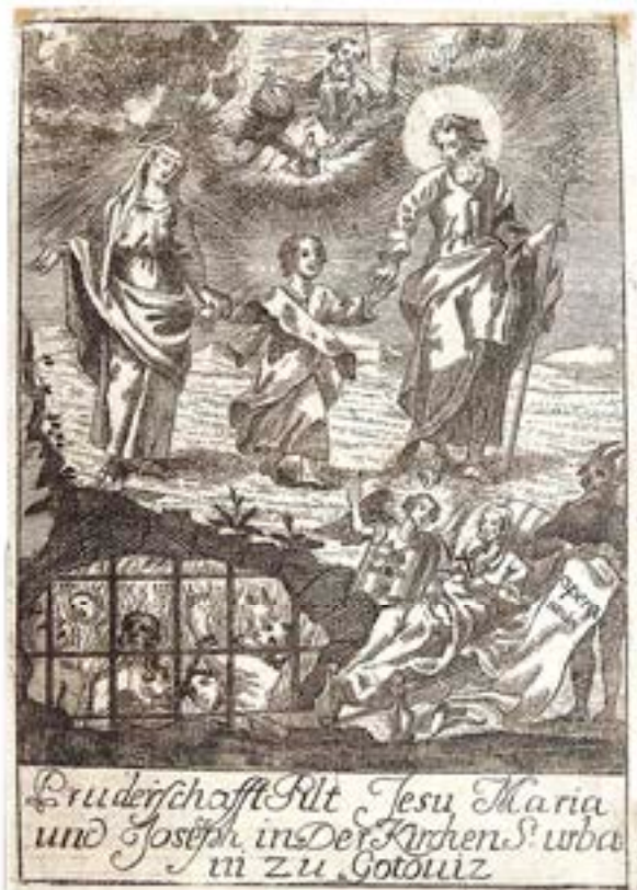
38. Sv. Družina z umirajočim in dušami v vicah, pristopnica bratovščine Jezusa, Marije in Jožefa v ž. c. sv. Urbana v Godoviču, Semeniška knjižnica, Ljubljana

Ustanovitev bratovščine »na čast sv. Družini in za duše v vicah« pri Sv. Urbani v Godoviču je bila povezana z usodo župnijske cerkve, ki je v letih 1737 in 1749 pogorela in se nato 1753 podrla, ob tem pa pokopala pod seboj pet delavcev. Ko so farani leta 1755 zgradili novo cerkev, so ob njeni posvetitvi začeli vpisovati člane v novoustanovljeno bratovščino. Do leta 1791 se jih je vanjo vključilo okoli osemsto, od tega sedemnajst duhovnikov. Njen namen so pojasnjevala bratovščinska pravila, in sicer, da želi »s posebnim češčenjem sv. Družine in posnemanjem njenih čednosti sprositi si njeno varstvo in srečno zadnjo uro«. 160 Popolni odpustek dušam rajnih članov bratovščine je 28. februarja 1755 podelil papež Benedikt XIV. 161 Bratovščinska pristopnica, mlajša od kamniške, se ne izraža s simboliko srca, temveč se likovno zgleduje predvsem po škapulirskih in rožnovenskih bratovščinah (sl. 38). 162 Njen osrednji