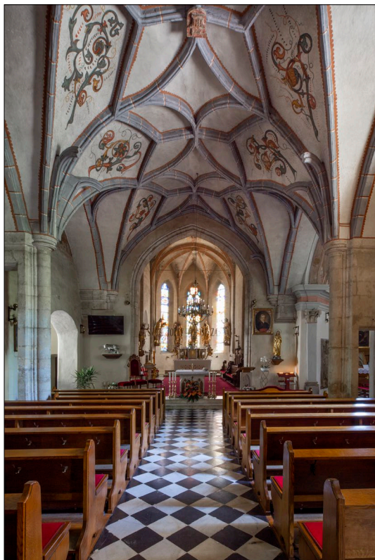
1. Notranjščina župnijske cerkve sv. Jurija, Slovenske Konjice