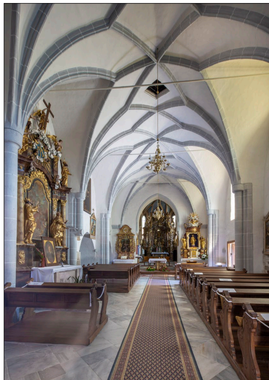
4. Notranjščina župnijske cerkve sv. Nikolaja, Vuzenica