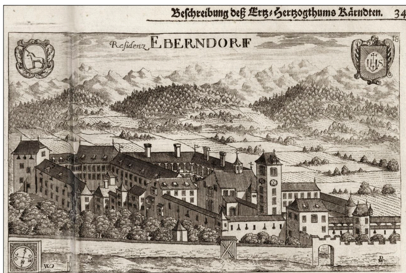
3. Dobrila vas/Eberndorf, samostanski kompleks s cerkvijo Marije Vnebovzete