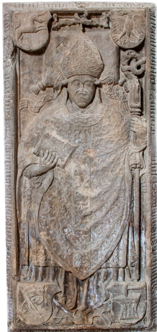
2. Nagrobna plošča Valentina Fabrija, župnijska cerkev sv. Jurija, Slovenske Konjice