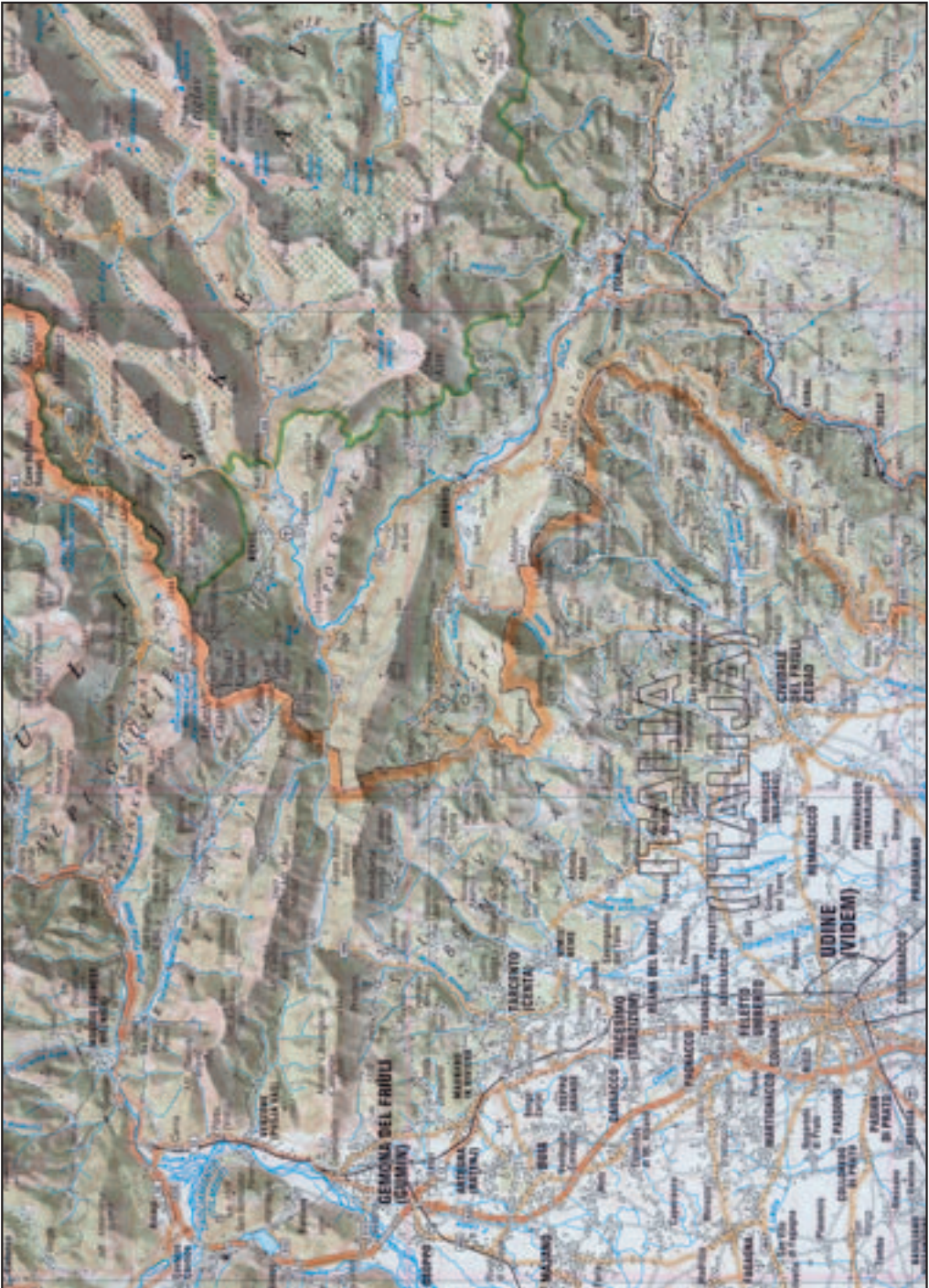
Figure 13: Some Slovenian geographical names in Venetian Slovenia deviate from standard Slovenian norms. Endonyms follow a slash and exonyms are written in parentheses on the 1 : 250,000 National General Map of the Republic of Slovenia (Državna pregledna karta Republike Slovenije ... 2008).