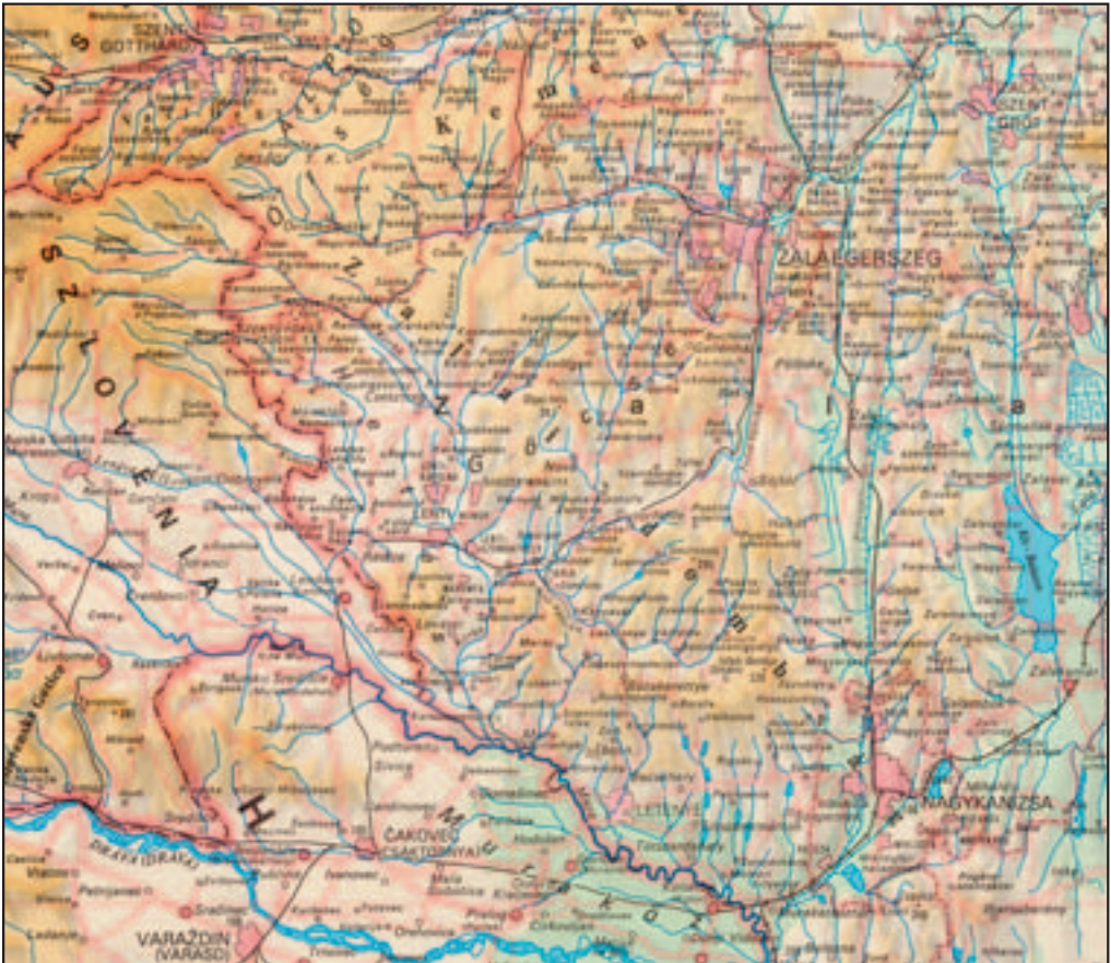
Figure 10: In the same atlas (Cartographia Világtatlasz 1995), the exonymic settlement names Muraszombat and Lendva appear on a more detailed map of Hungary and neighboring Prekmurje; they are written in parentheses.

Although the Hungarians are not excessively interested in the territory of most of Slovenia, which was once in the Austrian part of the empire, the situation is entirely different regarding toponyms in Prekmurje, which was part of the Hungarian half of the empire until 1918. At that time the names of all places were either monolingual Hungarian or bilingual Hungarian/Slovenian, and so it is understandable to some