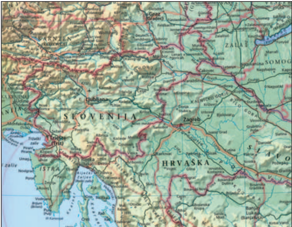
Figure 1: Slovenian exonyms in neighboring countries are written in parentheses, as are also Slovenian endonyms there (Veliki atlas sveta 2005, 65).

The greatest number of Slovenian exonyms in neighboring countries is found in Austria and Italy, and considerably fewer in Croatia and Hungary. We are speaking here about true exonyms that apply to major settlements outside of current Slovenian ethnic territory, although they are often in its vicinity, and so the Slovenian population is (or was) in close contact with them. Characteristic Slovenian exonyms in Austria (names with a clear Slovenian etymology are marked with an asterisk) are Althofen ( Stari Dvor ), Brückl ( Mostič ), Feldkirchen ( Trg ), Graz* ( Gradec ), Leibnitz* ( Lipnica ), Milstatt ( Milštat ), Sankt Veit an der Glan ( Šentvid ob Glini ), Spittal an der Drau ( Špital ob Dravi ), Vienna ( Dunaj ), and Wolfsberg ( Volšperk ), and those in Italy are Aquileia ( Oglej ), Cervignano del Friuli ( Červinjan ), Cormòns ( Krmin ), Gemona del Friuli ( Gumin ), Grado* ( Gradež ), Moggio Udinese ( Možnica ), Pontebba ( Tablja ), Rome ( Rim ), Udine ( Videm ), and Venice ( Benetke ). In Croatia there are only six modern Slovenian exonyms (Cigale's Atlant [Atlas; 1869–1877] contained considerably more; e.g., Baker for Bakar, and Osek for Osijek): Brod na Kupi