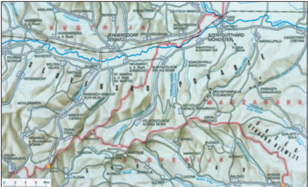
Figure 3: Geographical names in the ethnically Slovenian Rába Valley; many settlements in the Austrian state of Burgenland also have Slovenian names (Kozar-Mukić 1998).

In addition, there are characteristic Slovenian endonyms in the southern part of the Austrian states of Carinthia ( Kärnten ) and Styria ( Steiermark ; Furlan et al. 2008): Bad Eisenkappel/ Železna Kapla , Bad Radkersburg/ Radgona , Bleiburg/ Pliberk , Eibiswald/ Ivnik , Ferlach/ Borovlje , Globasnitz/ Globasnica , Hermagor/ Šmohor , Leutschach/ Lučane , Villach/ Beljak , and Völkermarkt/ Velikovec .