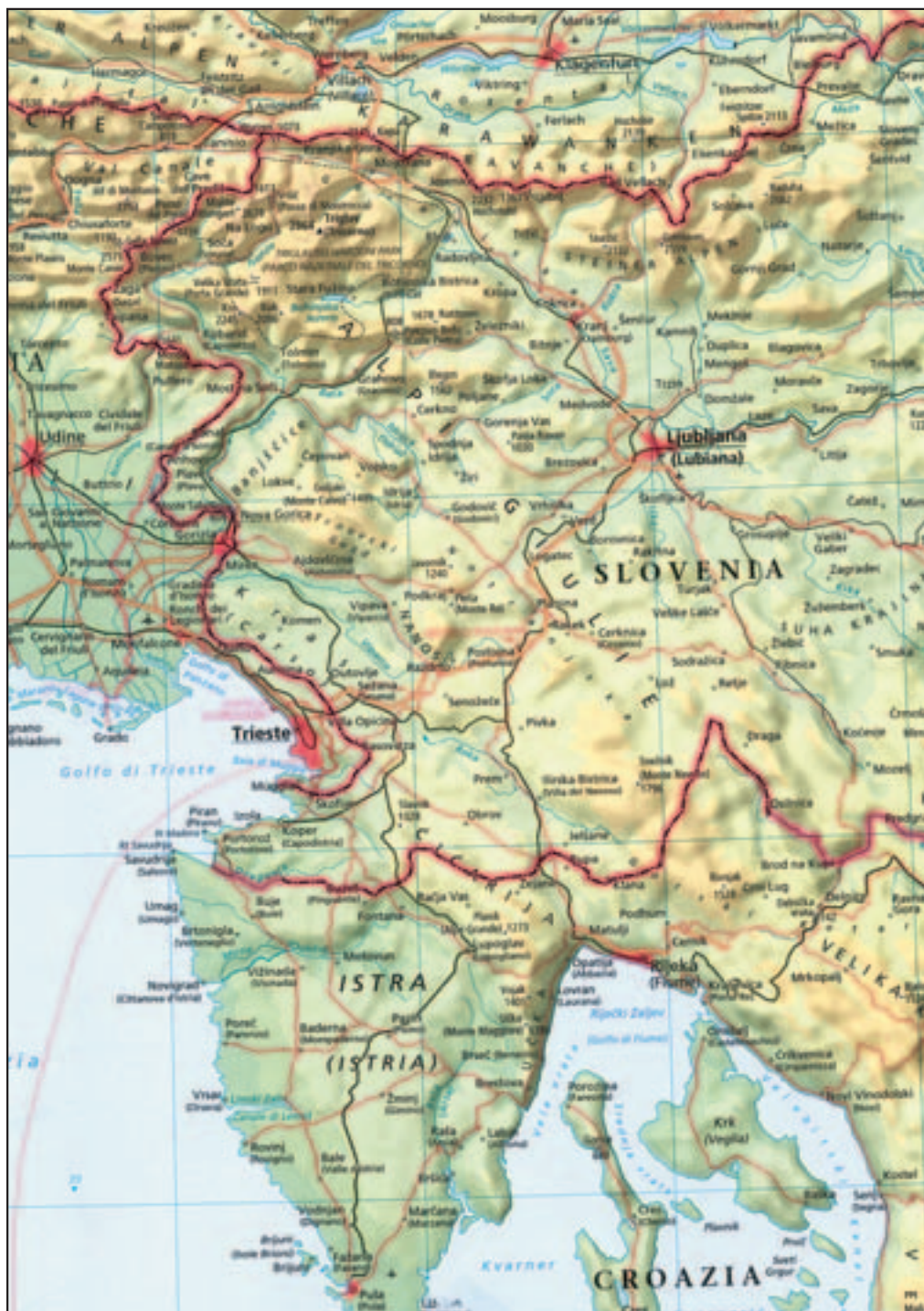
Figure 8: A map containing Italian exonyms in western and central Slovenia and neighboring countries written in parentheses (Atlante della Terra de Agostini 2002).