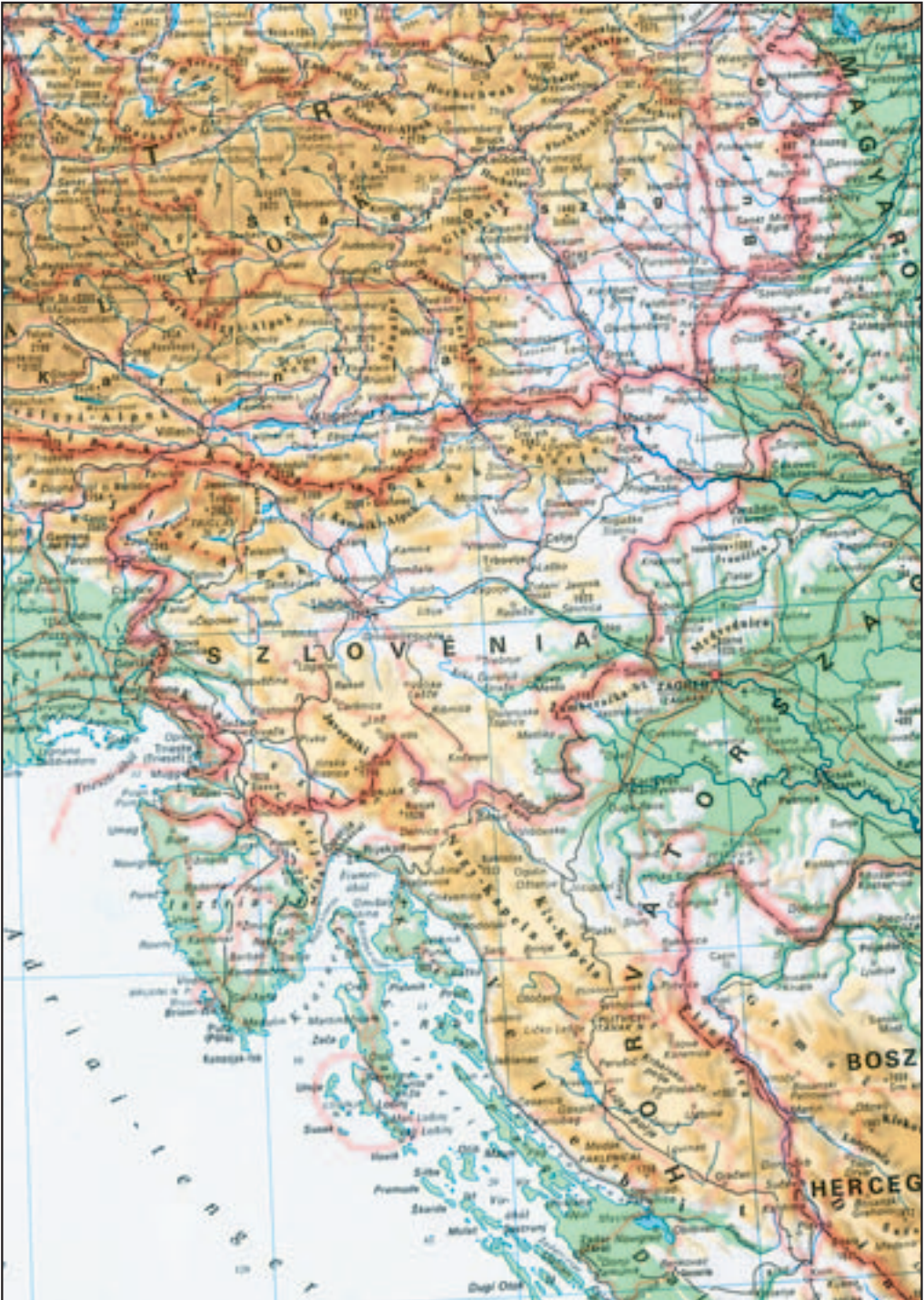
Figure 9: In the Hungarian world atlas (Cartographia Világtalasz 1995) only names of major regions and rivers appear as exonyms in Slovenia.