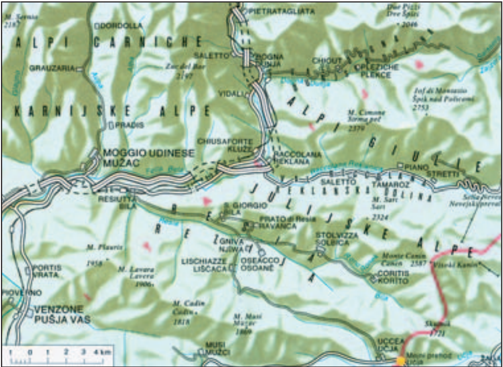
Figure 12: In the Slovenian Encyclopedia, Resian place names include letters not used in standard Slovenian (Ferenc 1996).

If Resian succeeded in establishing itself as an independent language, this would open a new question how to classify Resian dialect names in the endonym-exonym system. For the time being, they can still be characterized as Slovenian endonyms; however, if Resian became a separate language, they would become Slovenian exonyms. In fact, they would only become exonyms when converted into contemporary standard Slovenian forms, for which there has been no need so far. The Resia Valley would then have quadrilingual toponyms: Italian, Resian, Friulian, and Slovenian.