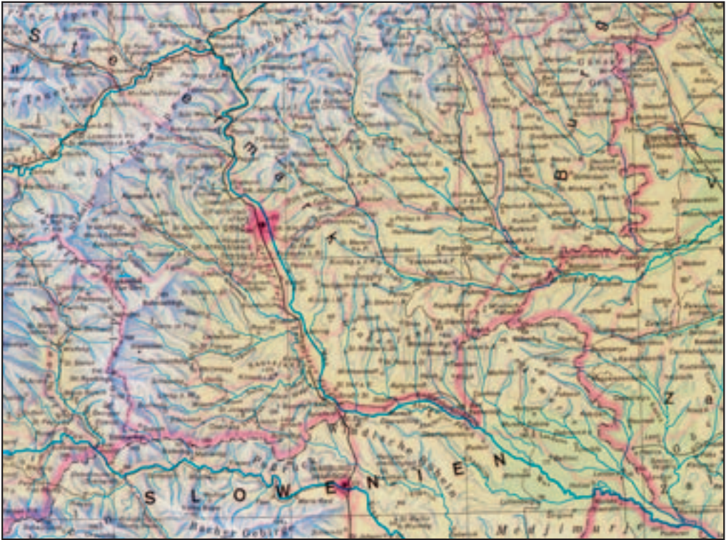
Figure 7: Unusually written names in northern Slovenia in the Orbis atlas (Der Neue Orbis Weltatlas 1992).

the German forms of the names, despite their unquestionable endonymic nature, are still endonyms or perhaps only German exonyms, or are perhaps primarily historical names. The German minority in Slovenia has no official status. If it did acquire one, this would reopen the question about many German historical names that now have the status of exonyms; with an official status of the German minority they would again become endonyms, even though it is completely clear from the functional point of view that these are historical names. They are presented below.