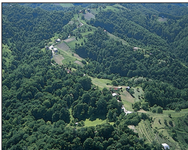
Haloze. Haloze.